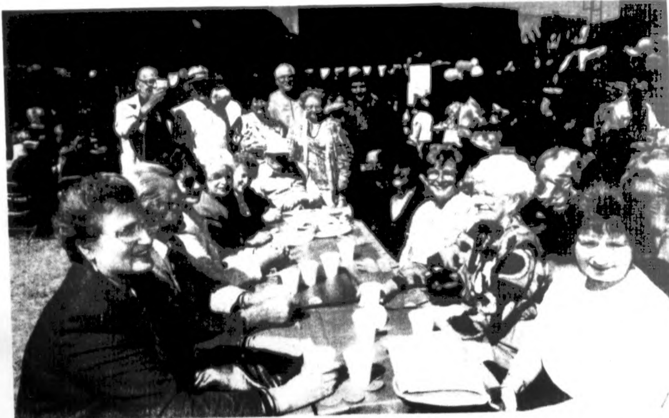
Rugsėjo 8 d. įvykusioje Lemonto LB apylinkėse gegužinėje svečiai gaivinosi ir bendrauja.