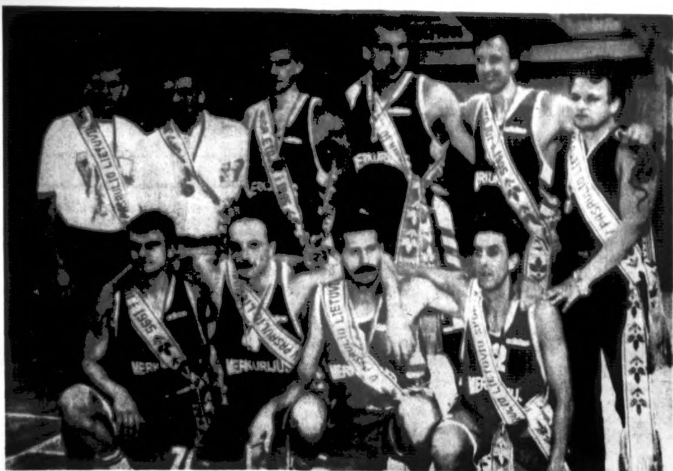
Kauno „Merkurijus“ krepšininkai – V PLS žaidynių vyrų krepšinio čempionai.