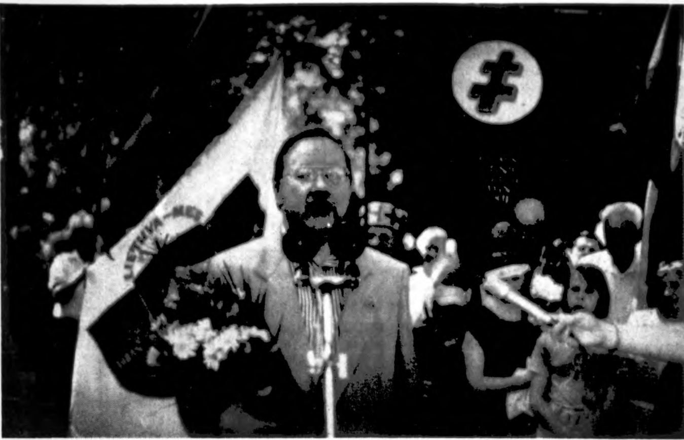
Minint Gedulo ir vilties dieną 1995 m. birželio 14, prie Politinių kalinių ir tremtinių aukuro Vilniuje kalba Tėvynės Sąjungos (Lietuvos konservatorių) pirmininkas prof. Vytautas Landsbergis.