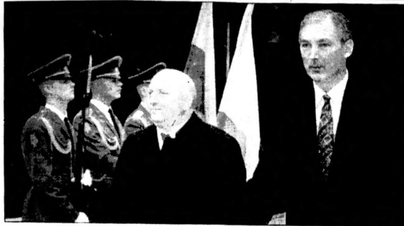
Rugsėjo 16 d. prie Lietuvos Vyriausybės rūmų Lenkijos premjeras Josef Oleksy (kairėje) su Lietuvos premjeru Adolfu Šleževičiumi apžiūrojo garbės sargybą. Vizito metu premjerai pasirašė sutartį dėl pasienio tarnybų bendradarbiavimo, kuri taip pat yra pirmasis žingsnis Lietuvos įstojimui į Vidurio Europos prekybos sąjungą CEFTA. Šis žingsnis, Lietuvos premjero manymu, pagerins Lietuvos perspektyvas ir narystei Europos Sąjungoje.