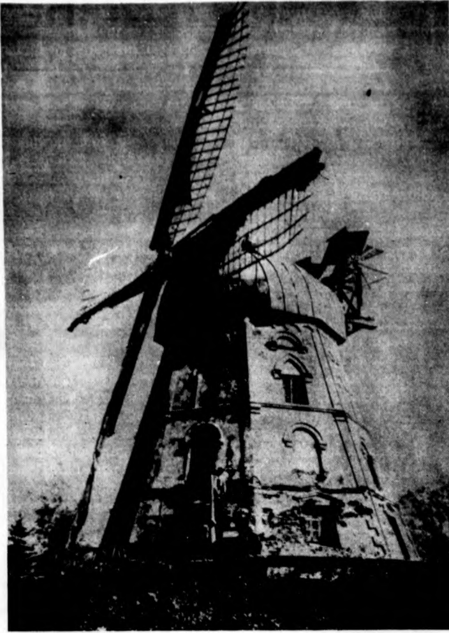
Mūrinis Baisiogalos malūnas 1923 metais.

Represijų Lietuvoje tyrimo centro pagrindinis uždavinys — paskelbti sąrašą bent tų genocido aukų, apie kurias šiandien jau turime duomenis, ir surinkti tai, kas dar yra saugoma žmonių atmintyje. Tikimės, kad to paties siekia ir Lietuvos tautinės kultūros fondas bei jo rėmėjai.