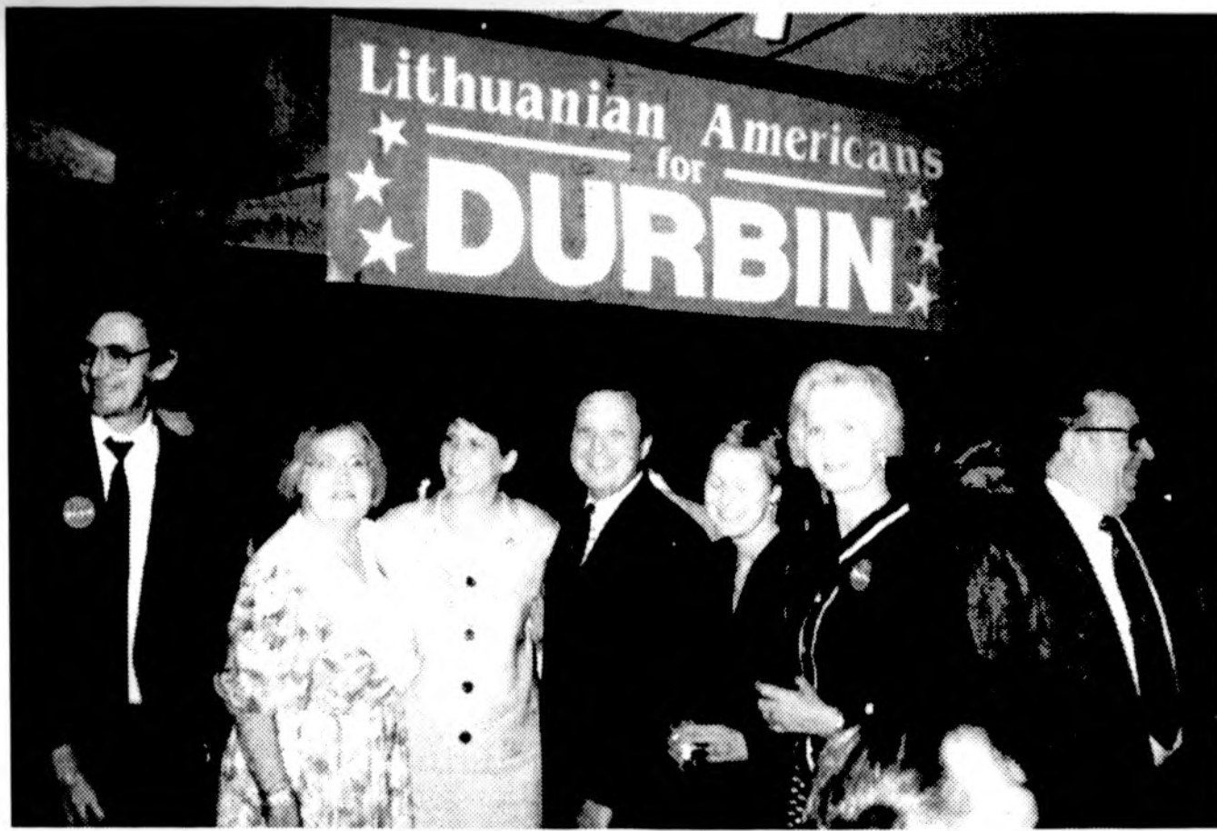
„Amerikos lietuviai remia Richard Durbin kandidatūrą“ Gausiai susirinkę svečiai Pasaulio lietuvių centre rugšėjo 15 d. tikrai įrodė tų žodžių tiesą...