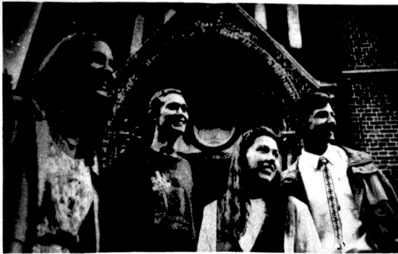
Būrelis Žemaitijos ateitininkų prie bažnyčios Palangoje.