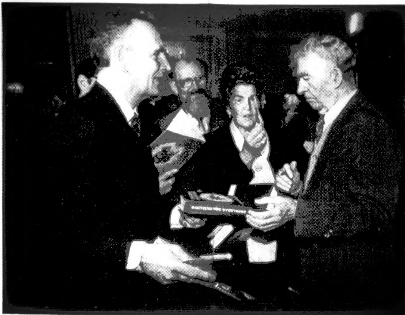
Poetas Bernardas Brazdžionis Kaune duoda autografus Kauno miesto tarybos nariams. Rugsėjo 21 d. miesto tarybos neeiliniame posėdyje jam buvo suteiktas Kauno garbės piliečio vardas už ypatingus nuopelnus Lietuvai ir miestui. 1989 m. pirmą kartą sugrįžęs į Lietuvą, B. Brazdžionis tais metais tapo Poezijos Pavasario laureatu, 1994 m. Vytauto Didžiojo universitetas jam suteikė garbės doktoratą.

— Lietuvoje praėjusią savaitę buvo šalta ir lietinga. Dienomis buvo 12-14 laipsnių Celsijaus (53-57 F), naktimis — 7-10 C (45-50 F) laipsnių. Namuose ir įstaigose dar nešildoma. Dėl to, pasak gydytojų, daug žmonių