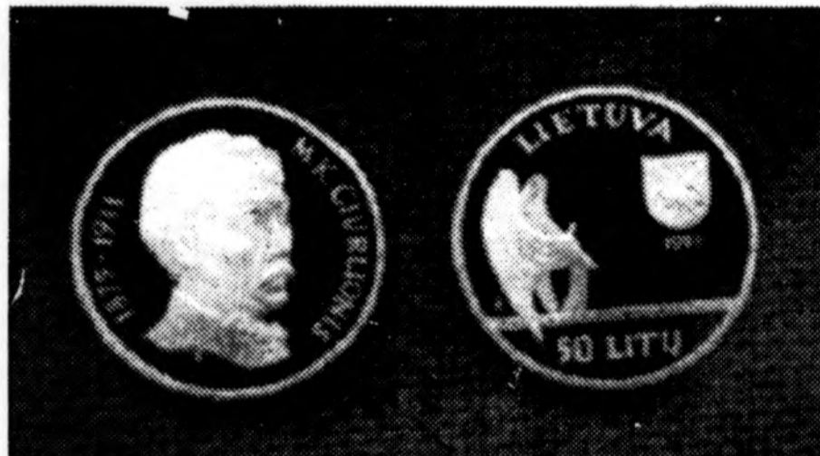
Lietuvos kompozitoriaus-dailininko M. K. Čiurlionio 120-osioms metinėms rugsėjo 19 d. išleistas monetos projektas. Iš aukščiausios prabos sidabro pagamintos, 34 mm (1.3 colių) skersmens monetos briaunoje yra žodžiai: „Pasaulis kaip didelė simfonija“.

Tad leiskite, brangūs broliai ir seserys, pakviesti susimąstyti: koks atėjo į mūsų tarpą Stasys Lozoraitis? Pakviesti, vedant Jo dvasios, atspiraštį Jį Tautą, deikia išpažinti amžinąsias tiesas ir vertybes, ir jomis gyventi. Kviečiame, kad visi