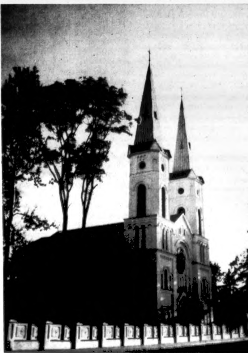
Nauji Sintautų bažnyčia, pašventinta 1995 m. vasarą.