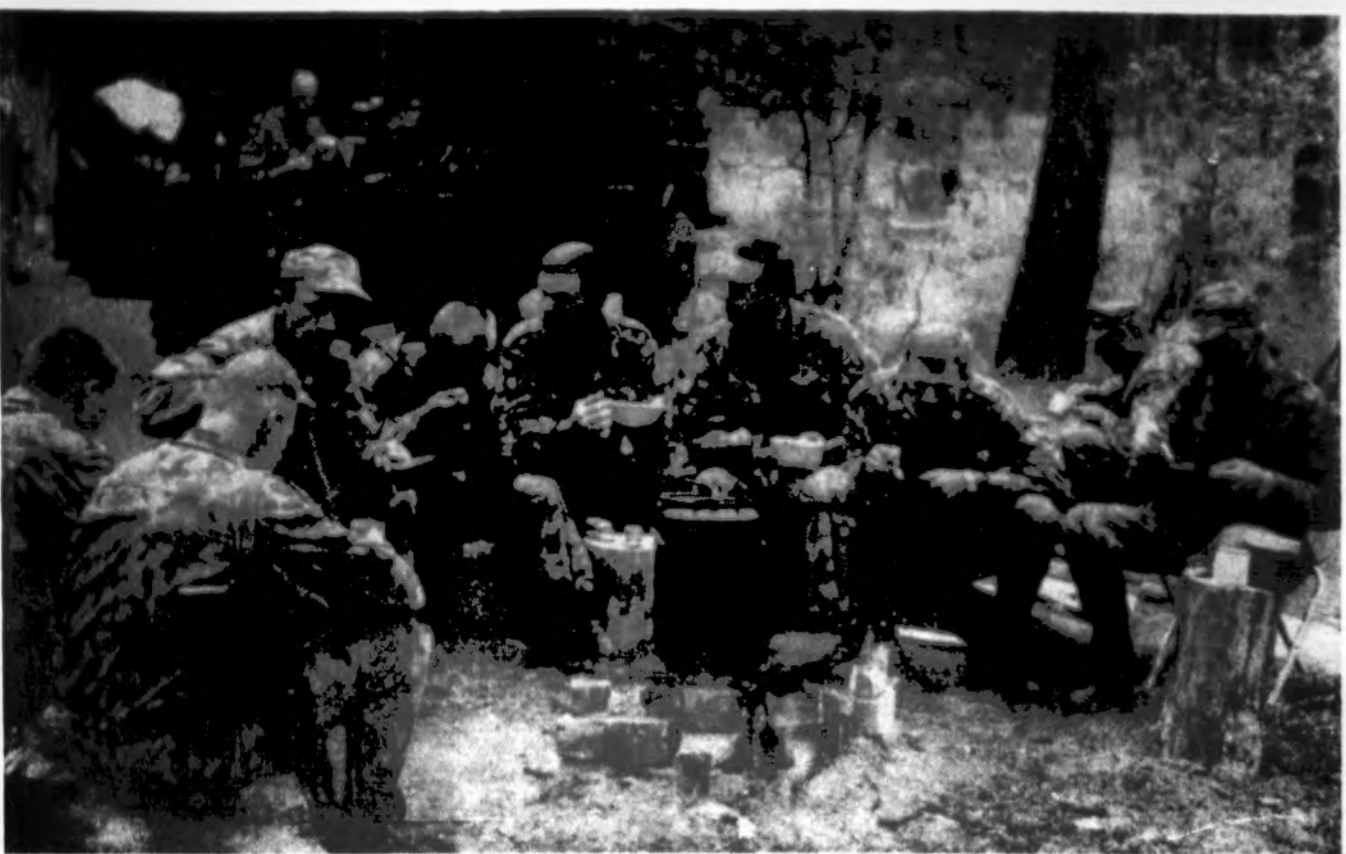
SKATO kariai užkandžiauja lauko virtuveje „Džukija-95“ žygio metu š.m. birželio mėn.

• Antrojo pasaulinio karo metu, 1945 m. kovo 9 d., JAV bombonešiai apmėtė Japonijos sostinę Tokiją padegamosiomis bombomis. Oro puolimo metu žuvo bent 120.000 žmonių.