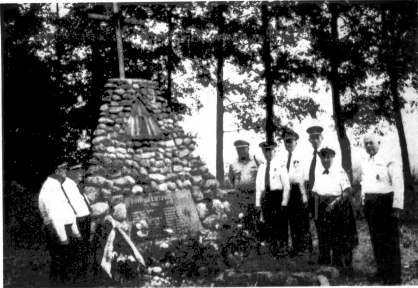
Jurbarko rajone, Simulaičių miške, pastatytas paminklas ten žuvusiems partizanams. Nuotraukoje – grupelė šaulių iš JAV š.m. liepos mėnesį.

Daug žmonių išvežta Vokietijon darbams. Darbovietės turi skirti tam tikrą skaičių darbininkų. Su policijos pagalba juos surenka. Mane jau ketvirtą sykį ragina, bet vis išsisuku, išvažiuodama į kaimą. Policija net ir butą ateina, bet manęs nėra. Per šeiminių butą ir lauke aš. Galvoju, jog mano trys broliukai jau dirba jiems ir to turėtų būti gana iš vienos šeimos. Tegul pakrato tuos „paraudusius“, tegul jie ten atgailauja. Aš visiems esu sakiusi, kad į Vokietiją važiuosiu tuomet, kuomet rusai bus prie Vilniaus. Tėvynėje būsiu iki paskutinio momento, nes ji yra mano ir ją visa širdimi myliu.