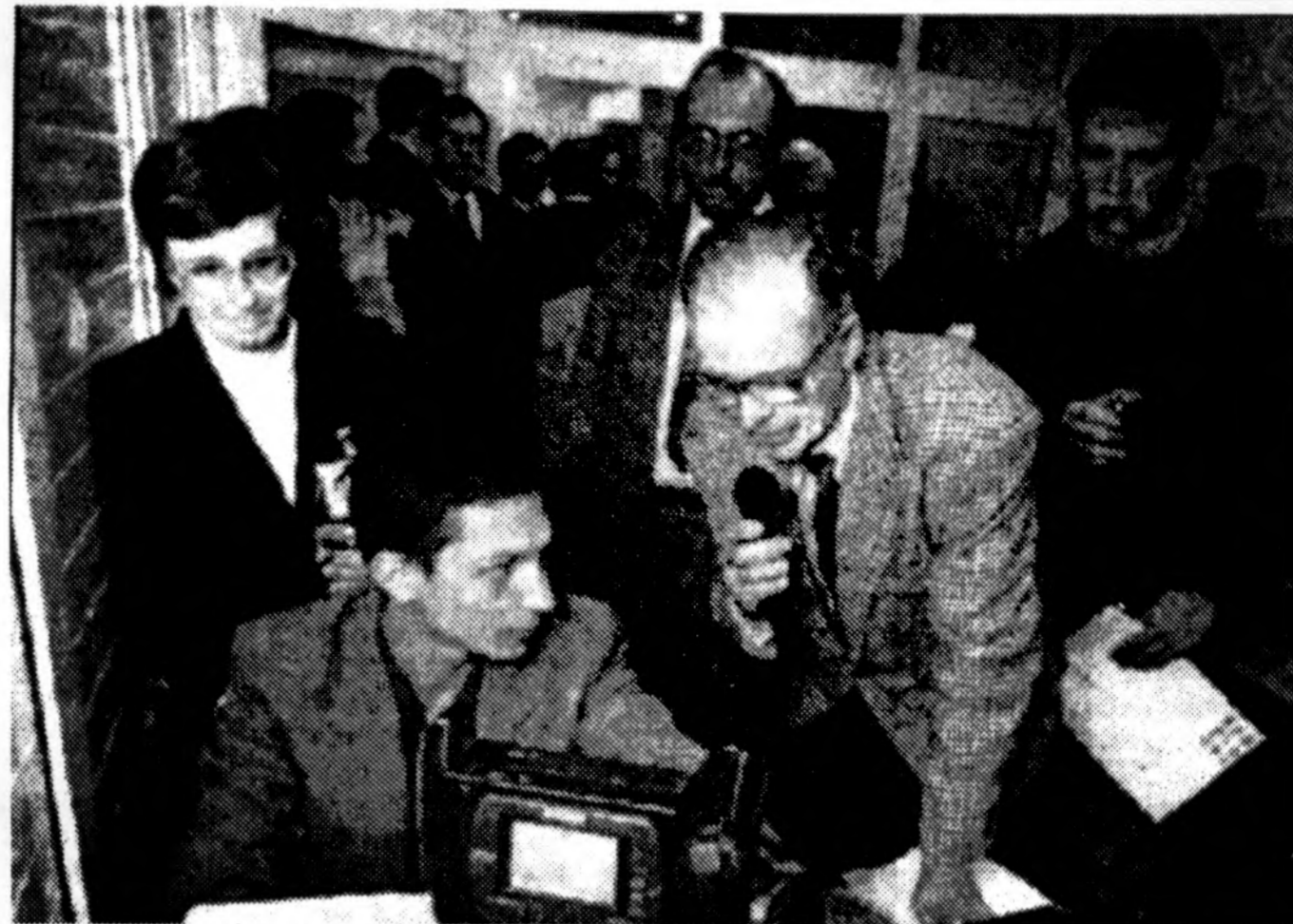
Bendros Lietuvos JAV įmonės UAB Omnitel Kauno skyriaus darbuotojai rugsėjo mėnesį supažindino verslo žmones ir žurnalistus su naujomis jų teikiamomis pasaulinio kompiuterinio tinklo Internet ir World Wide Web paslaugomis, leidžiančiomis duomenis persiųsti į daugelį pasaulio šalių elektroniniu paštu, ir duodantis vaizdo ir garso ryšio galimybes. Pristatymo metu veikė videotiltas tarp Vilniaus ir Kauno abonentu.