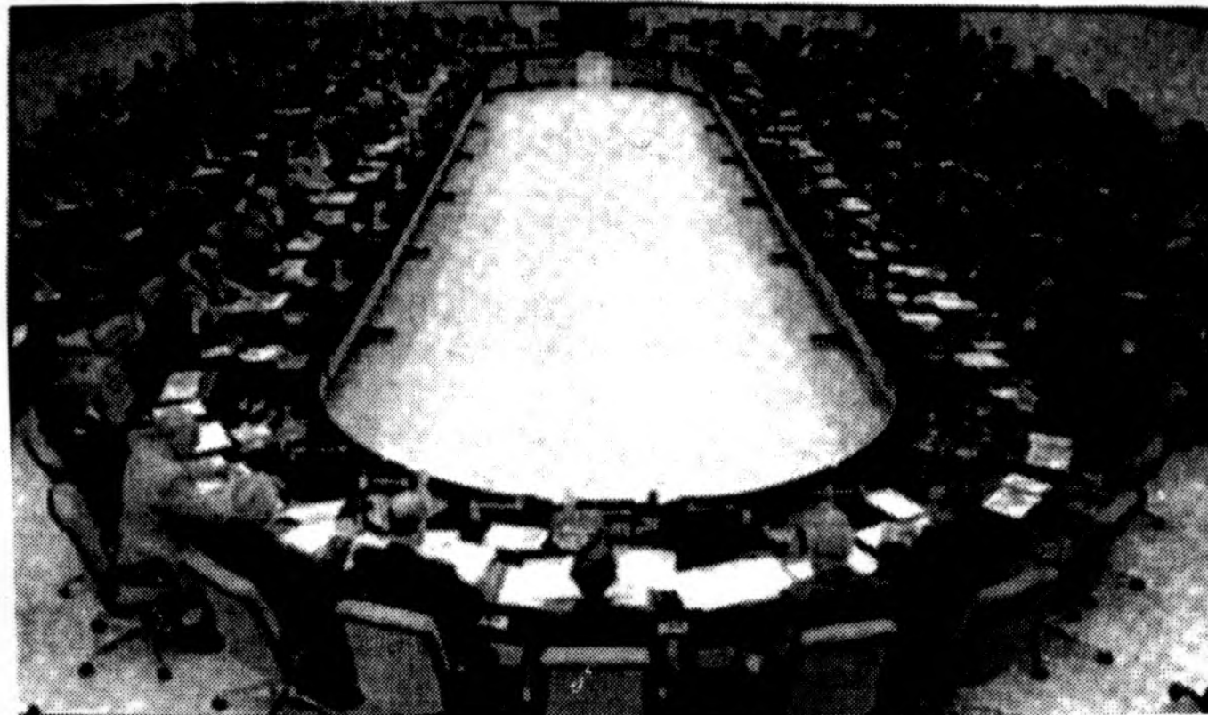
Brukselyje, NATO konferencijų salėje posėdžiauja narių-šalių užsienio reikalų ministrai. Praėjusią savaitę paskelbta žinia, kad NATO šalių gynybos ministrai nutarė atidėti NATO narystės plėtimą, pareigūnai Brukselyje priminė, kad tokie sprendimai priimti gali tik šalių užsienio reikalų ministrai. Tačiau manoma, kad gynybos ministrų rekomendaciją pastarieji priims.

Valstybės departamente Lietuvos diplomatas buvo patikintas, kad netrukus JAV vyriausybė diplomatiniais kanalais pareišk Maskvai savo nuomonę dėl rengiamos Rusijos gynybos doktrinos, pranešė Radiocentras.