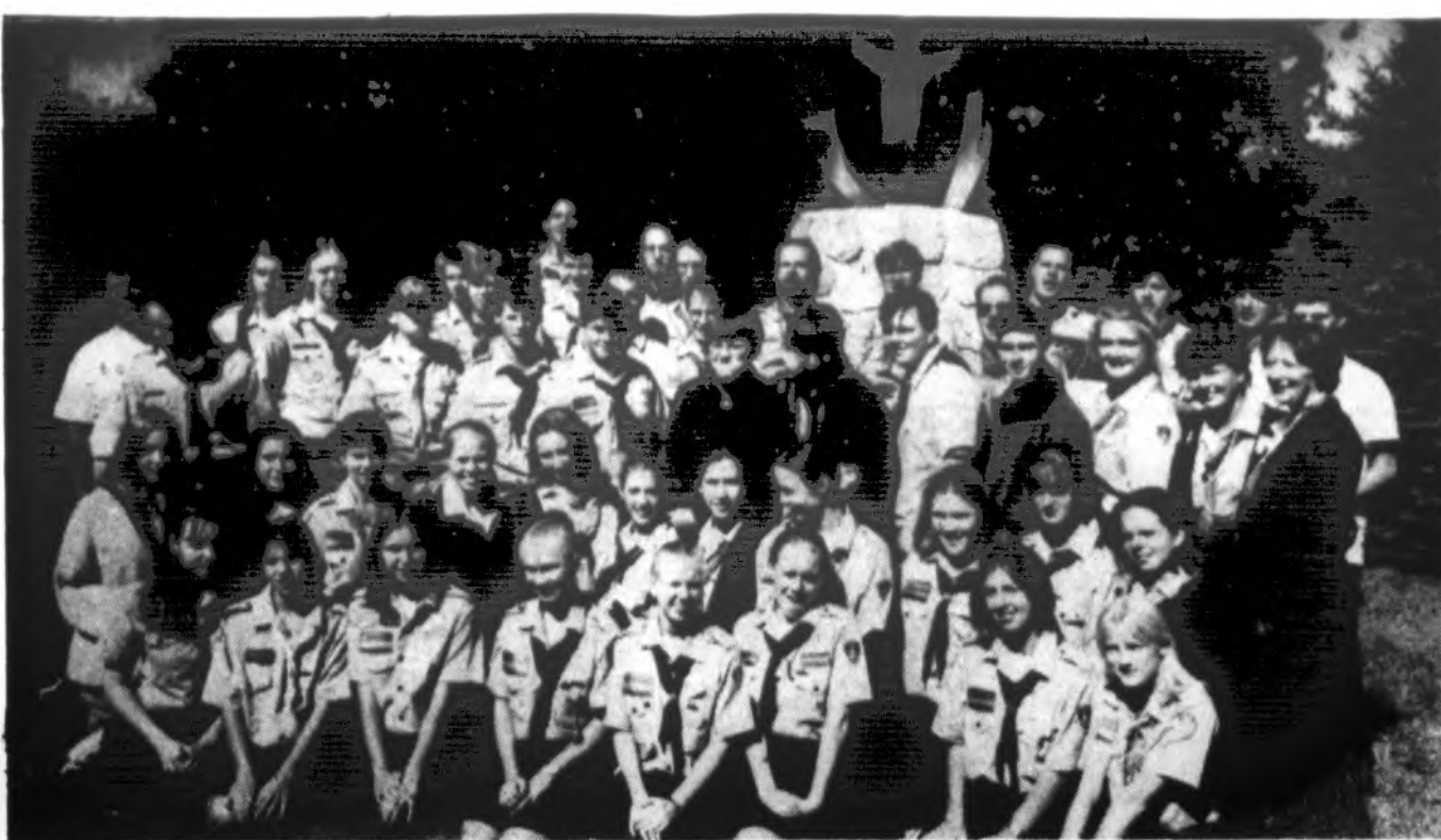
„Praeitis – Ateitis“ suvažiavime, Dainavoje, dalyvavęs skautiškas jaunimas.