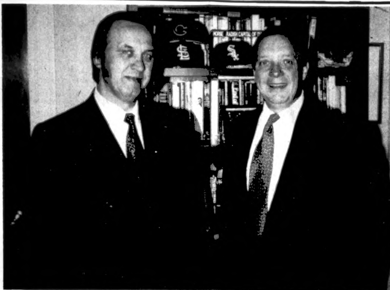
JAV Atstovų rūmų narys Dick Durbin (D-IL) (dešinėje) rugsėjo mėn. pabaigoje savo kabinete Vašingtone kalbėjosi su Lietuvos užsienio reikalų ministru Povilu Gyliu. Min. Gylys jam padėjo už teikimą H.R. 7 Rezoliucijos, kurioje pasisakoma ir už Baltijos šalių teisę stoti į NATO. Susitikimo metu jie taip pat aptarė Lietuvos ekonominę padėtį, kuri padarė matomą pažangą, ir apie didėjančią Lietuvos prekybą su Vakarais. Jie kalbėjosi ir apie Rusijos kariuomenės buvimą Karaliaučiuje, kuris tebekelia Lietuvai susirūpinimą. Kongr. Durbin užtikrino min. Gylį, kad jis ir toliau rūpinsis, kad ir jo kolegos JAV Kongrese suprastų ir remtų Lietuvai svarbias pozicijas.

Pasak jo, Rusija ir po parlamento bei prezidento rinkimų neatsisakys rinkos ekonomikos, nes tą garantuoja Konstitucija.