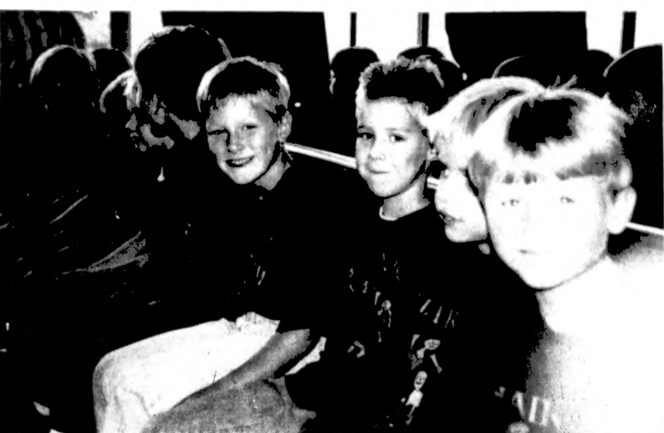
Po ilgos karštos vasaros draugai vel susitiko Maironio lit. mokykloje Lemonte, pirmąjį šių metų dieną, rugsėjo 9.

x NAMAMS PIRKTI PASKOLOS duodamos mažais mėnesiniais įmokėjimais ir prieinamais nuosimčiais. Kreipkitės į Mutual Federal Savings, 2212 West Cermak Road – tel. (312) 847-7747.