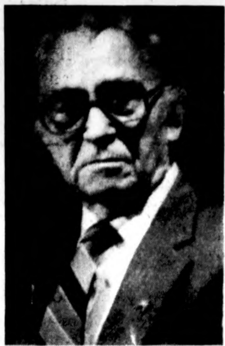
Poetas Bernardas Brazdžionis

Rugsėjo mėnesį Kauno miesto taryba vienbalsiai priėmė sprendimą, kuriuo už ypatingus nuopelnus Lietuvos Respublikai ir Kaunui didžiai gerbiamam poetui Bernardui Brazdžioniui, suteiktas Kauno miesto Garbės piliečio vardas. Tai devintasis žmogus, kuriam, po jau amžinybėn išėjusių J. Urbšio, V. Kuprevičiaus, G. Landsbergio-Žemkalnio, M. Žilinsko, taip pat Lietuvos kardinolo V. Sladkevičiaus, Kovo 11-osios akto signataro, buvusio Lietuvos Respublikos Aukščiausiosios tarybos pirmininko, profesoriaus V. Landsbergio, vyskupo S. Tamkevičiaus suteiktas šis garbingas vardas.