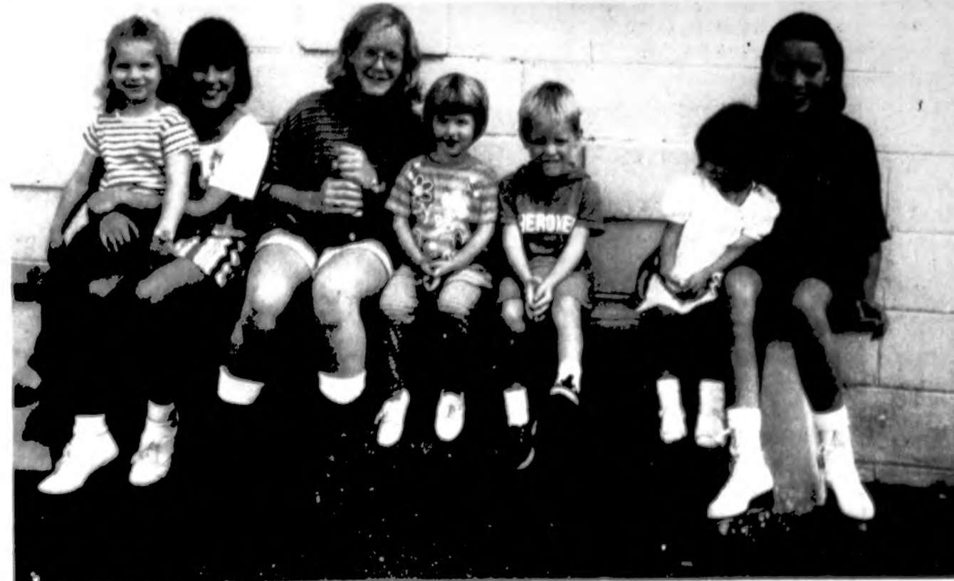
Jaunieji ateitininkai š m. Dainavoje vykusiose ateitininkų Studijų dienos.