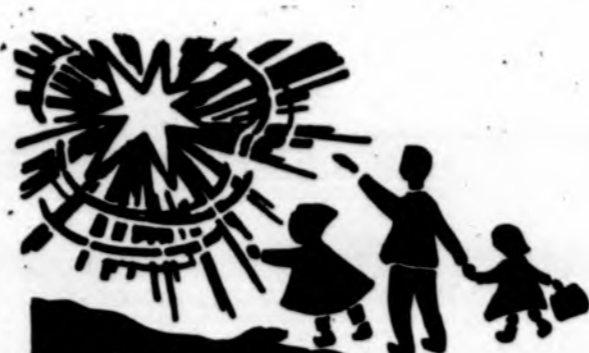
Redaguoja J. Plačas. Medžiagą siųsti: 3206 W. 65th Place, Chicago, IL 60629

x „Dangaus skliautai“ — 24-tosios kasmetinės lietuvių fotografijos parodos atidarymas šį penktadienį, lapkričio 3 d. 7 v.v. Čiurlionio galerijoje, Jaunimo centre. Paroda rengia Budrio lietuvių foto archyvas. Visi kviečiami atsilankyti. (sk.)