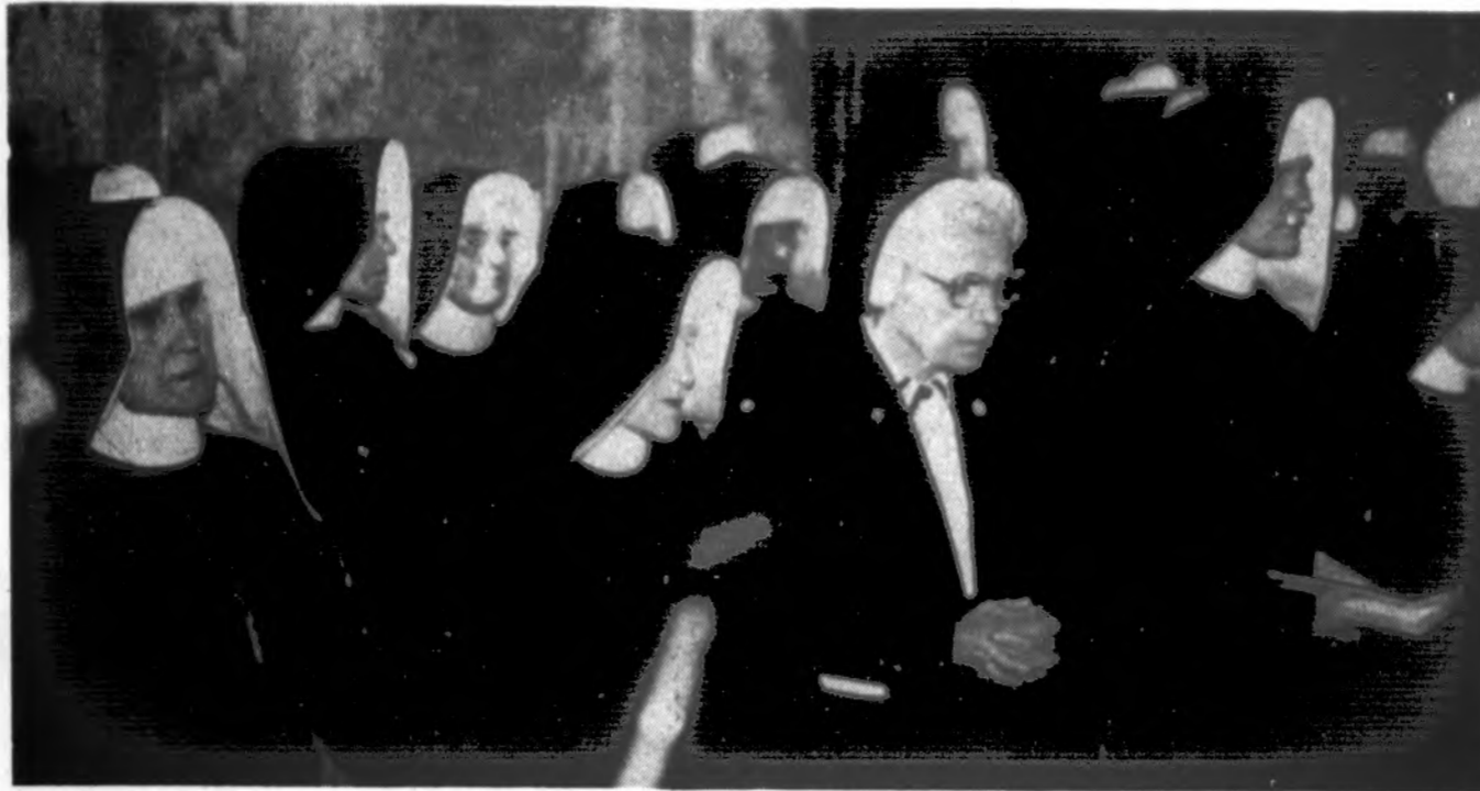
Šv. Kazimiero seserų kongregacijos narės, pašventinant Pažaislio vienuolyno bažnyčią.

Nepriklausomybės metais Lietuvos vyriausybė apiplėšė vienuolyną su pastatais, bažnyčia ir žeme atidavė iš JAV atvykusioms Šv. Kazimiero kongregacijos seserims, kurios rūpinosi Pažaislio vienuolyno restauracija. Tačiau bolševikų okupacijos metais vienuolynas buvo likviduotas, vienuolės išvarytos, nacionalizuota žemė, Svečių namai. 1948 m. visiškai uždarytas ir įsakyta per 3 dienas išsikraustyti. Po to į Pa-