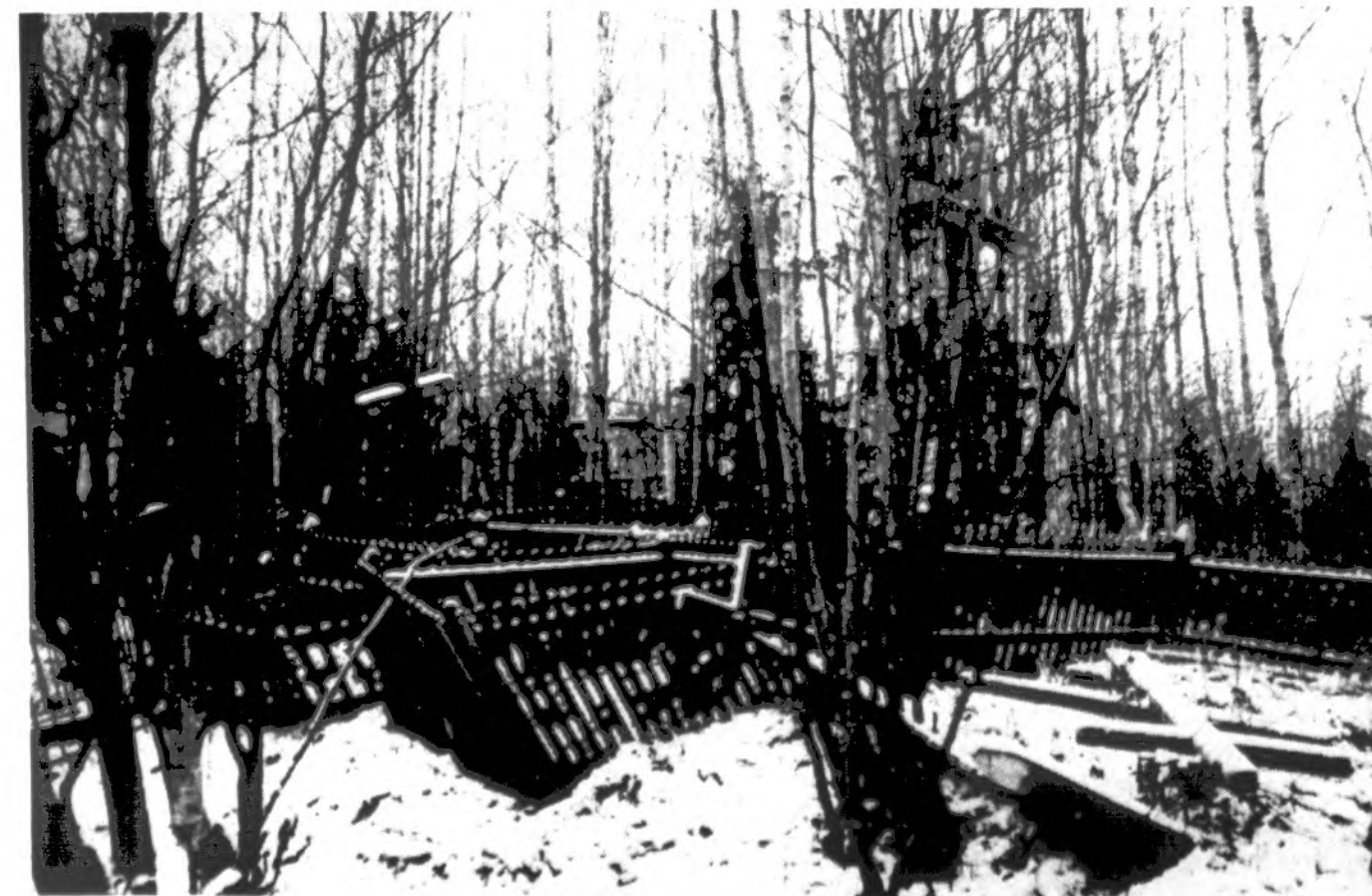
Apleistos, bet nepamirštos, lietuvių kapinės Igarke.