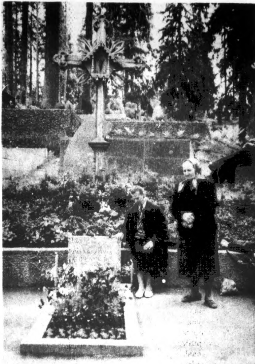
Gėlės ir maldos prie žuvusių Medininkų didvyrių kapo.