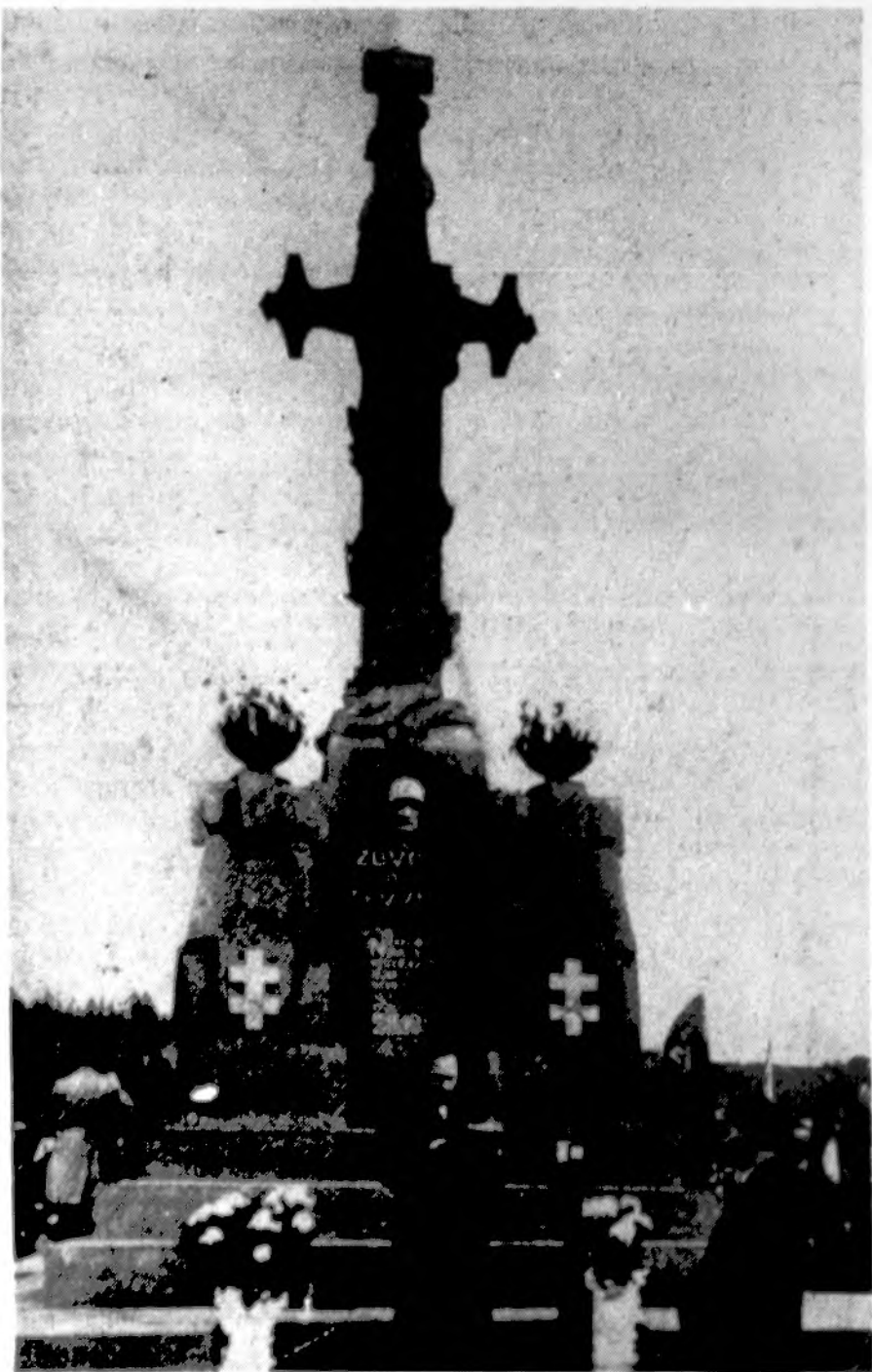
Žuvusiems Lietuvos kariams paminklas Kauno kapinėse.