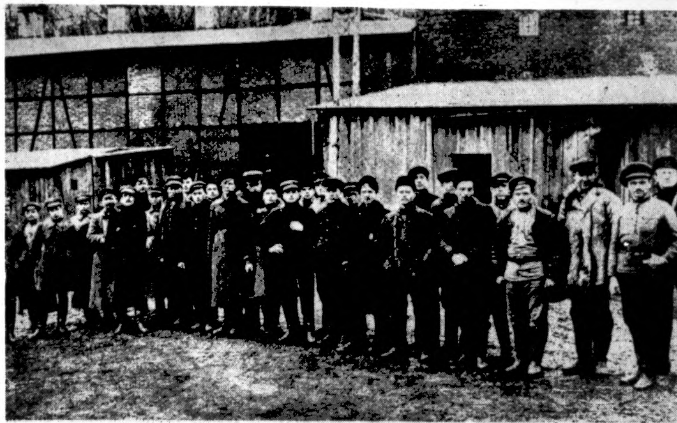
1919 m. pirmieji savanoriai raitininkai.