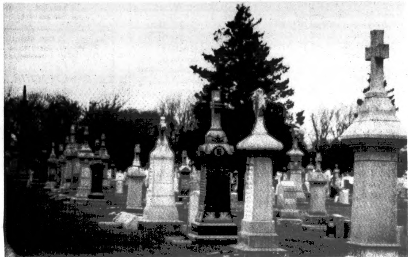
Vėlinių melancholija Šv. Kazimiero kapinėse, Čikagoje.

me, įtraukiant vyriausybės, Vyskupų konferencijos bei kitų tradicinių konfesijų atstovus. Paklaustas apie Lietuvos Respublikos prezidento nuomonės nežinąs, tačiau pridūrė, kad jis dažniausiai palaikąs Bažnyčios poziciją. (Katalikų bažnyčia Lietuvoje, Nr. 9)