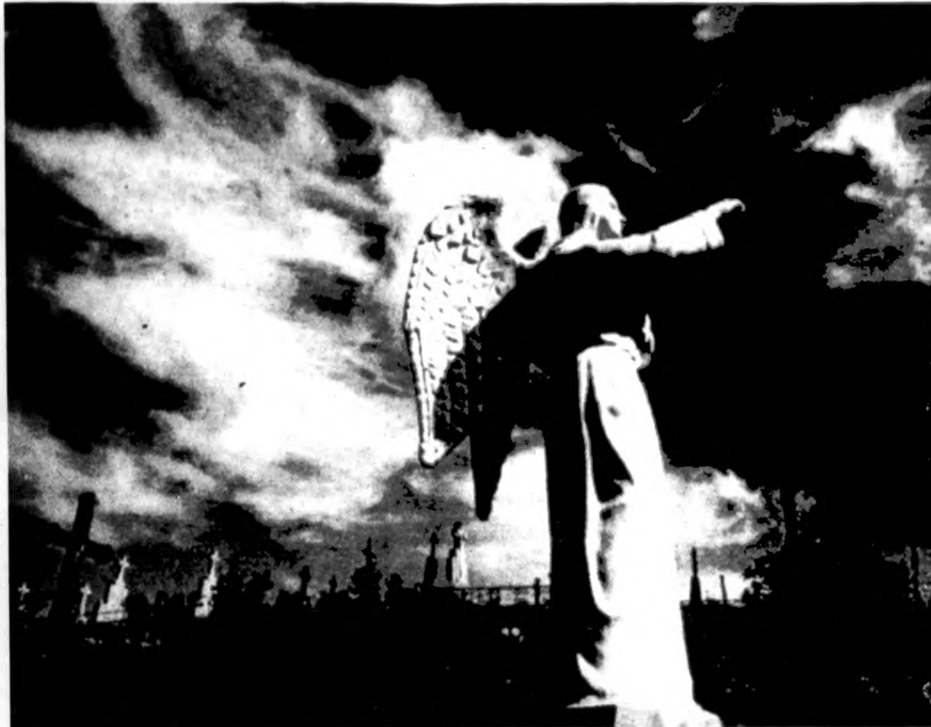
Žemaitija, 1977. Varsėdžių kapinės.