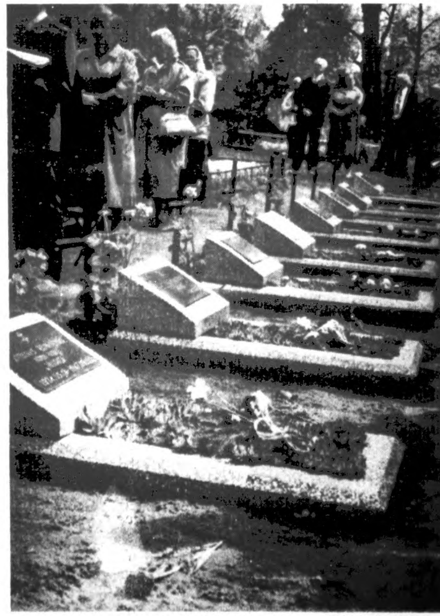
Cia rado amžino poilsio vietą lietuviai partizanai (Digrių kapinės)