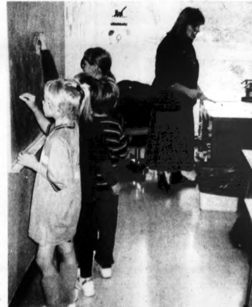
„Kas skaito, rašo – duonas nepraso...“ Lemonte veikiančios Maironio vardo lit. mokyklos mokiniai mokosi lietuviškai rašyti.