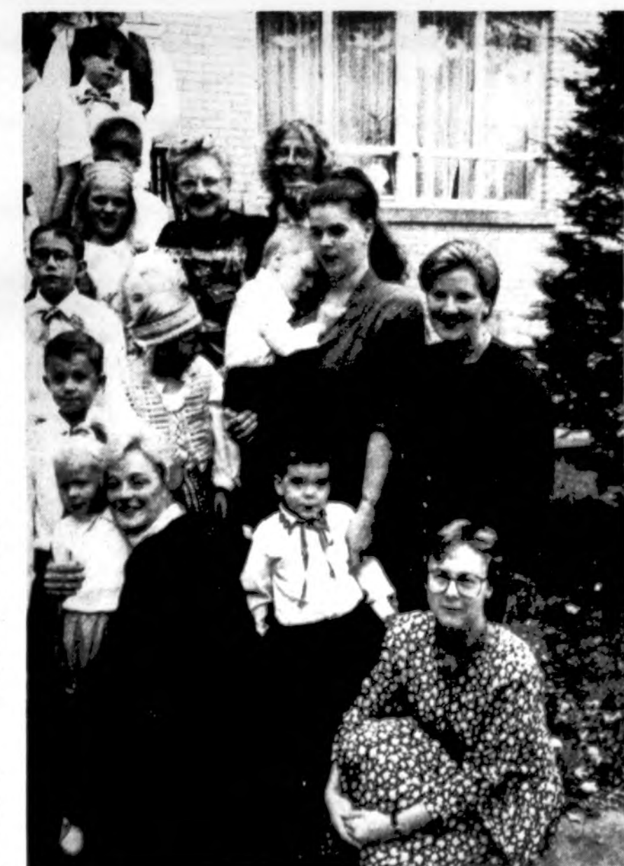
Mamos, mokytojų, mokiniai — tai kiekvieno šventės dalyvis, jau kelis dešimtmečius gyvuojanti užsienio lietuvių tauta. Čia vieno šeštadienio rytas prie Jaunimo centro, kur veikia Čikagos lit. mokykla.

Draugo fondas , „Drauga“, „Drauga“ remia mus visus.