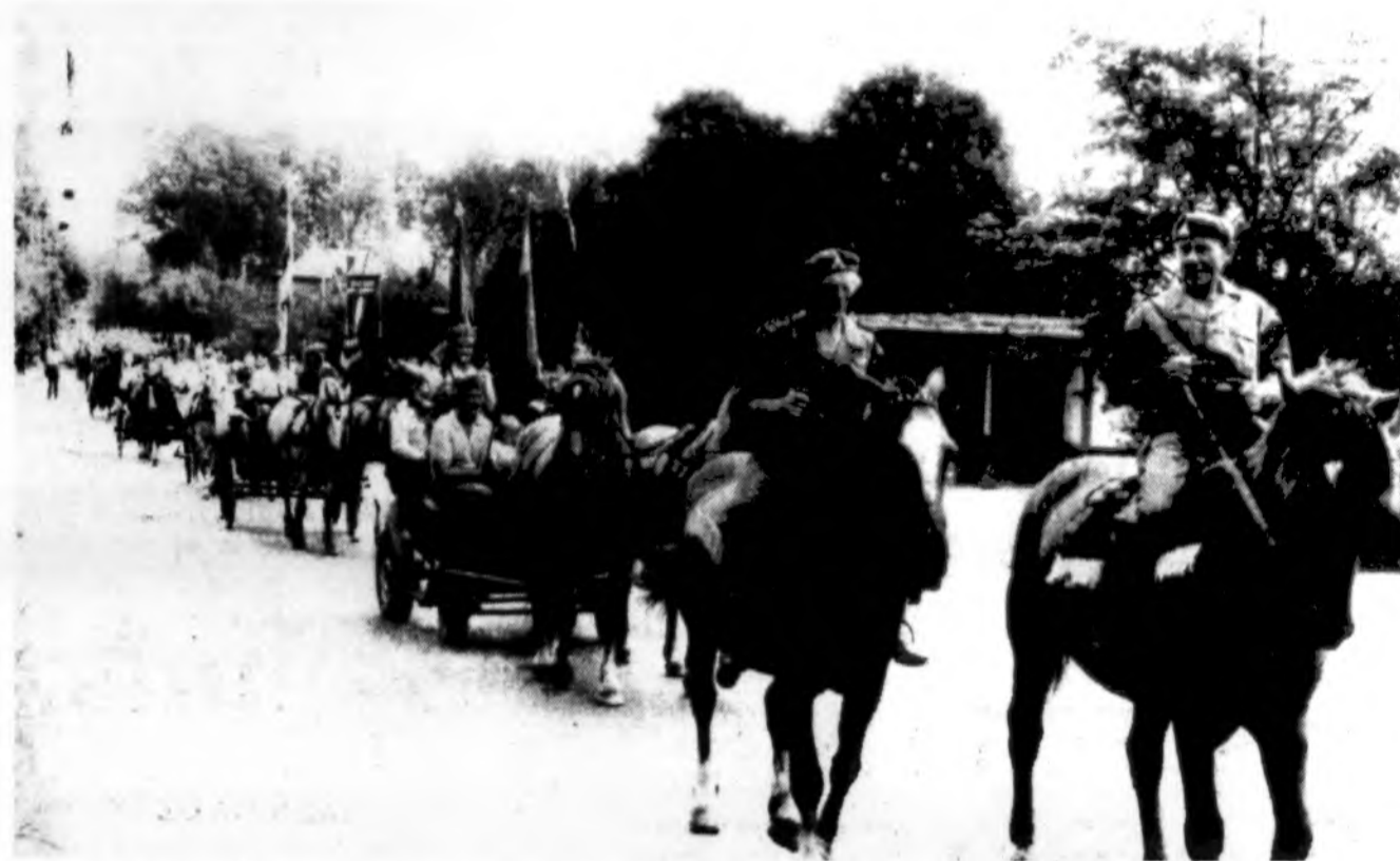
Šią vasarą Veiveriuose, pagerbiant žuvusius dėl Lietuvos laisvės, procesija į Skausmo kalnelį.