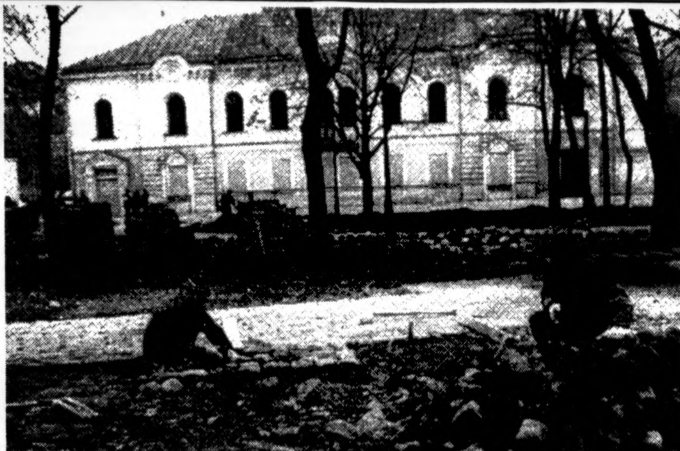
Kaune, sodelyje prie buvusios Prezidentūros bus pastatytos trijų nepriklausomos Lietuvos prezidentų skulptūros. Artimiausios prie rūmų stovės Antanas Smetona, o kiek toliau, abiejose sodelio pusėse - Aleksandras Stulginskis ir Kazys Grinius. Nors skulptūros dar tik liejamos, jau ruošiami jų pamatai, baigiami grįsti tašyto akmens takeliai. Skulptūros bus atidengtos vasario 16 d.

Valsybinės Mokesčių Inspekcijos viršininkas sako, kad susiformavusi „tradicinė“ mokesčių