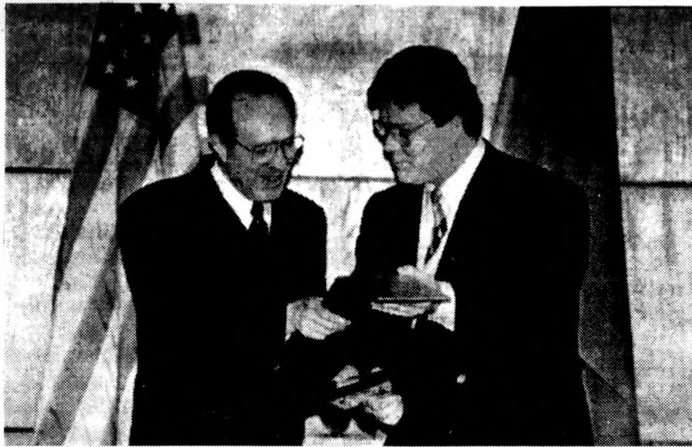
JAV gynybos sekretorius William Perry ir Lietuvos krašto apsaugos ministras Linas Linkevičius lapkričio 21 d. apsikeitė dovanomis. V. Landsbergiui spaudos konferencijoje paklausus, ar Vakarai žiūri į Lietuvą kaip į problemą ar kaip į progą išplėsti saugumo ir stabilumo zoną Europoje, W. Perry pasakė, kad negali nieko žadėti, bet jei Rusija pasuks antidemokratinę linkmę, NATO bus greičiau plečiama. Tuo tarpu, JAV kitais metais padvigubins karinę pagalbą Lietuvai. Vizito metu pasirašyta Lietuvos ir JAV gynybų bendradarbiavimo sutartis.

Kopenhagoje taip pat nutarta, kad trys Baltijos šalys privalo suformuoti dar vieną bendrą trisdešimties pėstininkų būrį, kuris pavojingose misijose būtų atsarginis. Kitas BALTBAT kūrėjų pasitarimas vyks kitų metų