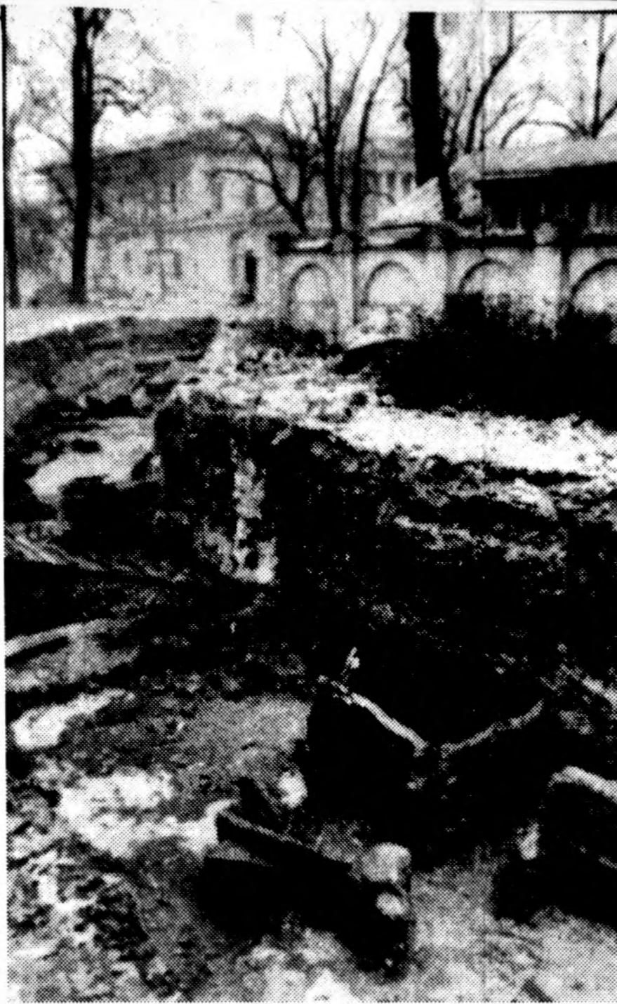
Prie naujosios Prezidentūros, įsikūrusios buvusiuose Menininkų rūmuose, kasant griovį ryšiu kabeliams tiesti, rasti toje vietoje buvusių Vyskupų rūmų parko 16-17 amžiaus medinių amatininkų miestelio pastatų pamatai ir statiniai, bei juose paliktų dirbinių fragmentai. Archeologai yra įteikę prašymą per vieną vasarą ištyrinėti Prezidentūros parko plotą, o po to jau žada užleisti sodininkams ir parko planuotojams.

Algirdas Saudargas pažymėjo, kad nedera skubėti formuoti gynybos sąjungą dar ir dėl to, kad Baltijos valstybės nevisuomet būna solidarios. Jis