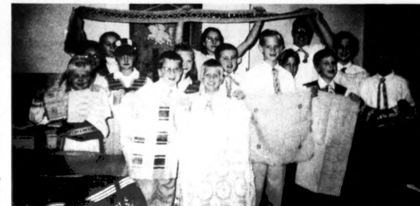
Maironio mokyklos, Lemonte, penkto skyriaus mokiniai džiaugiasi savo iš namų atsinešais audiniais, nes teko mokytis apie Lietuvos linus ir jų apdirbimą.