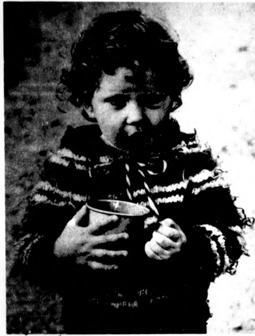
„Ačiū už pienelį...“, sako mažas našlaitis Lietuvoje, kai Našlaičių globos komitetas pasirūpino, kad jo puodeliukas nebūtų tuščias.

Visi remkime Lietuvos Fondą, nes Lietuvos Fondas remia lietuvių.