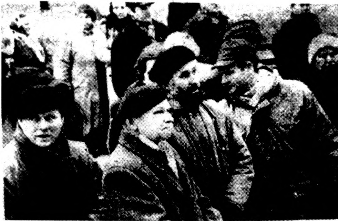
Lapkričio 31 d. Vilniuje, Nepriklausomybės aikštėje prie Seimo rūmų vyko demonstracijos Tilžės akto 70-mečiui paminėti. Nors demonstracijos dalyvių buvo tik apie 40, jie reikalavo, kad Tilžės aktas būtų vykdomas. 1918 m. pasirašytu aktu, paremtu tautų laisvo apsisprendimo teise, Mažosios Lietuvos Tautinė Taryba prašė Mažąją Lietuvą prijungti prie didžiosios Lietuvos.

„Nesiskaitymo su lietuvių tautinėmis mažumomis faktai, jeigu kaimyninės valstybės jų nešalina, turėtų būti iškelti tarptautinėse organizacijose. Vyriausybė, kuri nepasiekia vieno ir nedaro kito, neatlieka savo pareigų“, sakoma penktadienį paskelbtame Tėvynės Sąjungos (Lietuvos Konservatorių) partijos pirmininko V. Landsbergio pareiškime.