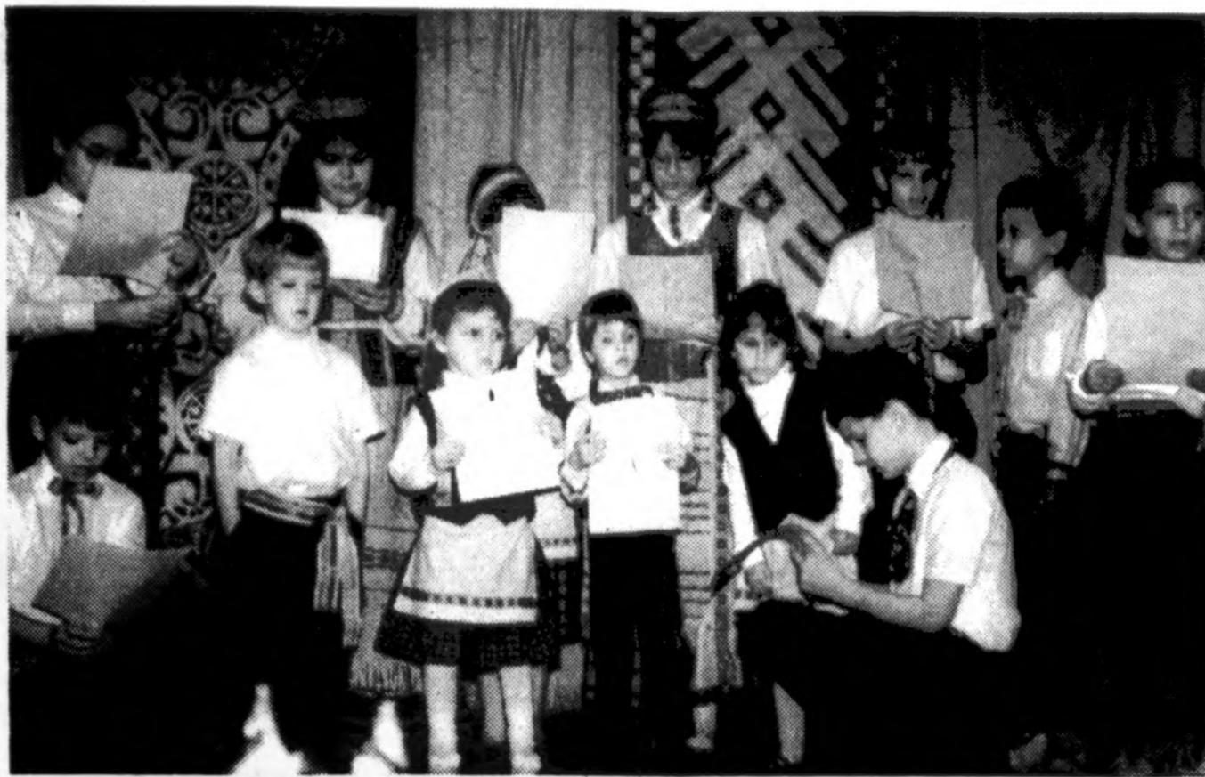
Šv. Kazimiero lit. mokyklos (Gary, IN) mokiniai Kalėdų eglutės programoje gruodžio 17 d.

x NAMAMS PIRKTI PASKOLOS duodamos mažais mėnesiniais įmokėjimais ir prieinamais nuosimčiais. Kreipkitės į Mutual Federal Savings, 2212 West Cermak Road — tel. (312) 847-7747. (sk)