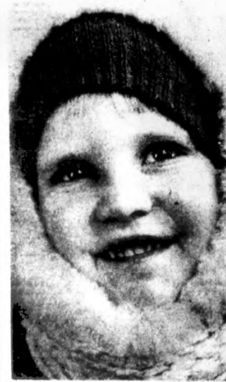
Kalėdų Vilties žiburėliai vaiko akyse...