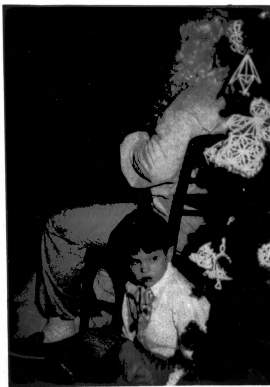
Jauniausias „vyčiukas“ nelabai domisi Kalėdų seniu — turbūt žino, kad jis nėra tas tikrasis... Vaidelis iš Lietuvos Vyčių atliktos kalėdinės programos Mokslo ir pramonės muziejuje pereinutį metų gruodžio mėnesį.