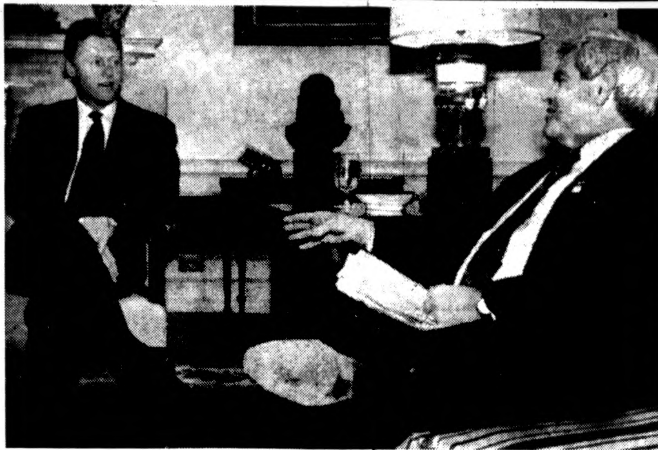
JAV Atstovų rūmų pirmininkas Newt Gingrich ir JAV prezidentas Bill Clinton antradienį Baltuosiuose rūmuose tarėsi kaip susiderinti dėl federalinio biudžeto, kad nebūtų deficito ir kad nenukentėtų švietimas bei pensininkų sveikatos priežiūros finansavimas. Jie sutarė, kad sekančią dieną Kongresas skirs reikiamas lėšas federalinių darbuotojų algoms apmokėti, tad laikinai paleistieji galės sugrįžti į darbą, ir kad iki Naujųjų metų susiderės ir dėl valstybinio biudžeto.

Lietuvos protesto notoje Latvijos vyriausybei taip pat buvo pareikšta, kad Lietuva atsisako