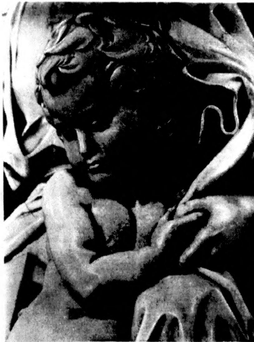
Kūdikėlis Jėzus Michelangelo Buonarroti (1475-1564)