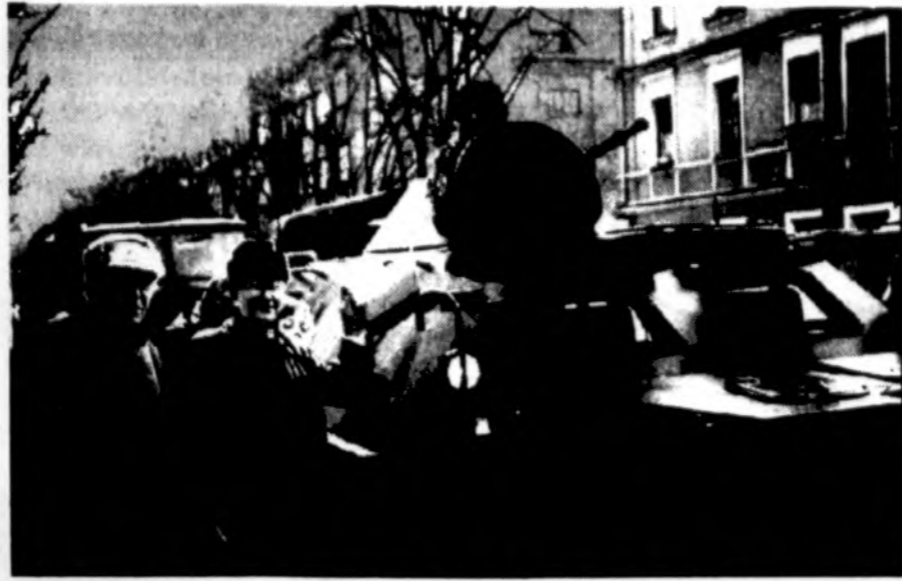
Kariuomenės šventėje Kaune važiuoja tanketė su lietuviška trispalve.

Sesijos metu, į pirmą eilę atsėdęs, su Krivių — krivių