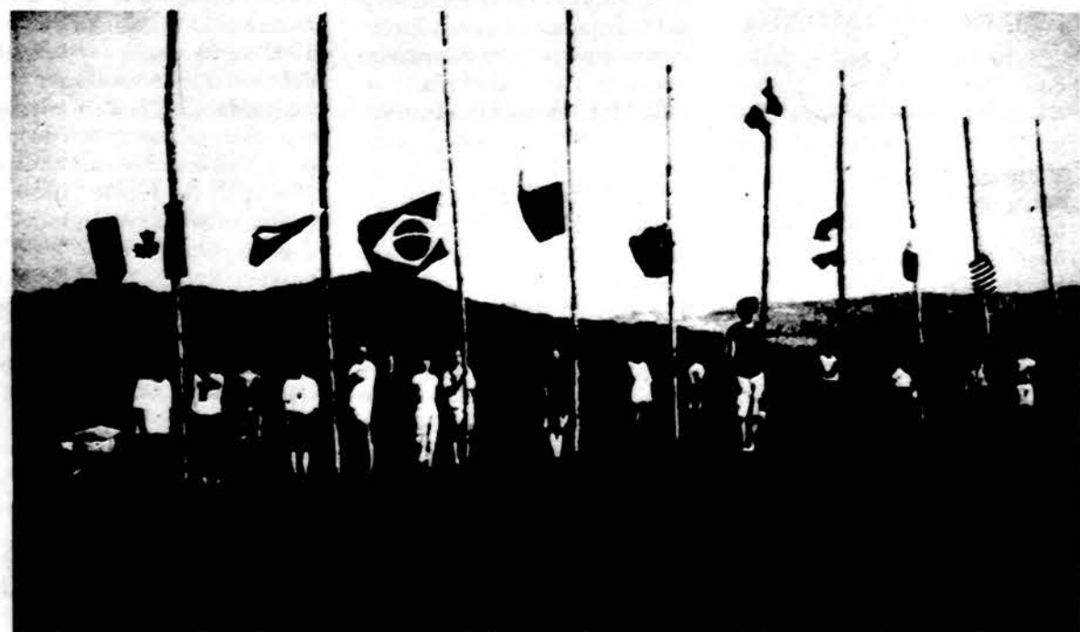
Valiavų pakilimas VI FLJS kongrese, Australijoje. Tada dalyvavo lietuvių jaunimas iš 14 pasaulio valstybių. Šimtiniam kongresui dalyviai atstovavo 18-ai pasaulio šalių lietuvių jaunimui.

Vytauto Navaičio vadovaujama agentūra rekordus registruoja nuo 1985-ųjų, nemažai Lietuvos rekordų įrašyta ir į pernai Rusijoje išleista elektroninė rekordų knyga „Divo“ kompaktiniame diske. Lietuvos rekordų knygos adresas „Internet“ tinkle – http://www.nerisena.lt/factum .