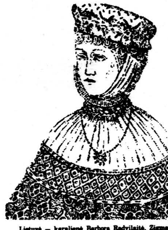
Lietuvė – karalienė Barbora Radvilaitė, Zigmanto Augusto žmona.

Šventųjų laikotarypyje trumpam nebus parduodamos žymiųjų pasaulio mokslininkų pasirašytas knygos apie mūsų kraują ir senąją lietuvių kalbą. Pervėlėme vokiečių, danų kalbininkus