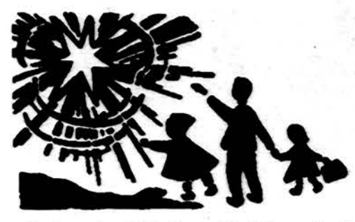
Redaguotojas J. Plačas. Medžiagą siųsti: 3206 W. 65th Place, Chicago, IL 60629

Po programos bus savanorių suvestos vaisės. Rengėjai prašo 3 dol. įėjimo aukos rengimo išlaidoms padengti; vaikams ir moksleiviams veitvi. Visi Clevelando ir apylinkių lietuviai kviečiami dalyvauti. Organizacijos prašomos dalyvauti su vėliavomis. Rengia ALT Clevelando skyrius ir LB Clevelando apylinkė.