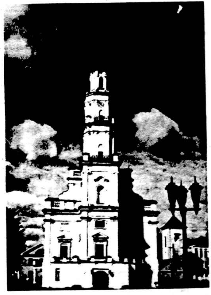
Kauno miesto rotušė – „Baltoji gulbė“ 1906 m. vaizdas.