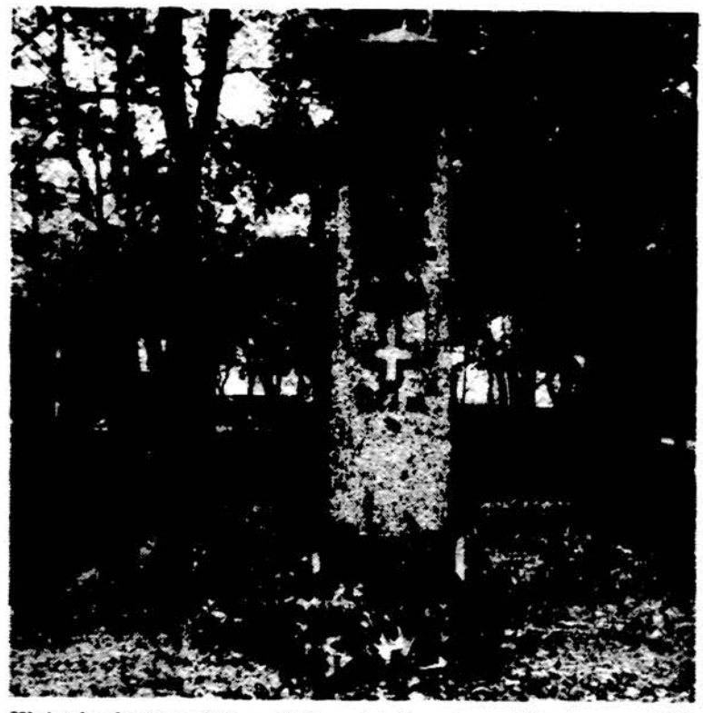
Klaipėdos krašto sukilime 1923 metais žuvusiems lietuviams paminklas Klaipėdos miesto skulptūrų parke.