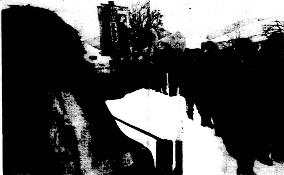
Groznas, sausio 28 d. (Reuter-BNS). Europos saugumo ir bendradarbiavimo organizacijos atstovai antradienį pareiškė, kad Čėčėnijoje vykę prezidento rinkimai buvo laisvi ir teisingi. Rinkimuose, kuriuose dalyvavo 12 kandidatų, pirminiais duomenimis, laimėjo generolas Aslan Maschadov, vadovavęs čėčėnų pajėgoms kare su Rusija. Maschadov antradienį kreipėsi į pasaulio valstybes, prašydamas pripažinti Čėčėnijos nepriklausomybę. Nuotr.: Vienas iš daugelio savanorių čėčėnų, padėjusių palaikyti tvarką sekmadienio rinkimuose.