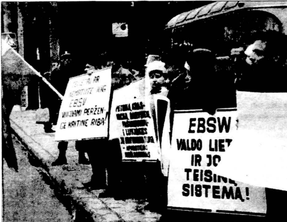
Balandžio 15 d. Vilniuje, prie Apeliacinio teismo, kuriame vyksta Kauno holdingo bendrovės bylos nagrinėjimas, indelininkai surengė protesto mitingą. Ši bendrovė iš žmonių surinko ir negrąžino daugiau kaip 80 milijonų litų.

Be to, pagal pradėtą svarstyti projektą, iš kandidato būtų nereikalaujama atsisakyti priesaikos ar pasidėjimo kitai valstybei, būtų leista rinkti prezidentu asmenis, kurie yra