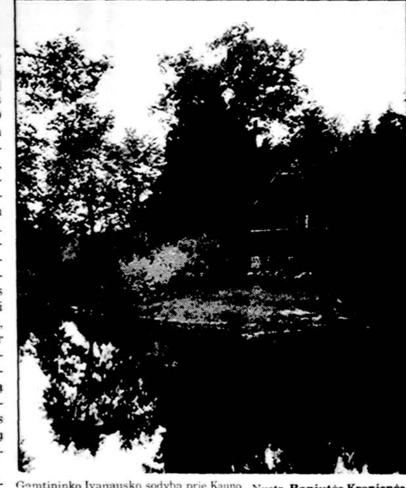
Gintinko Ivanausko sodyba prie Kauno.