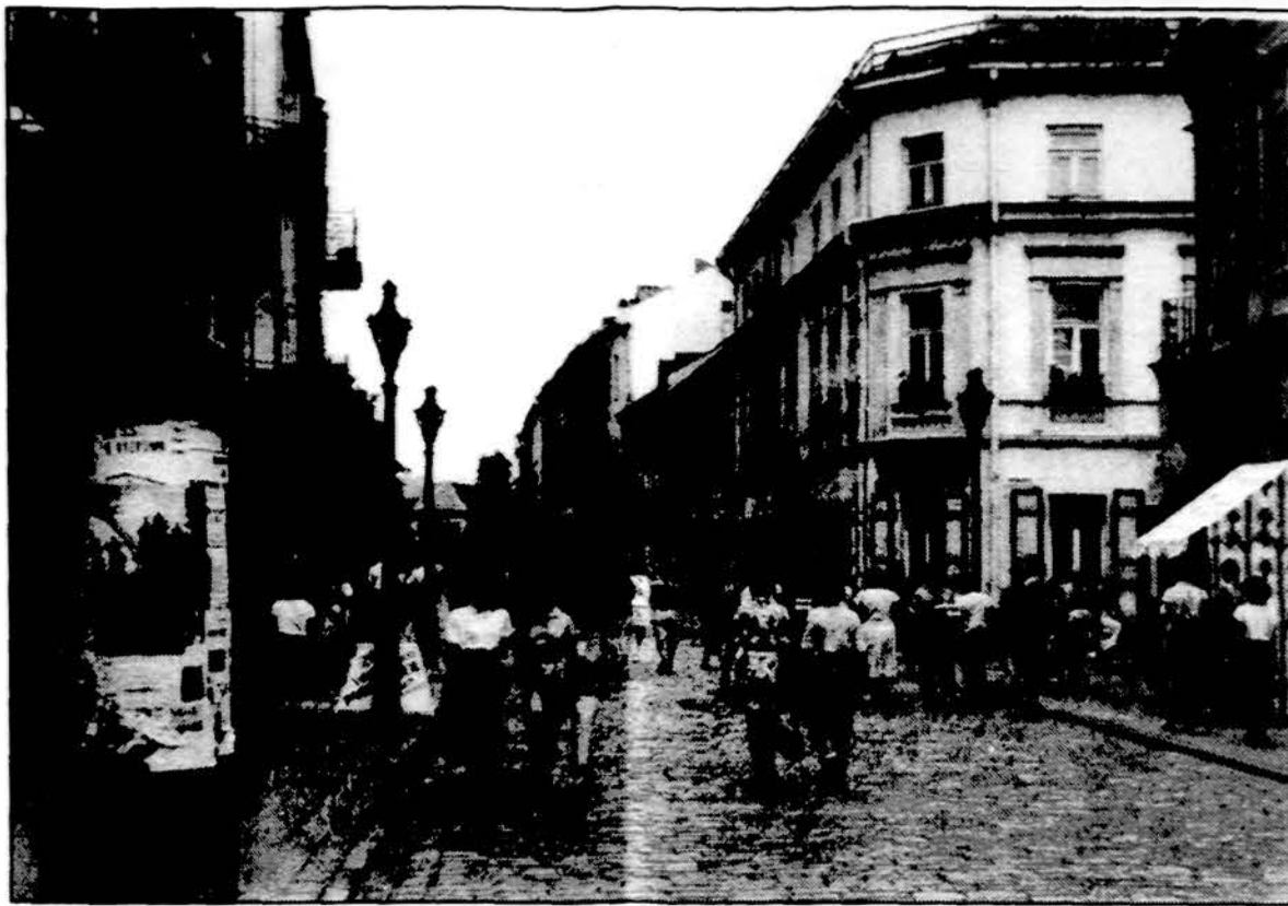
Vilniaus gatvė Kaune.

Lietuvos turgus iš rinkos sparciai stumia mėsos perdirbimo įmones. „Klaipėdos mais-