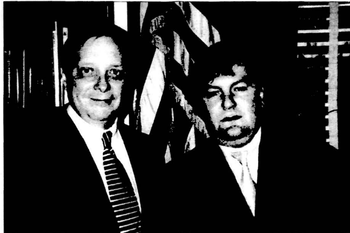
Gegužės 22 d. Washington, D. C., JAV senatorius Richard Durbin (D-IL) savo įstaigoje priėmė Lietuvos Seimo narį, Žmogaus teisių gynimo komiteto pirmininką, Lietuvos-JAV bendradarbiavimo grupės pirmininką Emanuelį Zingerį. Susitikimo metu pareigūnai pasidalino mintimis apie šiuo metu svarbiausią klausimą — JAV pagalba Lietuvai siekiant NATO narystės.

* Lietuvoje ir toliau yra mažiausias Baltijos valstybėse vidutinis darbo užmokestis bei mažiausia vidutinė senatvės pensija. Vidutinis atlyginimas Lietuvoje balandžio mėn. buvo 188 JAV dol. (751 litas), Latvijoje — 218, Estijoje — 229 dol. Vidutinė senatvės pensija Lie-