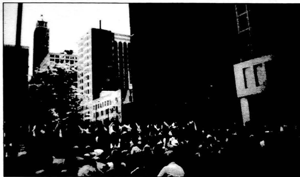
„Nemuno“ ansamblio šokėjai liepos 7 d. pasirodo Čikagos dangoraižių fone.