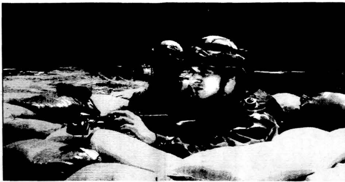
Lietuvos kariūnai, dalyvavę NATO rengtose karinėse pratybose Fort Polk, Louisiana, birželio-liepos mėn., kartu su kitų laisvųjų Europos tautų kariais.

Be abejo, bene svarbiausias sprendimas, laukiąs naujosios Tarybos, bus naujos JAV LB Valdybos, Garbės teismo ir Kontrolės komisijos rinkimai. Taryba čia galės rūpestingai