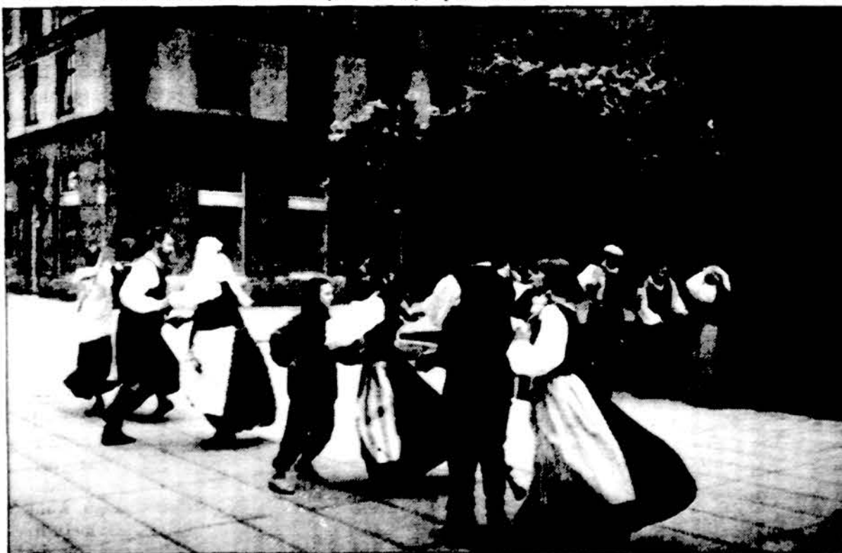
Tautinio ansamblio šokėjai Kaune, Laisvės alėjoje.

TRANSPAK, 4545 West 63rd St., Chicago, IL 60629 Telefonas: (773) 838-1050; Fax (773) 838-1055 Atstovybė Lietuvoje: Vilnius, 26-24-27, 26-28-27