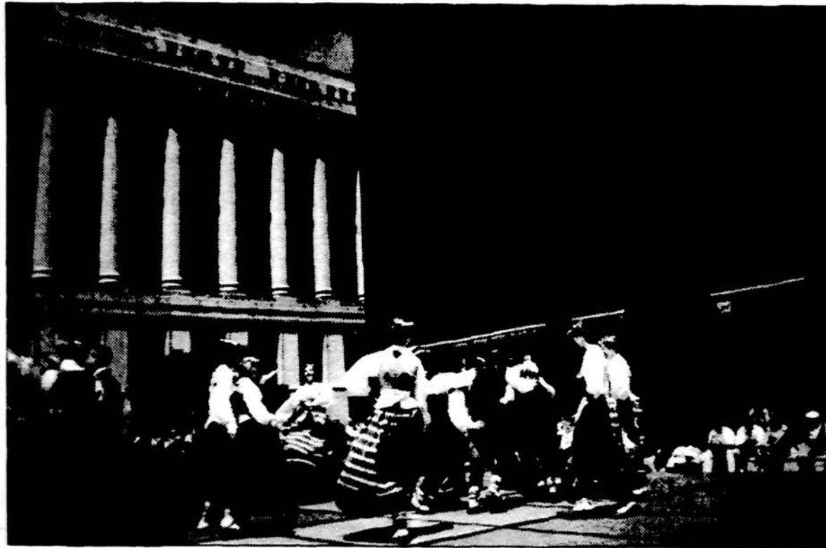
Kauno Technologijos universiteto ansamblio „Nemunas“ šokėjai prie Picasso skulptūros Čikagos miesto centre liepos 7 d.