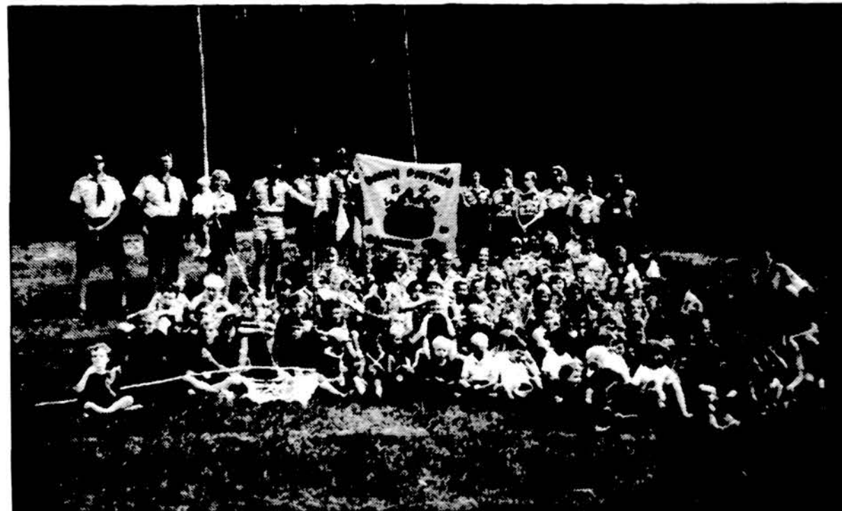
„Dainų pintines“ — Detroito ir Clevelando skautų ir skautų stovyklos stovyklautojai Dainavos stovyklavietėje.

(Naudotasi biografine medžiaga iš „Vilniaus balsas“, 1997 m. sausio 31 d.)