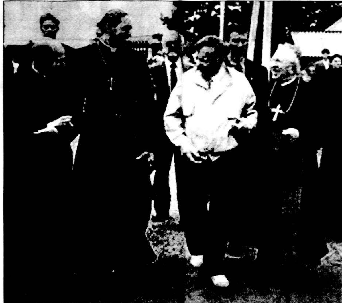
Siluva, rugšėjo 8 d. (Elta) — Sekmadienį, rugšėjo 7-ąją, Lietuvoje buvo surengta tradicinė maldininkų Pagerbimo, padėkos ir vilties eiseną Kelmė-Tytuvėnai-Siluva.