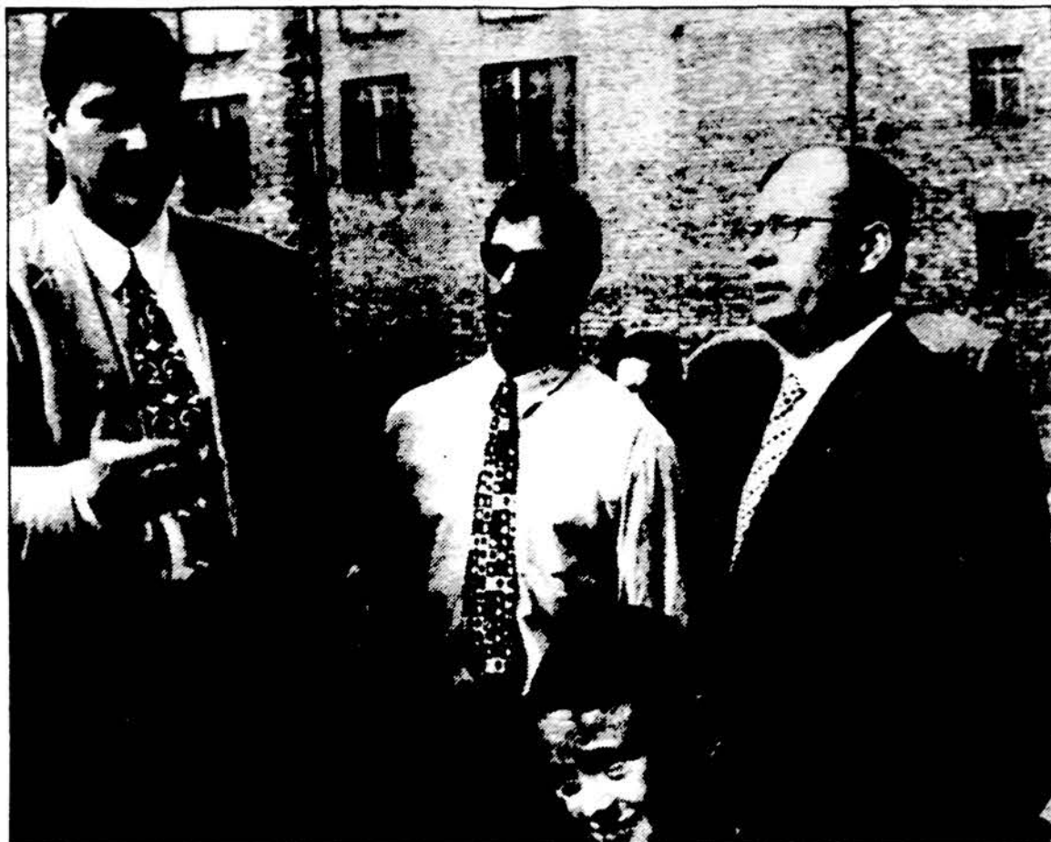
Rugsėjo 6 d. Kaune, Krepšinio sporto mokyklos kieme, pradėjo veikti aštuonios krepšinio aikštelės, kurias oficialiai atidarė Lietuvos ministras pirmininkas Gediminas Vagnorius, tuo pradėdamas Kaune akciją „Stabdyk nusikalstamumą“. Ideja užimti vaikus kilo krepšinininkui Šarūnui Marčiulioniu, kuris yra sunerimęs dėl Lietuvos plintančio narkotikų vartojimo. Prie šio reikalo pažadėjo prisidėti ir šiuo metu Amerikoje, Portlande, zaidžiantis krepšinininkas Arvydas Sabonis. Pasak G. Vagnoriaus, žodžiai iš žinomų krepšinininkų lupų skamba visai kitaip, jaunimas jais tiki, nes kol kas mokytojų, politikų ar valdininkų balsai jaunimo nepasiekia. Krepšinio aikštyno atidaryme (iš kairės) Arvydas Sabonis, Šarūnas Marčiulionis ir Gediminas Vagnorius.

* Užsienio bankams turėtų susidaryti palankesnės sąlygos steigti savo skyrius ar filialus Lietuvoje. Taip mano Seimo pirmininkas Vytautas Landsbergis, kurio pateiktas Komercinių bankų įstatymo pataisais vakar Seimas priėmė ypatingos skubos tvarka, rašo „Lietuvos rytas“ (09.12). Iki šiol skyrius arba filialus Lietuvoje galejo steigti bankai tiksliai tu valstybių, kurių bankų priežiūros institucijos yra pasirašiusios sutartis su Lietuvos banku. Vėliau paaiškėjo, kad ne visų valstybių įstatymai leidžia bankų priežiūros institucijoms pasirašyti tokias sutartis. Todėl dabar skiriami arba filialai bus