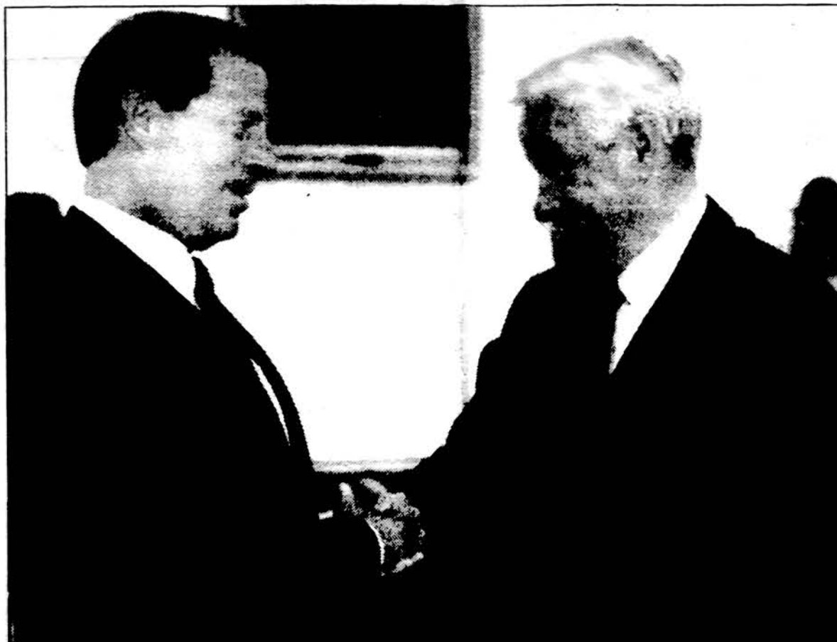
Maskva, rugsėjo 24 d. (AP-BNS). Antradienį JAV viceprezidentas Al Gore ir Rusijos prezidentas Boris Jelcin pasiekė seniai laukto susitarimo dėl trijų Rusijos branduolinio kuro gamyklų pertvarkymo civiliniams tikslams (ginkluotei skirtą plutonį gaminančios gamyklos ateityje gamins civilinėms atominėms elektrinėms tinkamą uraną). Šis susitarimas — tai dalis JAV pastangų užtikrinti saugų ir nuolatinių Rusijos branduolinių atsargų mažinimą. Ilgai trukusiame pokalbyje A. Gore ir B. Jelcin bandė sumažinti įtamą, kilusią dėl Rusijos pagalbos Iranui atominės elektrinės statyboje. JAV nerimauja, kad Rusijos teikiama technologijos gali būti panaudotos kuriant branduolinę bombą. JAV viceprezidentas dvi dienas vedė derybas su Rusijos premjeru Viktor Černomyrdin kosmonautikos, energetikos, ekologijos ir prekybos klausimais, tačiau pagrindinis dėmesys buvo skiriamas kovai su branduoliniu ginklu kūrime technologijų platinimu.

* Socialinės apsaugos ir darbo ministerijos duomenimis, 20 proc. Lietuvos gyventojų šį sezoną nepajėgė sukurti visų šildymo ir karšto vandens tiekimo išlaidų. Šiuos žmones turės paremti valstybė.