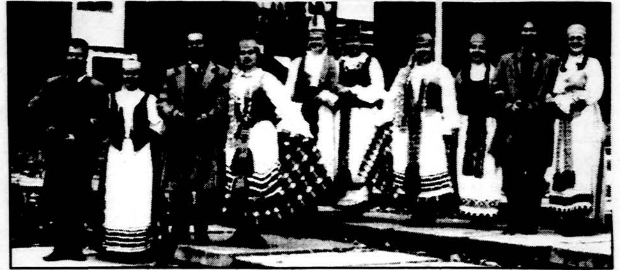
Šiaulių miesto ansamblis „Saulė“, kurio koncertas rengiamas spalio 14 d. Jaunimo centre.