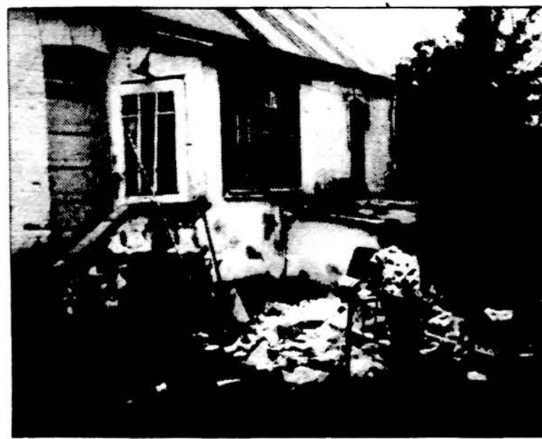
Tai tokioje bukleje šiuo metu yra Kražių parapijos klebonija.