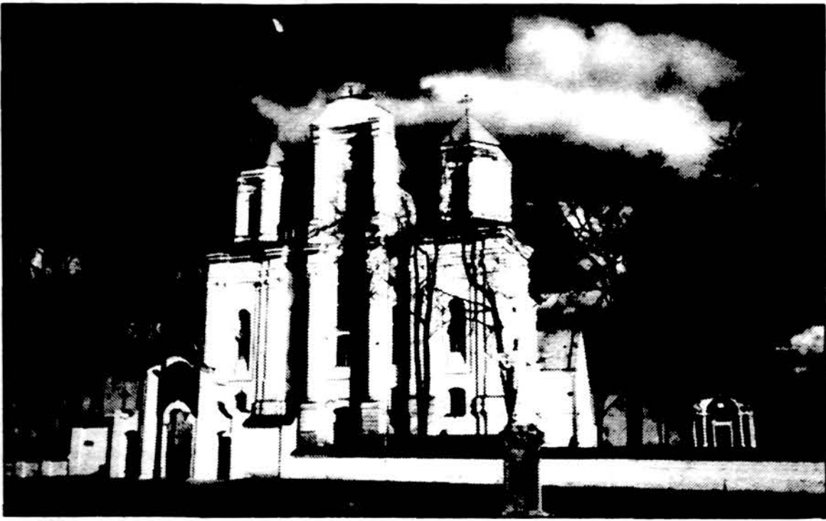
Istorinė Kražių bažnyčia, kurioje šiemet numatoma paminėti 100 metų Kražių skerdynių sukaktis.