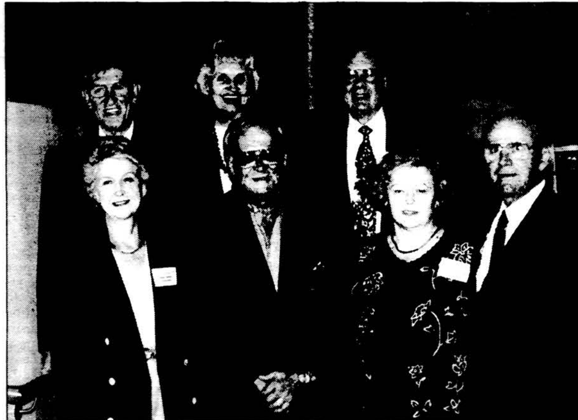
Rugsėjo 27-28 d. Philadelphiaje, Pennsylvania, vyko JAV Lietuvių bendruomenės XV Tarybos I sesija.