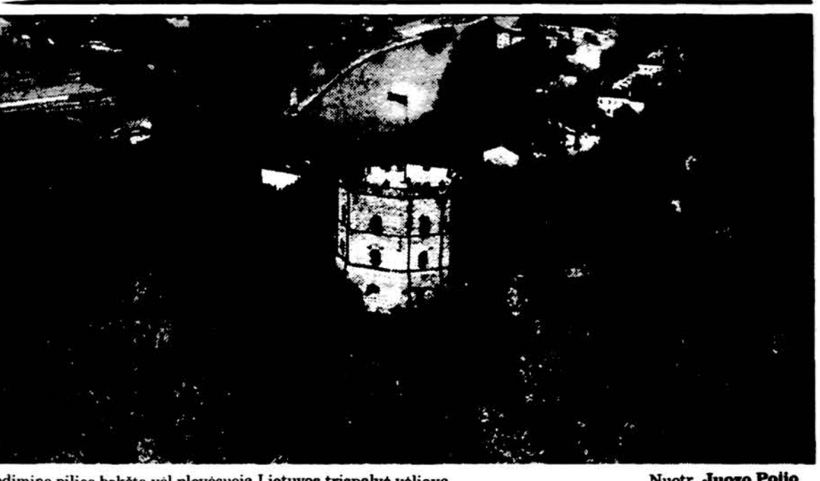
Gedimino pilies bokšte vel plėvėsuoja Lietuvos trispalvė vėliava.

Išleistas Lietuvių Mokytojų Sąjungos Chicago skyriaus