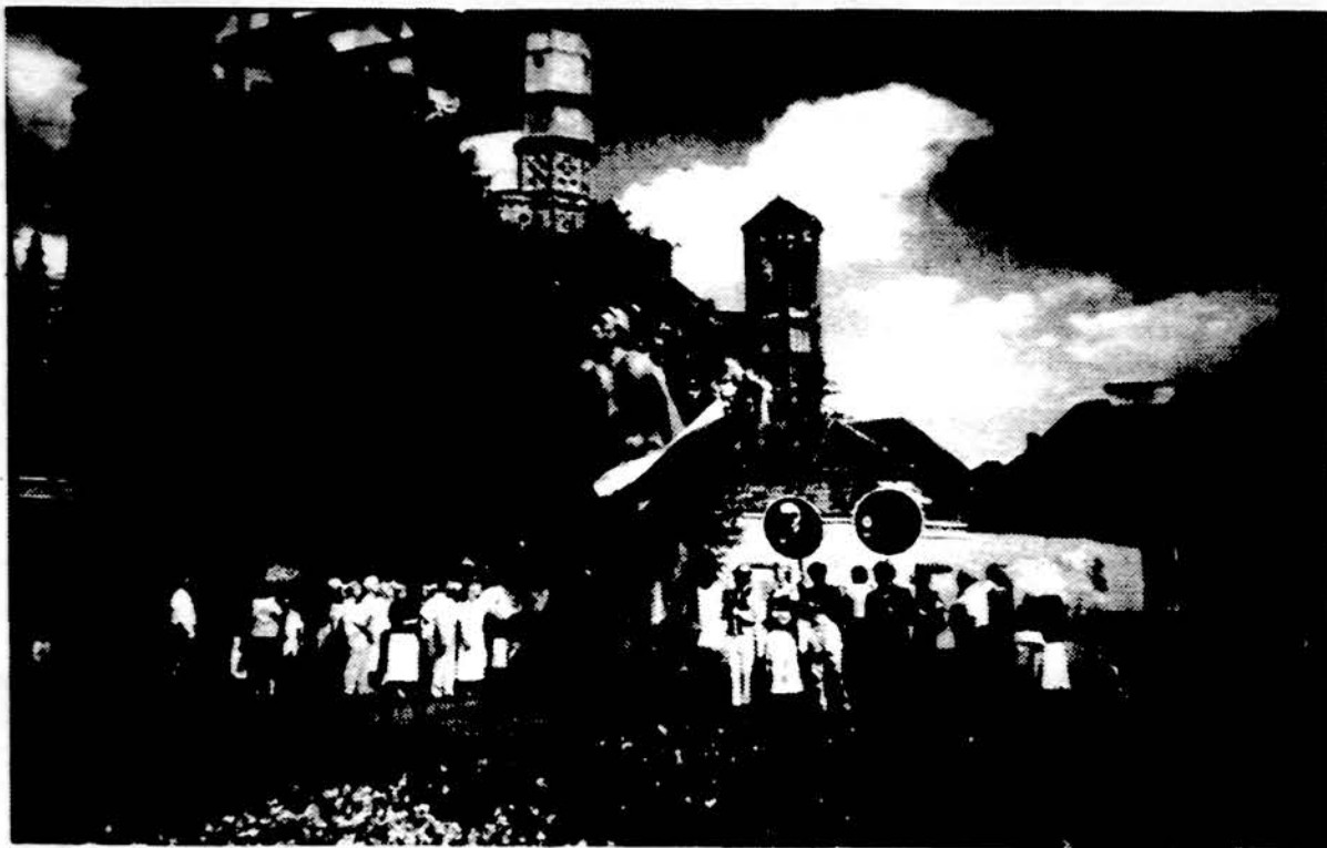
Vaidelis iš Juodojo kaspino dienos iškilnių prie A. Mickevičiaus paminklo Vilniuje.

Antra vertus, pernai vyku- siuose JAV prezidento rinki- muose teko girdėti tokios šmeižimo, juodinimo ir užuo- minų retorikos prieš pagrin- dinius kandidatus, kad Lietu- va vargiai sugebėtų pralenkti. Iki tokios „demokratijos“ (bent taip norime tikėti) mūsų tėvyne dar toli gražu. Viena, tiesa, aišku, Amerikoje, pa- skelbus balsavimo rezultatus, patys kiečiausi varžovai pa- davė vienas kitam rankas, pa- linkejo sėkmes ir pasidžėdė kooperuoti — savo visos tau- tos labui. To linkime ir Lietu- vai. O tuo tarpu skaičiuosime kandidatus ir lauksime lenk- tynių baigmės.