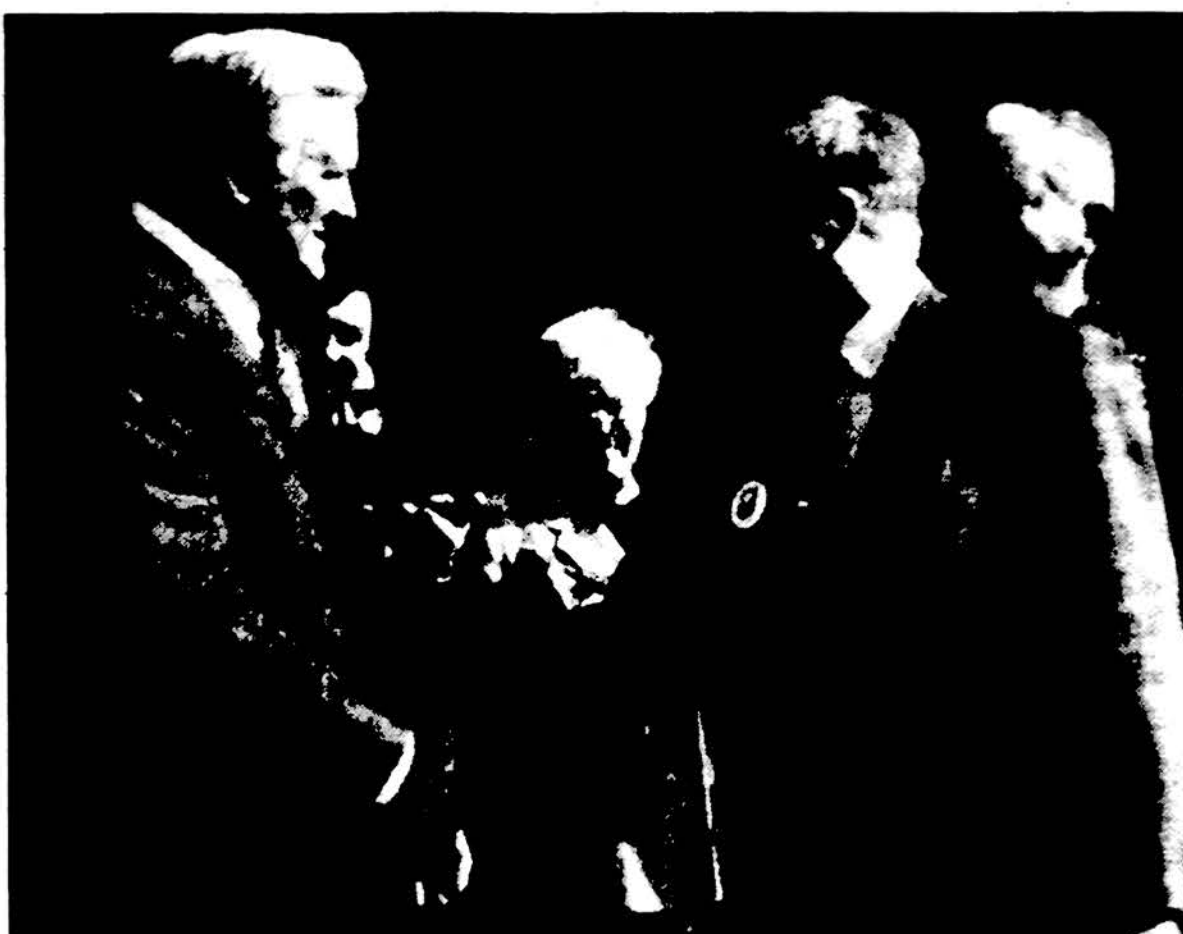
Spalio 6-osios vakarą buvo išgirstas ilgai lauktas vieno iš galimų kandidatų ir prezidentus gruodžio 21 d. įvyksiančiuose Lietuvos prezidento rinkimuose. „Mums reikia naujos kartos politikų prezidento“, pasakė dabartinis Lietuvos vadovas Algirdas Brazauskas, nusprendęs nedalyvauti rinkiminėje kovoje dėl prezidento posto sekančiais kadencijai.