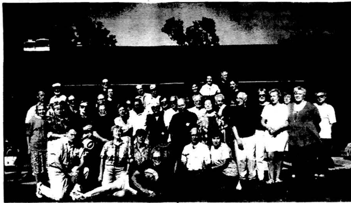
Buvę čiurlioniečiai, susirinkę į smagų vasaros pabaigos pobuvį, prisimena „Čiurlionis“ ansamblio laikus...

Atsiprašau dėl Jūsų patirtų nemalonumų ir tikiuosi, kad ministerijos bei „Lietuvos pašto“ pastangos bus pastebėtos ir pakankamos“.