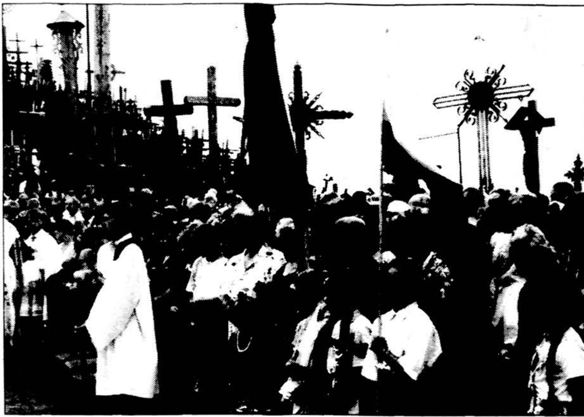
Šv. Mišios Kryžių kalne.

„Šiuo metu lėtinės obstrukcinės plaučių ligos (LOPL) užima ketvirtąją vietą tarp ligų, nuo kurių pasaulyje miršta daugiausia žmonių. 1996 metų statistikos duomenimis, LOPL diagnozuota