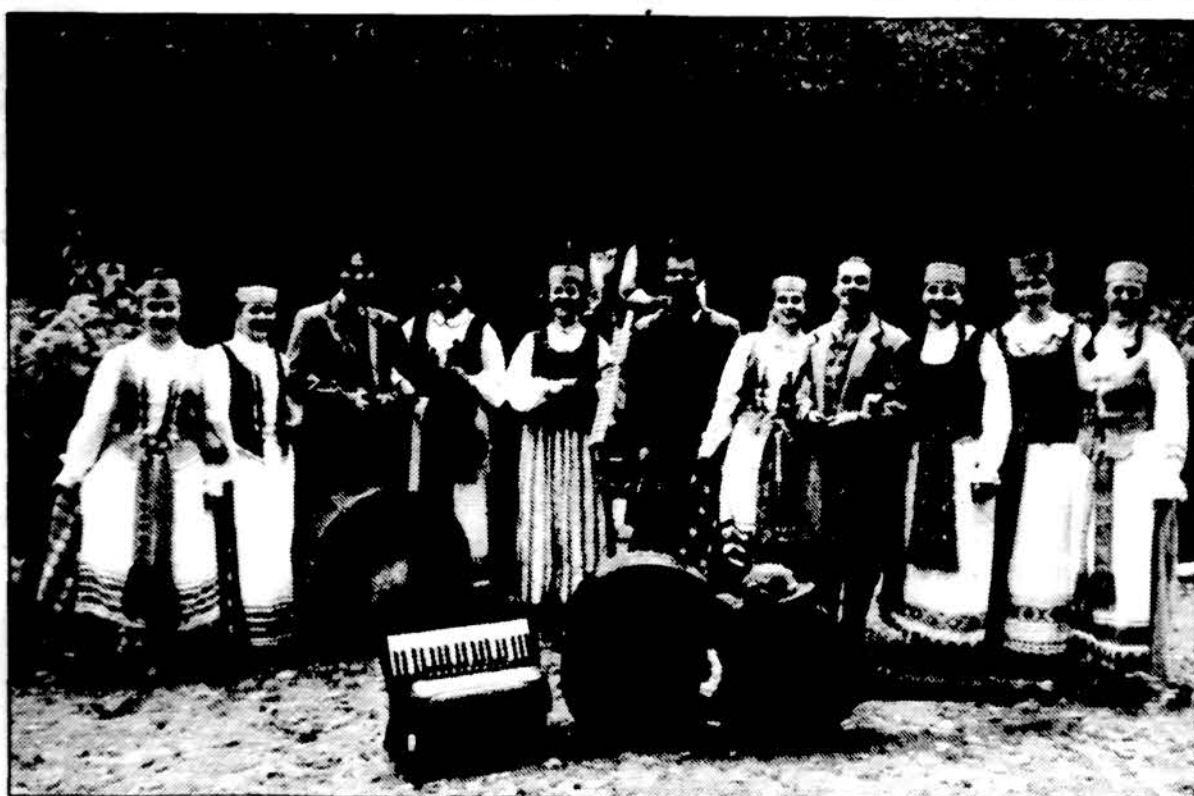
Etnografinio Šiaulių miesto ansamblio „Saule“ dalyviai. Jie pasirodys Čikagoje, Jaunimo centre, spalio 14 d., antradienį, 7 val. vak. Visi kviečiami atvykti.