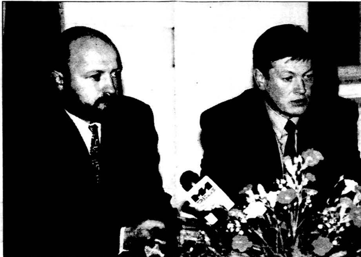
Spalio 8 d. kandidatas į Lietuvos prezidentus Artūras Paulauskas su Lietuvos liberalų sąjunga pasirašė bendradarbiavimo dokumentą. Trumpame susitarime nutarta suvienyti pastangas prezidento rinkimų kampanijoje, tartis dėl svarbiausių A. Paulausko rinkimų kampanijos nuostatų, organizavimo, rinkimų „komandos“ bei štabų sudarymo.

„Dvideiškiu ir tartiu-fiskumu“ jis pavadino „viešas