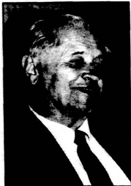
Dr. Zigmantas Zinkevičius