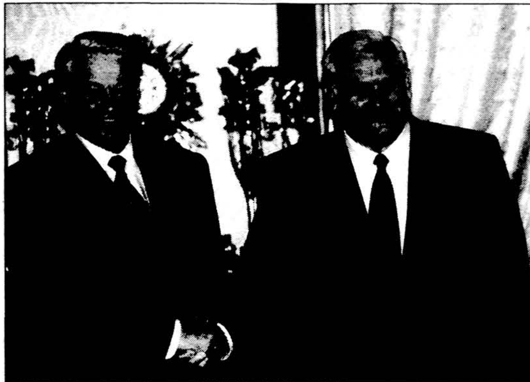
Moskva, spalio 24 d. — Rusija su pirmuoju oficialiu vizitu atvyko Lietuvos prezidentas Algirdas Brazauskas. Rusijos prezidentas (kairėje) Boris Jelcin Kremliuje priėmė A. Brazauską.

Tradiciniai mokymai „Baltic Challenge“ šiemet vyko Estijoje. Paldiski, pernai —