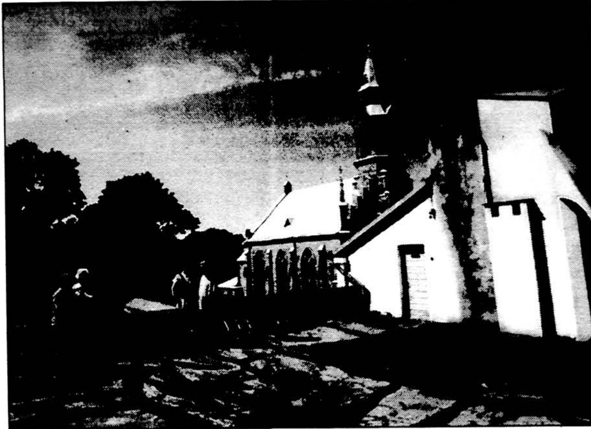
Kernavės bažnyčios gotika vasaros dangaus mėlynėn sminga...