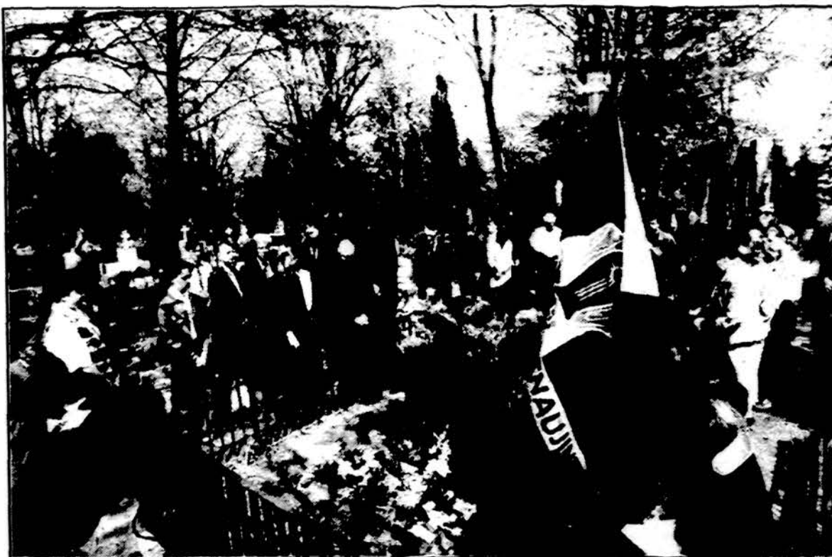
Prie prof. Stasio Šalkauskio kapo senosiose Šiaulių kapinėse.

Taip pat nustatyta, kad eili-niai tarnautojai tris kartus