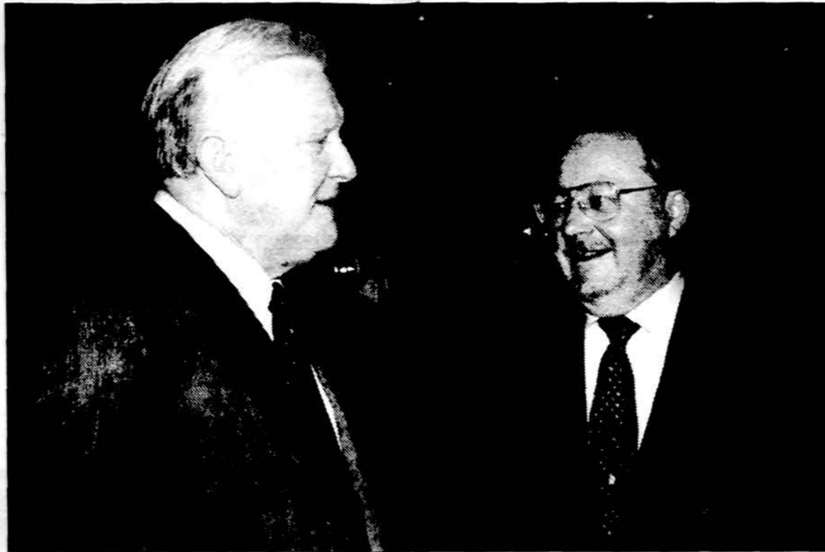
Vilnius, lapkričio 7 d. Netoli Vilniaus esančiame „Vilnia“ viešbutyje dvi dienas vyko Baltijos Asamblėjos viešųjų ryšių sesija, kurios dalyviams pasveikino Lietuvos prezidentas Algirdas Brazauskas (kairėje) ir Seimo pirmininkas Vytautas Landsbergis.