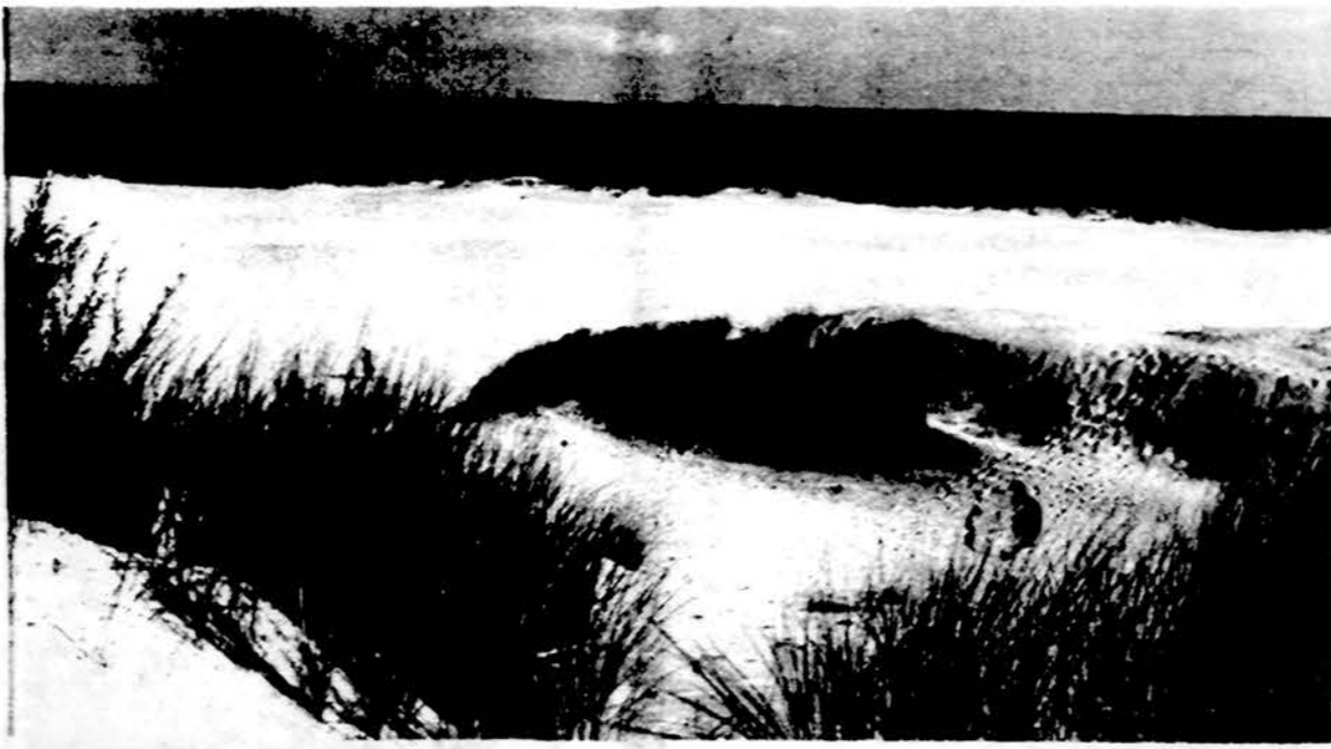
Lietuviško pajūrio idilija.