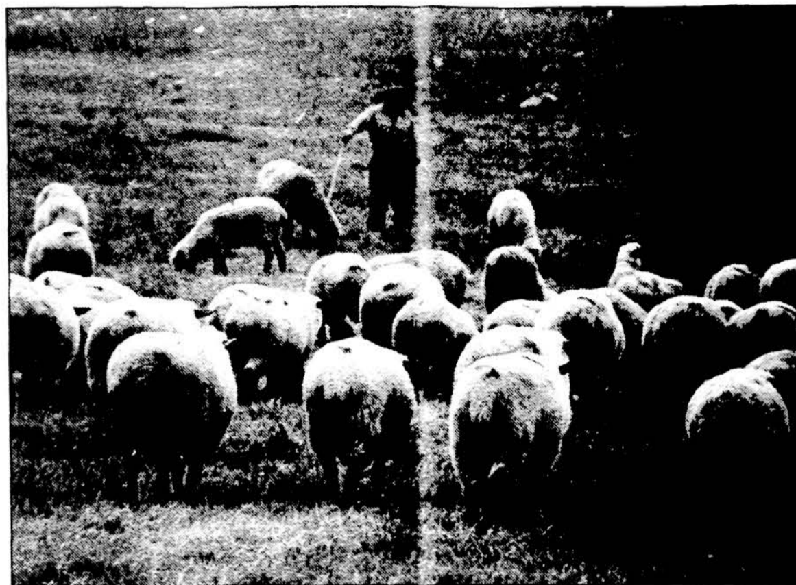
Iki vėlyvo rudens ūkininkų pievose ganėsi avys.

Lietuvių Katalikų Religinė Šalpa jau 36 metus atlieka kilnius šalpos darbus, teikdama reikalingą paramą Lietuvos Katalikų Bažnyčiai ir jos