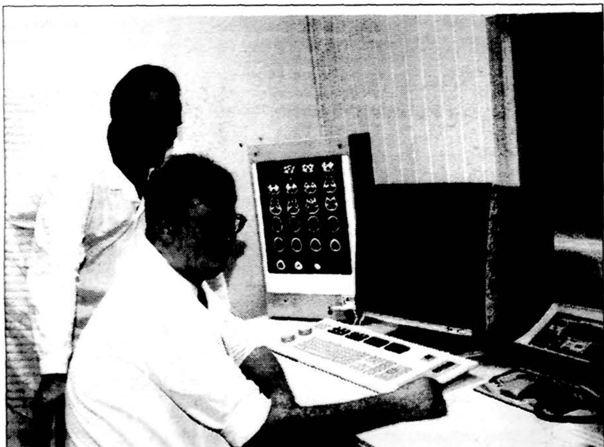
Kauno akademines klinikoje š.m. spalio 9 d. pradėjo veikti pirmasis Lietuvoje magnetinio rezonanso aparatas. Šiuo įrenginiu dažniausiai tiriamos galvos ir nugaros smegenys, stuburas ir sąnariai.

• 1917 m. rugpjūčio 18-23 d. Vilniuje įvyko pirmoji Lietuvių konferencija, kurios metu sudaryta Lietuvos Valstybės Taryba.