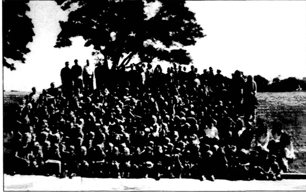
Maironio lit. mokyklos mokiniai prie Pasaulio lietuvių centro, Lemonte, šių mokslo metų pradžioje.

Dėl Rusijos ir Gudijos pasiūlymo prisijungti prie jų sąjungos. Ką atsakytų Lietuva — dar kartą „ne“? Atsakymas: „Ką reiškia — dar kartą? Jokių pasiūlymų kol kas nebuvo. Nors, manau, kažkokios naujos sąjungos nereikalingos. Europoje nemažai nedidelių valstybių. Ar jos blogai gyvena?“