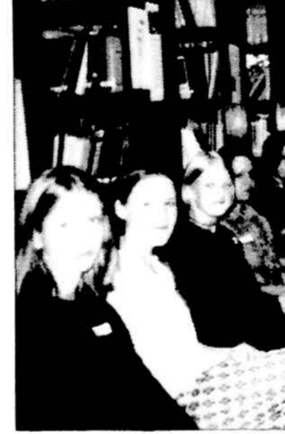
Štai koks gražus būrys studentų šiais mokslo metais lankys Pedagoginį lit. institutą Čikagos Jaunimo centre.