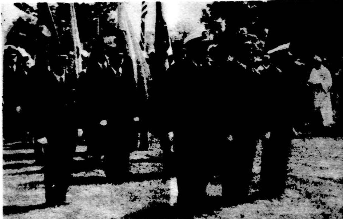
Lietuviai šauliai Čikagoje.