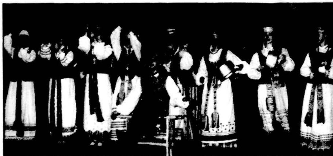
Geriams muzikantams ir puodai su keptuvėmis „groja“... Šaulių miesto etnografinis ansamblis „Saulė“ Jaunimo centro scenoje spalio 14 d.

Vilniuje, Fabijoniškų rajone, išnuomojamas 4 kambarių butas su baseinu, 5 aukštas, yra liftas. Skambinti: Vilniaus telefonu 011-370-2-75-62-31