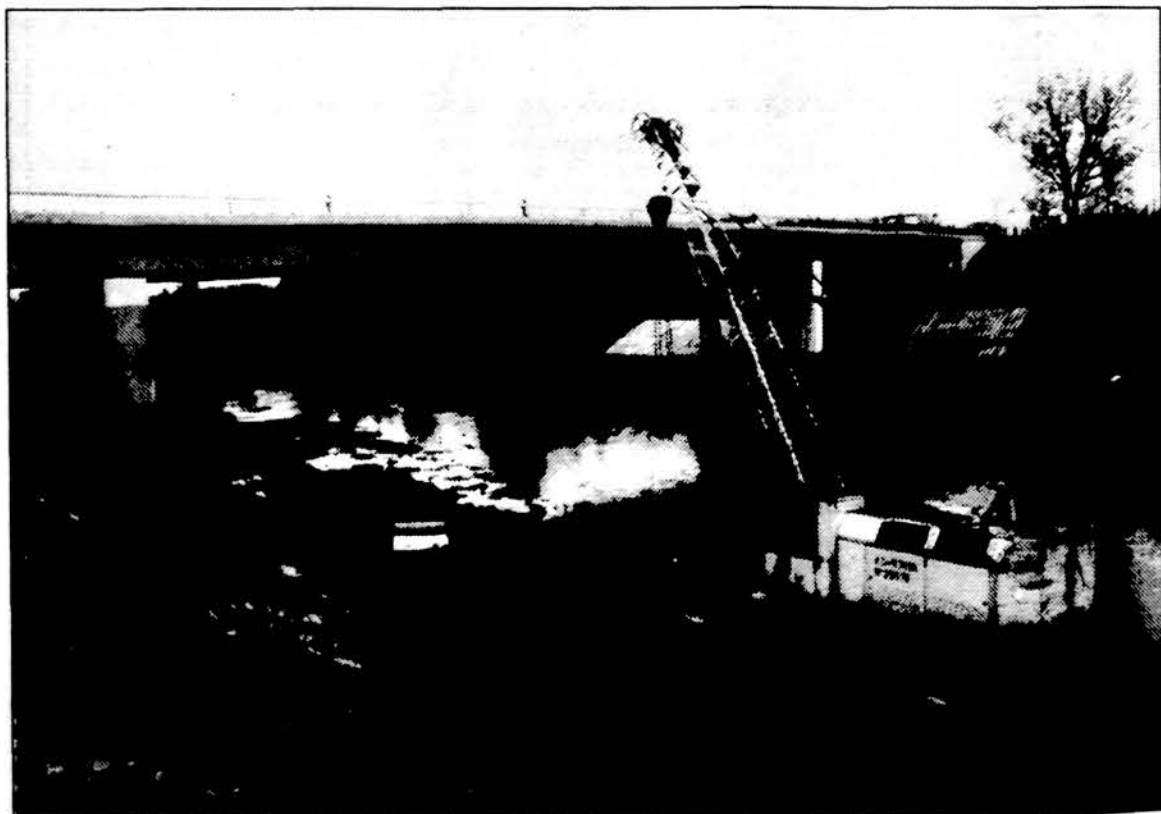
Vilniuje spalio 28 d. atidarytas naujasis Šilo tiltas per Nerį, jungiantis Žirmūnų ir Antakalnio mikrorajonus.