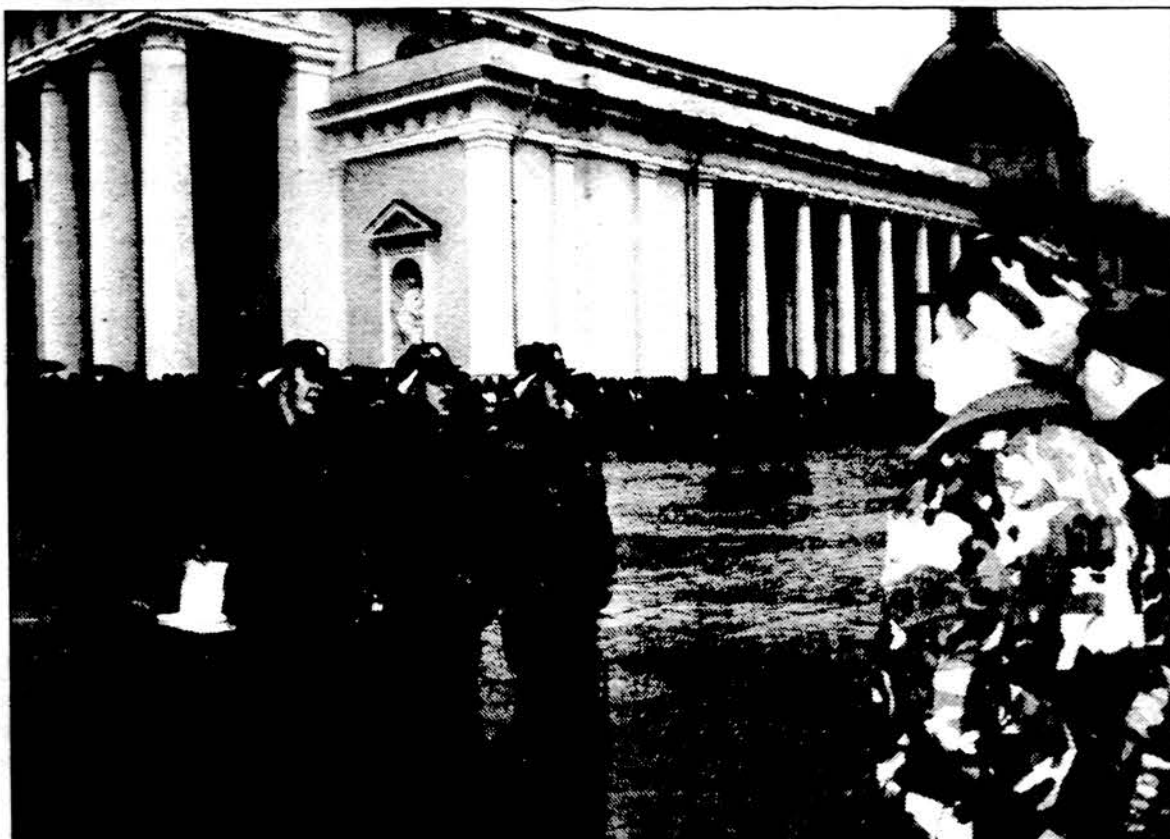
Prieš mėnesį paminėjęs penktąsias įkurimo metines, lapkričio 14-ąją Vidaus reikalų ministerijos antrasis pulkas Vilniuje, Katedros aikštėje, iškilmingos rikiuotes metu prisiekė tarnauti Tėvynei Lietuvai.

Kandidatai gali pasiimti dvių mėnesių apmokamas atostogas.