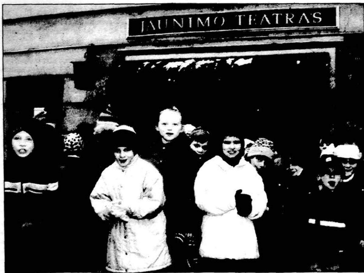
Vilniaus Jaunimo tetatras spalio 29 d. sostinėje surengė labdaros akciją Vaikų namų globotiniams, našlaičiams ir „gatvės“ vaikams. Jiems nemokamai buvo parodytas premjerinis spektaklis V. Haufo pasakos „Mažasis Mukas“ motyvais.

Laidotuvių direkt. Donald A.Petkus / Donald M.Petkus. Tel. 800-994-7600.