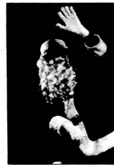
Tai jau „lietuviškas“ Kalėdų senis, apsilankęs Eltos agentūroje.