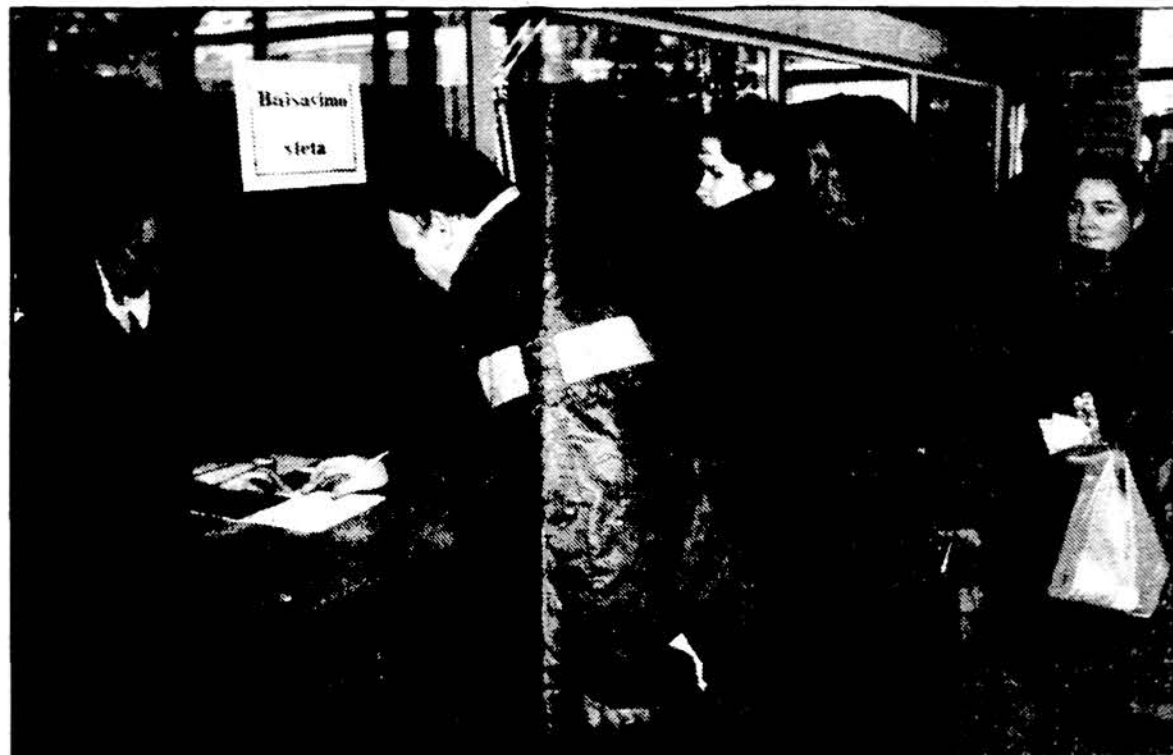
Vilniaus centre pašto balsuoja Lietuvos piliečiai, kurie netures galimybės gruodžio 21 d. balsuoti Lietuvos prezidento rinkimuose.