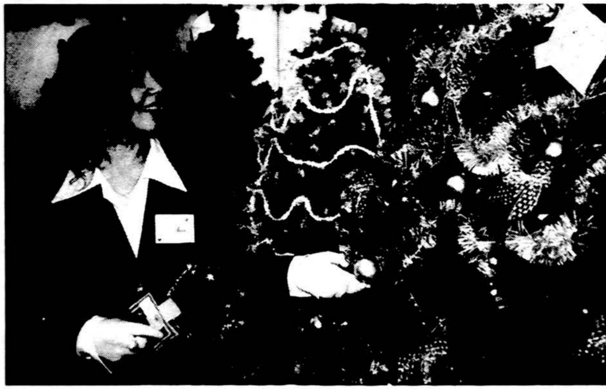
Dirbtinės kalėdinės eglutės Lietuvoje kainuoja iki 1.000 litų.