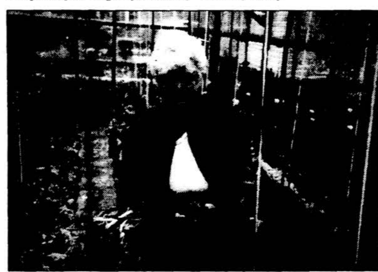
Darbšti lietuviė džiaugiasi savo daržo derliumi.

Galbūt, bėda gali būti tik, kad visi profesoriaus Lietuvos ir užsienio rėmėjai gali užmigtį ant sėkmingų dabartinių pradinių laurų ir per mažai stengtis dalyvauti rinkiminėje kovoje.