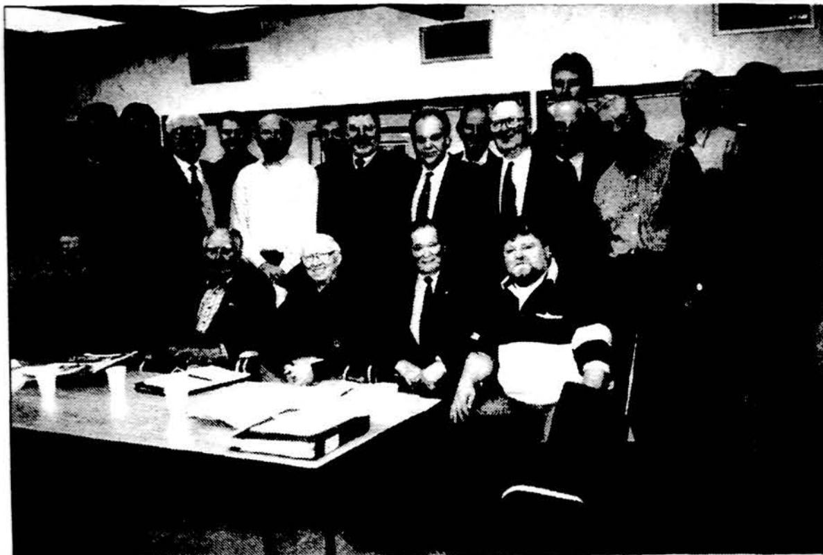
SALFASS-gos metinio atstovų suvažiavimo, 1997 m. lapkričio 22 d. vykusio Toronte, Kanadoje, dalyviai.