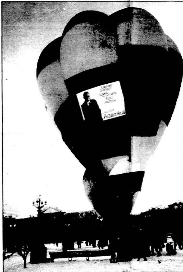
Vilnius, gruodžio 18 d. Valdo Adamkaus rinkimų štabas priešrinkiminę kampaniją užbaigė oro balionų švente. Renginyje „Oreiviai už Valdą Adamką“ dalyvavo penki oro balionų igulos. Paskraidinę vilniečius, balionai apskriejo sostinę. Ketvirtadienį šventė vyko Vilniuje, penktadienio vidurdienį — Kaune.

Jis priminė, kad A. Paulauską prezidentas pats pasiūlė atleisti iš generalinio prokuroro pareigų. „Per visą prezidentavimo laiką jį lydėjo nesėkmės pasirenkant savo įpėdinius“, pastebėjo A. Kubilius.