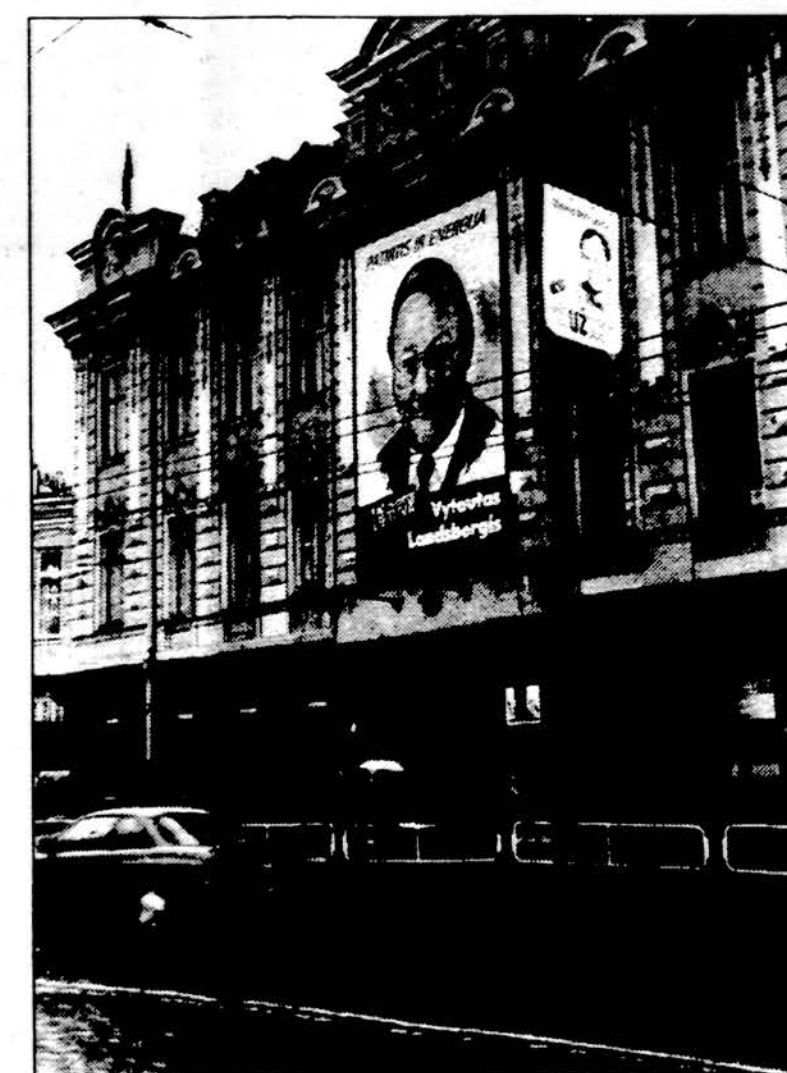
Rinkiminės kampanijos plakatas Vilniuje.