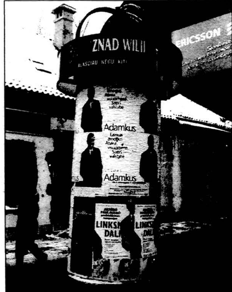
Rinkimaisiais plakatais apkabinėtas stulpas, raginantis balsuoti už Valda Adamkų. Linkime Lietuvos gyventojams tų raginimų paklausti.

Šiandien gautame gruodžio 9 d. „Draugo“ paskutiniame puslapyje radau bent keturis pranešimus apie Kūčias: šaulių rinktinė kviečia į „tradiciines lietuviškas Kūčias“ gruodžio 14 d.; studentai ateitininkai kviečia visus dalyvauti „Ateitininkų šeimos Kūčiose“ gruodžio 21 d.; Pasaulio lietuvių centro „bendros Kūčios“ bus gruodžio 21 d.; Vyresniųjų lietuvių centras ruošia „bendras Kūčias“ gruodžio 23 d. Panašių pranešimų buvo ir