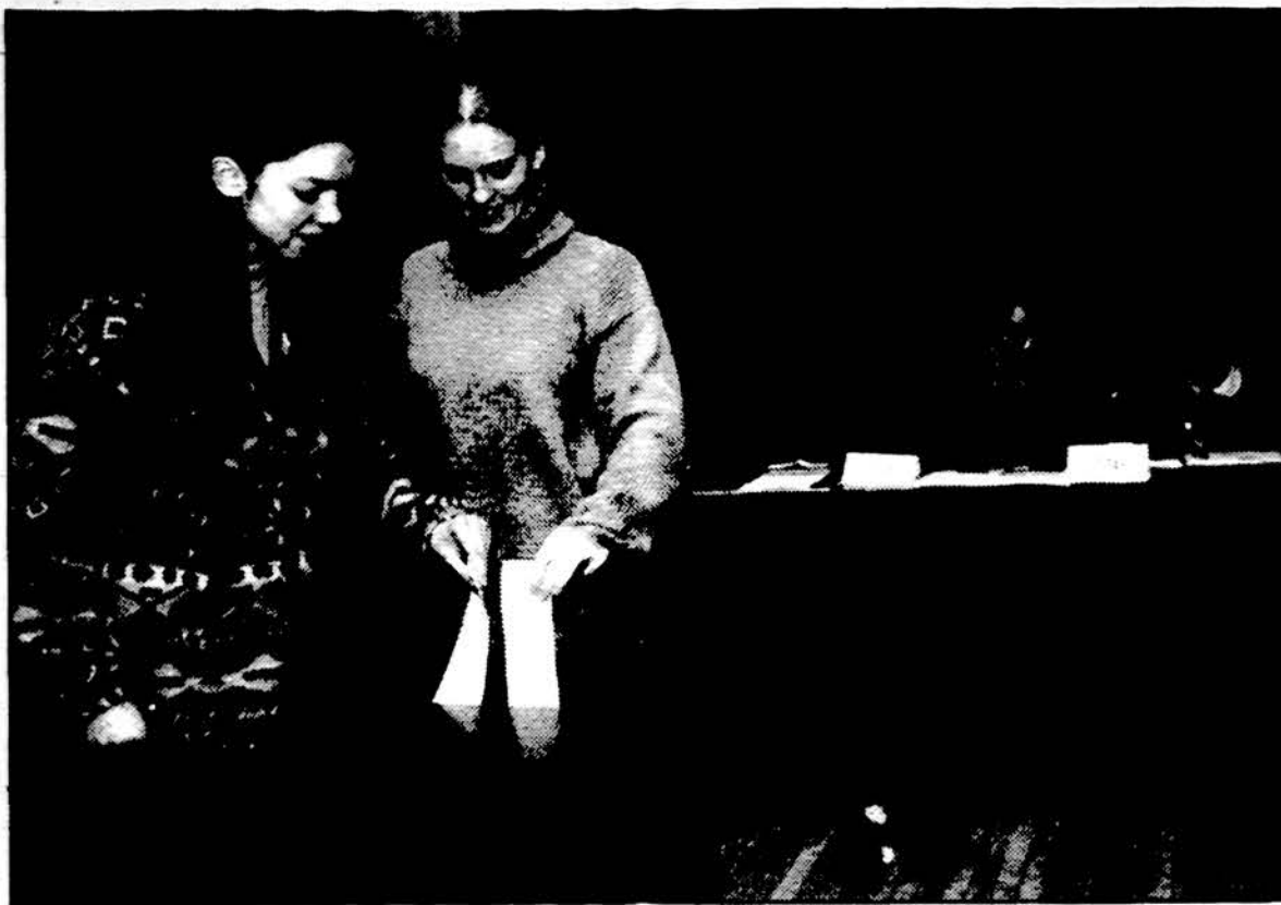
Devintosios vidurinės mokyklos 10 klasės moksleivės mokosi balsuoti prezidento rinkimuose. Gaila, kad visa Lietuva nebuvo išmokyta — ar nenorėjo išmokyti per kone 8 metų nepriklausomybę laikotarpį — atiduoti savo balsus už tikrai vertą kandidatą. Tikėkimės, kad tai įvyks antrajame balsavimo rate 1998 m. sausio 4 d.

Televizijos aparate dažnai įjungiu Prancūzijos stotis, kadangi jose duodama lengvo žanro muzika, operėčių ištraukos, operų arijos. Pranešant Europos oro apžvalgą, Lietuva parodoma su... Karaliaučiaus apygarda! Gal tai Prancūzijos meteorologų reiškiamas simpatija gintarų kraštui ir tai be užsienio reikalų min. žinios? Stebėtis reikia, kad Rusijos ambasada Paryžiuje iki šiol nepareikšusi jokio protesto. Be jokių abejonių, ambasados personalas stebi juk politines žinias.