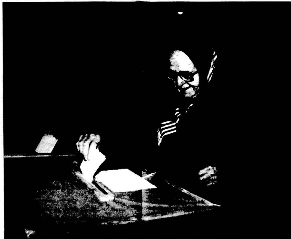
Ir jaunas ir senas — už naująjį Lietuvos prezidentą. Nuotr.: Vilniaus 205-oje rinkimų apylinkėje Fabijoniškėse.

Socdemai rinkimų rezultatais patenkinti ir patikėję savo įgėjomis. Jie dabar ketina telkti Lietuvos kairiųjų judėjimą.