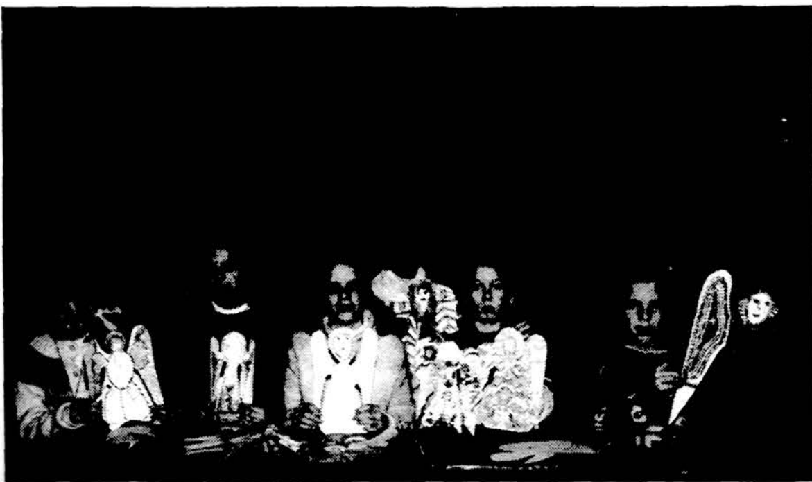
M.K. Čiurlionio muziejaus Kaune Vaikų dailės studijos nariai su savo pieštais angelais. Muziejuje atidaryta kalėdinė paroda „Skamba žemė angelių giesmė“, kurioje eksponuojamos 19-20 amžiaus angelių skulptūros bei Vaikų dailės studijos darbai.

Apie šią santaką kalbant, tenka pastebėti, kad jos jau nebera. Lenkupas panaikintas, jo vagą užtvėnkus pylimu ir tokiu būdu pastačius Lukšiams dirbtinį ežerėlį. Siesarties beveik išnyko, savo darbą pradėjęs tarybiniais melioratoriams. Tiems, kurie savo ankstyvoje jaunystėje turkštavosi Siesarties dūburiuose, ar