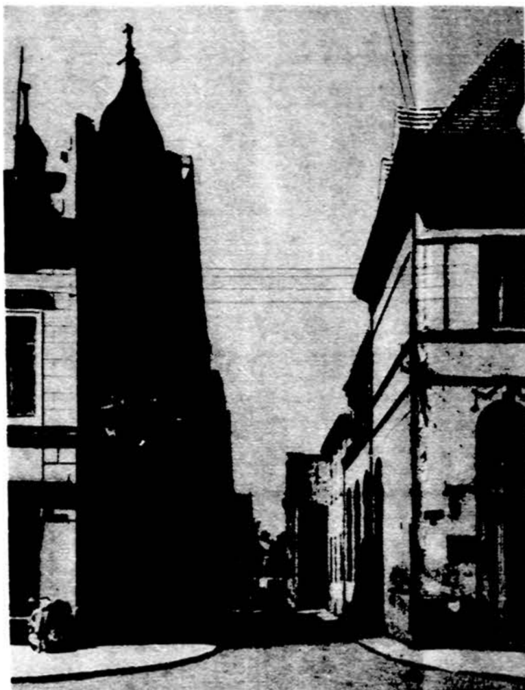
Klaipėdos senamiesčio gatvė.

Smulkiamis ūkininkams patariama duoti bent dviem šimtiems kitokio uždario ir pragyvenimo šaltinių: verslu, kaimo turizmo. Jau dabar nemažai žemės ūkio specialistų, kitų daugiau išsilavinusių ir veiklesnių kaimo žmonių pereina dirbti kaimo arba steigia savo verslo įmo-