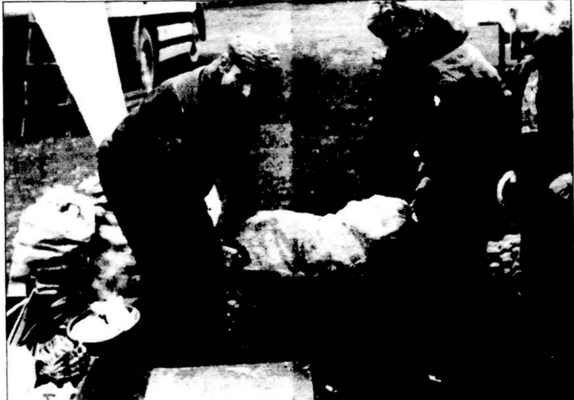
Po bulviakasio Lietuvoje.

Ūkininkus skatinant gerinti gyvulių bandas, atnaujinti jų veisles, jau anksčiau buvo perkami veisliniai galvijai iš Didžiosios Britanijos, Danijos bei Olandijos, o taip pat Vokietijos juodmargių veislių galvijai. Bet pasirodė, kad Lietuvos sąlygomis pieningiausias yra vokiečių juodmargių veisles karvės. Pernai iš jų buvo primelžta vidutiniškai po 4,003 kg riebus pieno. Tai keliais šimtais kilogramų daugiau, negu primelžta iš kitų