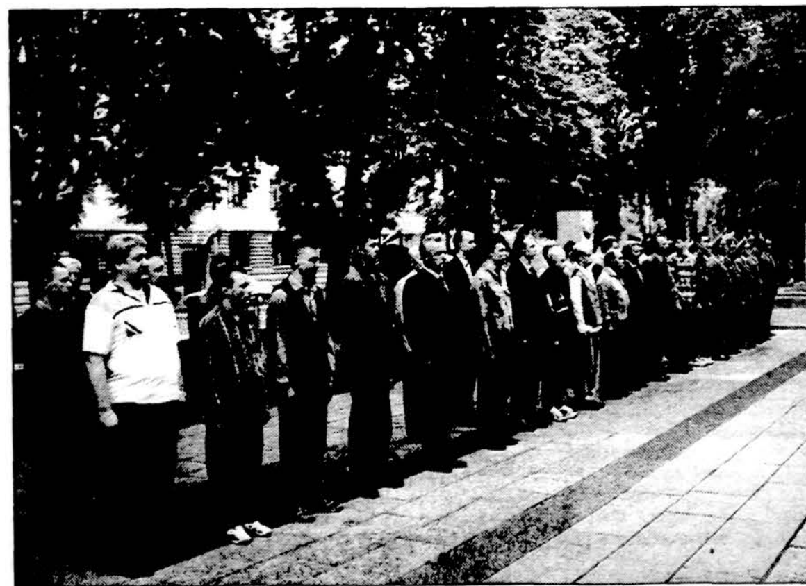
Naujieji Kauno Vytauto Didžiojo šaulių rinktinės nariai išrikuoti priesaikai.