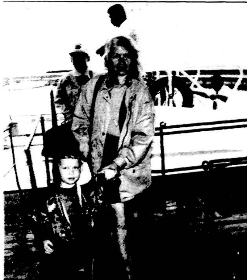
Keleiviniai, šią vasarą atplaukė „Raketa“ iš Kauno į Nidą.