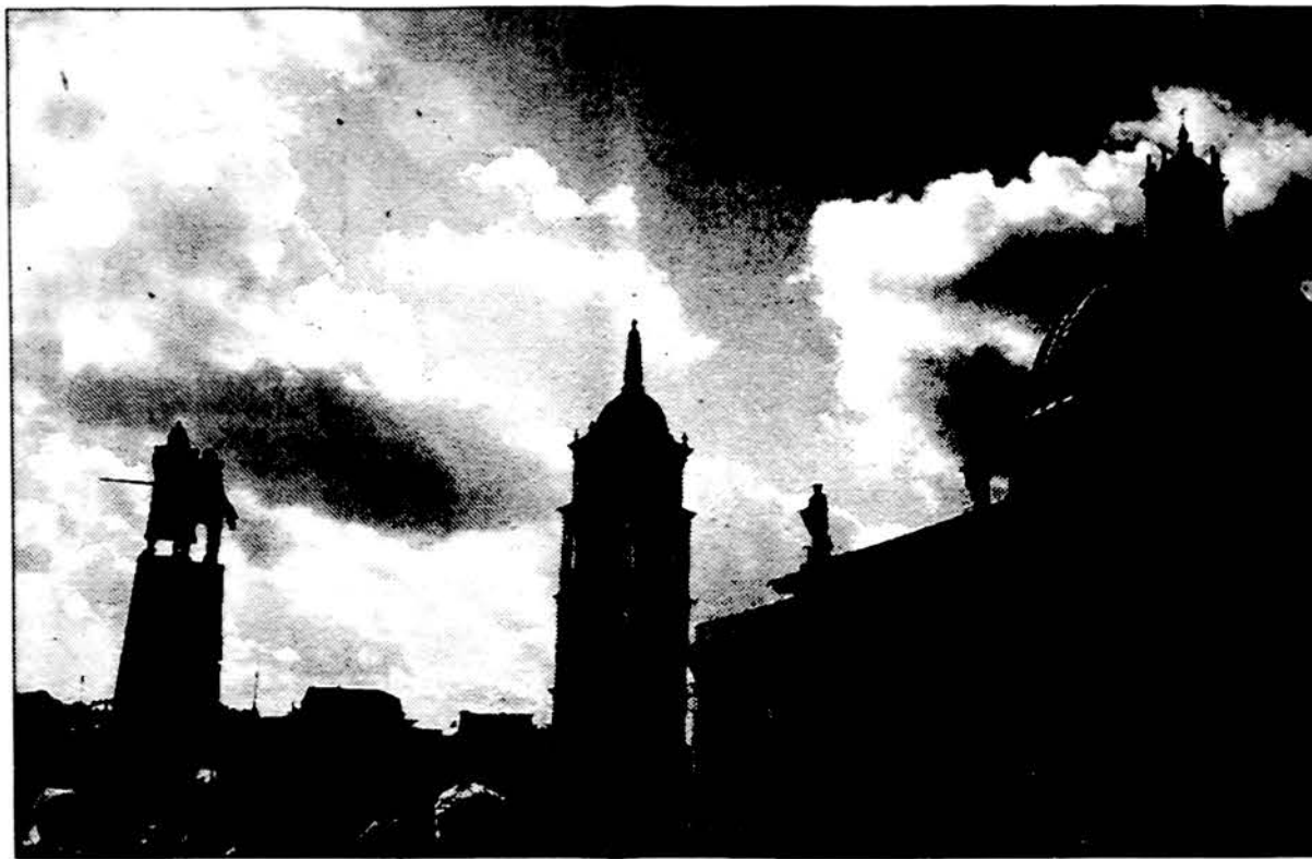
Vasarikiša tėvynės padangė virš Vilniaus katedros ir kunigaikščio Gedimino statulos.