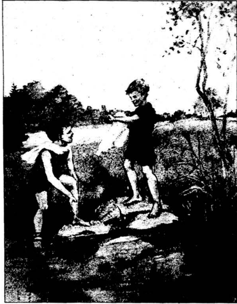
Vaikai prie upelio. Piešė dail. S. Valiuvienė

Redaguoja J. Plačas. Medžiagą siųsti: 3206 W. 65th Place, Chicago, IL