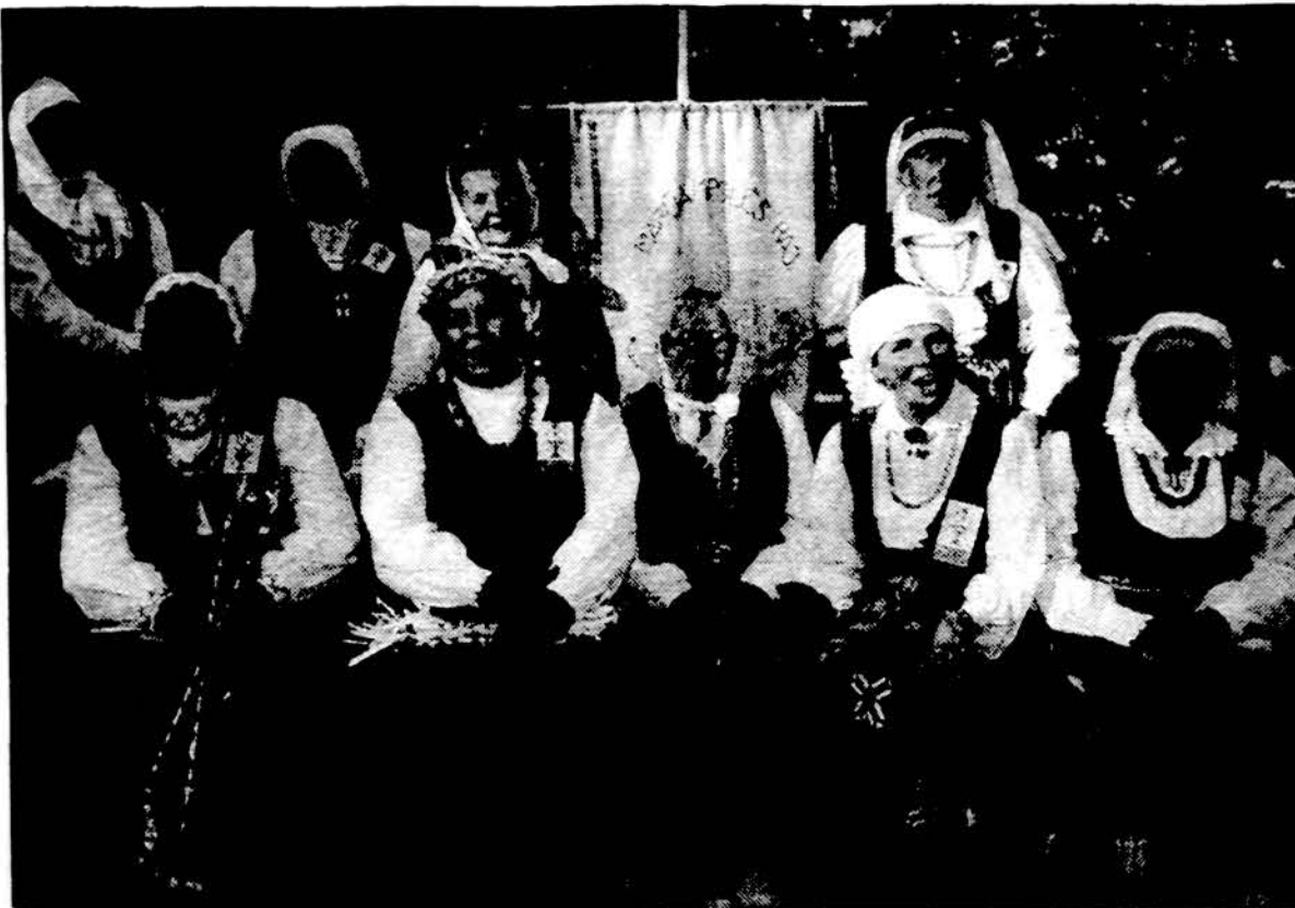
Etnografinis ansamblis iš Marijampolės rajono II pasaulio lietuvių dainų šventės folkloro dienoje „Uliokim, broliukai“ Sereikiškių parke, Vilniuje, liepos 7 d.

Pavojų taip pat sukeldavo sovietų barbarizmas. Jie mėgdavo besileidžiančius pilotus apakinti stipriais prožektoriais, trukdyti radio susiekimą, paleisti raketas, apšaudyti iš priešlėktuvinės, ir ore „palydėti“ pavojingais sparnais-prie sparno skridimais. Per visą oro tiltą vien amerikiečiai buvo užregistravę 733 sunkius trukdymus. Sovietų tikslas buvo bet koku būdu pilotus išstumti iš 20 mylių siaurumo oro koridoriaus. Mat tada galėtų teisėtai amerikiečių ir anglų lėktuvus nu-