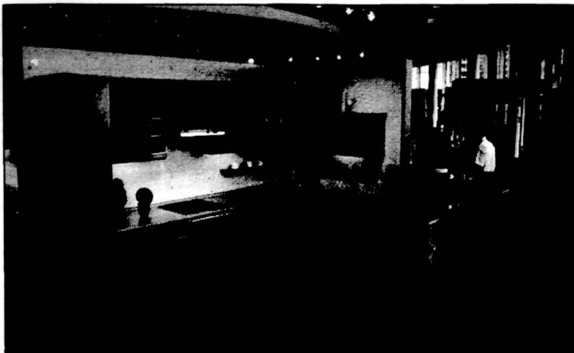
Gražūs virtuvės baldai, tik vargiai juos gali išsigyti eilinis Lietuvos gyventojas... Vilniuje liepos pradžioje atidarytas firmų „Vokė III“ ir „Kotryna“ prekybos centras.