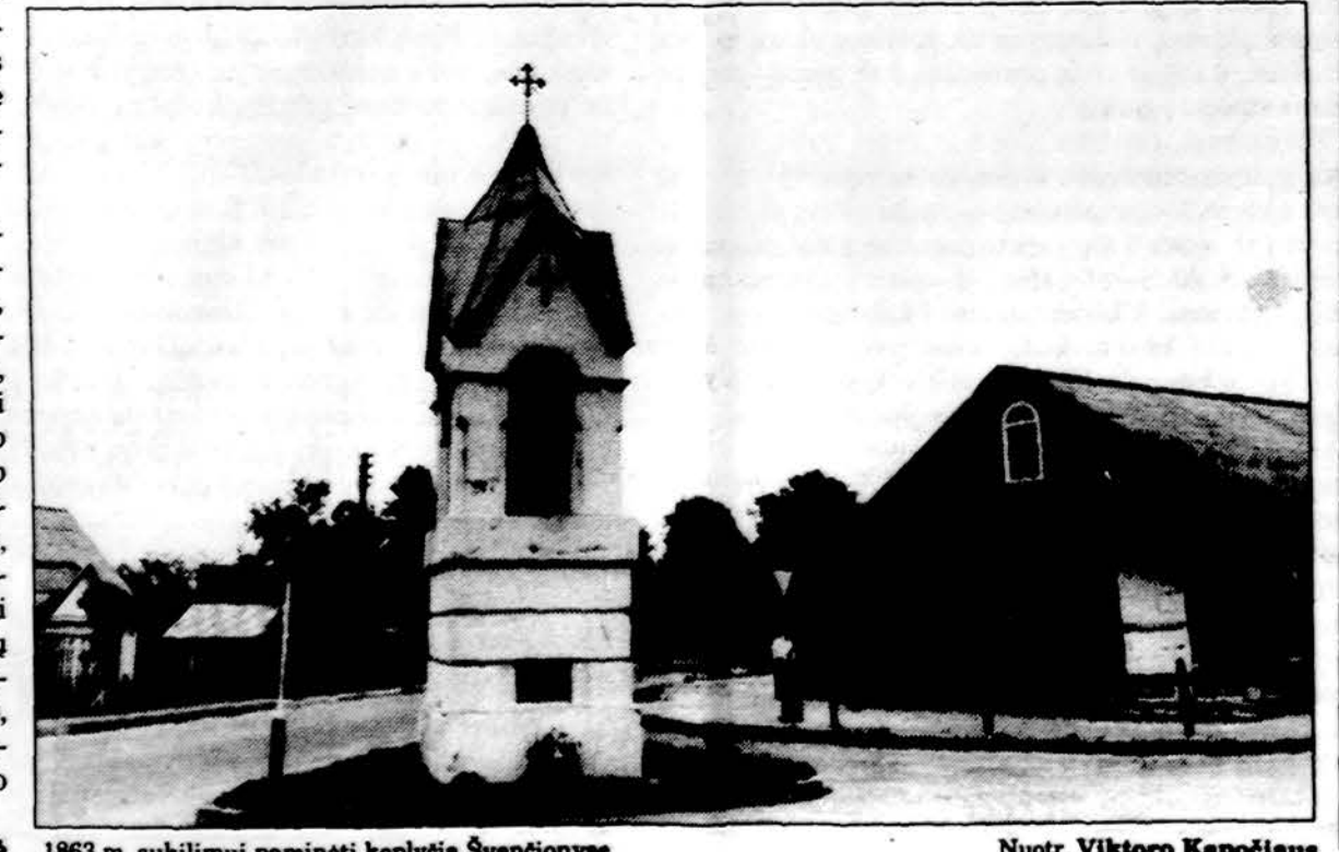
1863 m. sukilimui paminėti koplyčia Švenčionyse.

• Charakterio vertę suprasi iš to, kiek žmogus yra pasiryžęs aukotis savo idealams. Woerlmueller