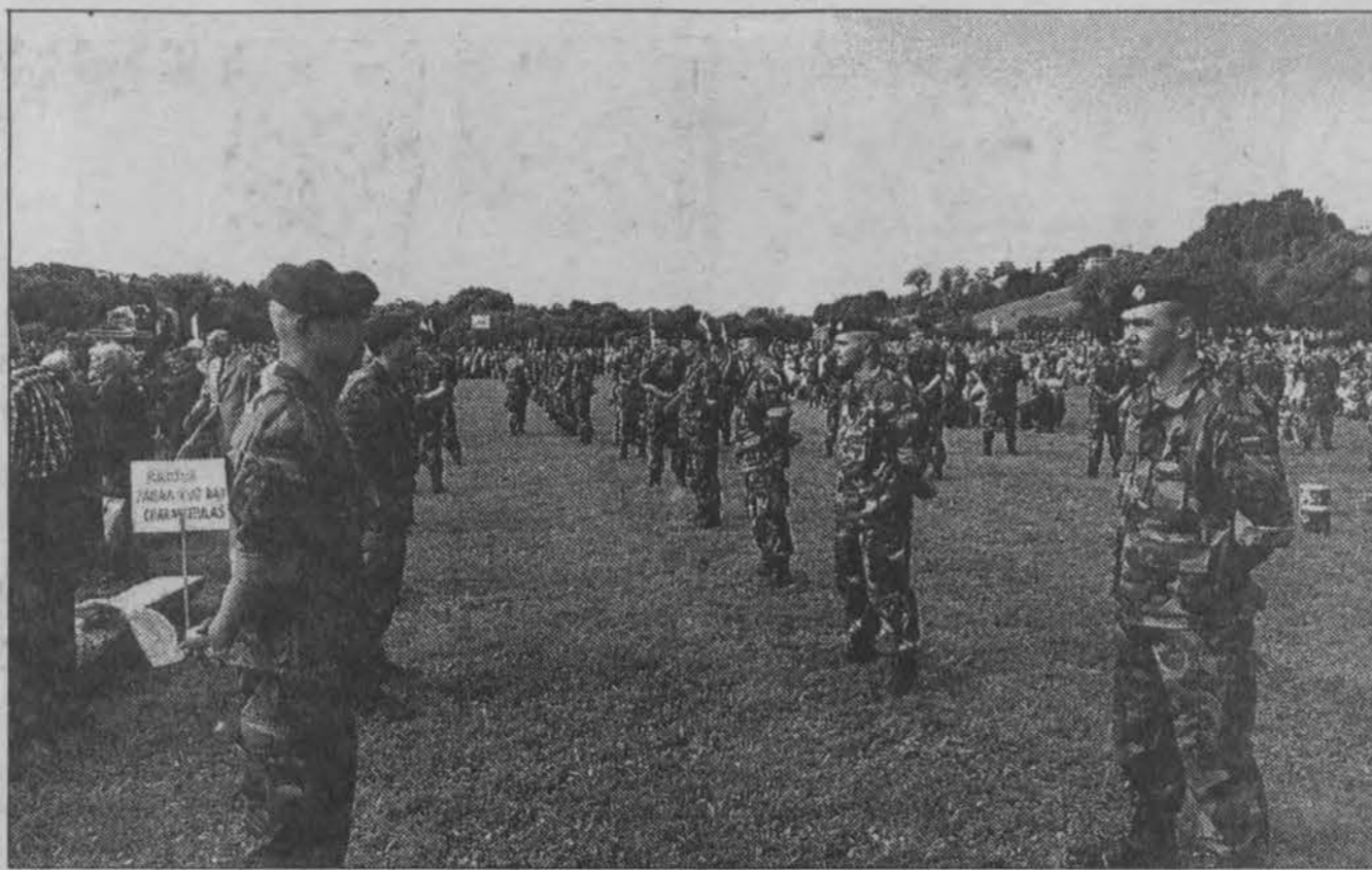
Jėgerių bataliono garbės sargyba Ariogaloje.

Maždaug po valandos mes priėjome prie gražaus Dubysos slėnio. Žiūriu pirmyn — šimtai dalyvių; žiūriu atgal — dar daugiau. Vieni jau aikštėje,