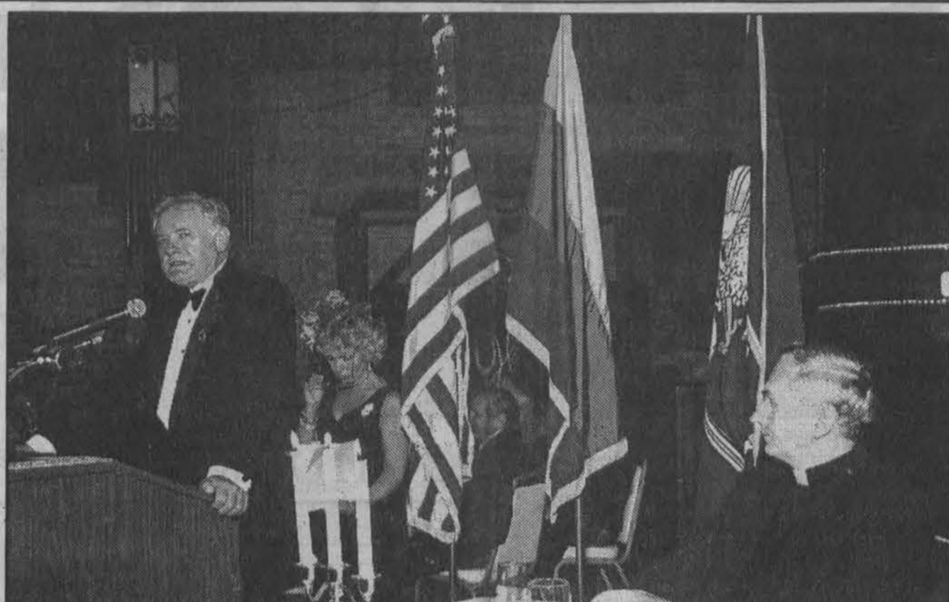
Spalio 18 dieną Lietuvos prezidentas Valdas Adamkus dalyvavo jo garbei Čikagos priemiestyje, „Willowbrook Ballroom“ restorane, surengtoje iškilmingoje vakarieneje, į kurią atvyko per 500 svečių.

Jis piktinosi, kad konservatoriai taip pat neišpildė ir kitų rinkimų pažadų: neprivatizuo-