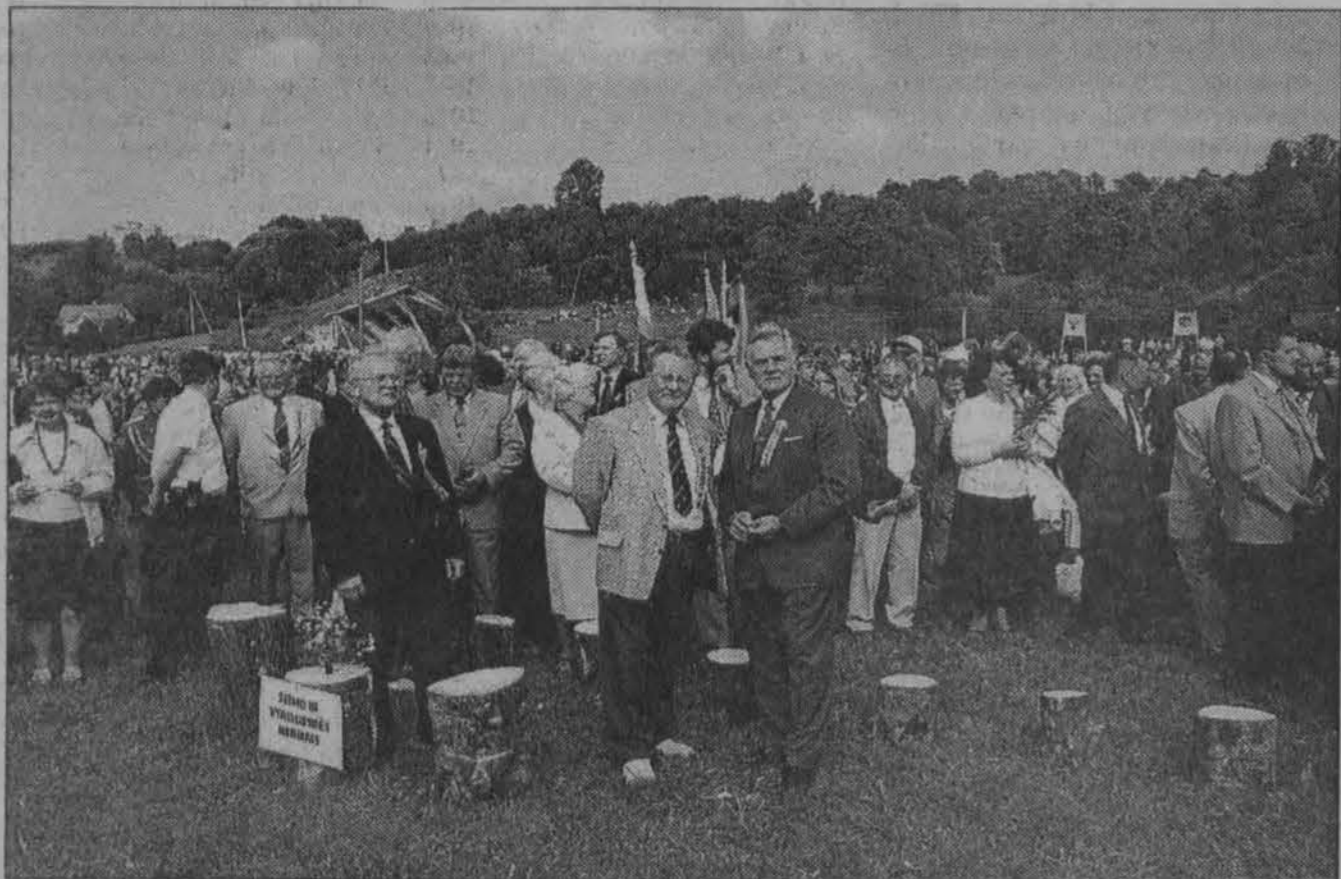
Susitikimas Dubysos slėnyje... LR Seimo pirm. Vytautas Landsbergis ir prez. Valdas Adamkus (viduryje).