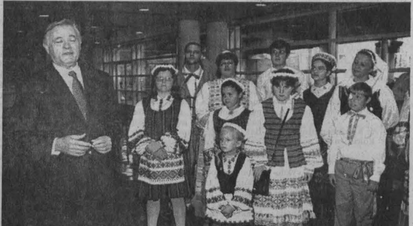
Tautiniais drabužiais pasipuošę lietuviukai, atvykę į O'Hare oro uostą, pasitikti Lietuvos prezidento, klausosi jo kalbos.

„iš kitur“? Ji taip gražiai atsakė: „Esu kokias esu — priedas prie vyro. Manęs niekas nerinko ir už mane nebalsavo“. Ji neturi jokios asmeninės apsaugos, pati viena visur važinėja automobiliu. Yra labai maloniai priimama, kai aplanko mokyklas, prieglaudas. Apleistiems vaikams reikia padėti — ypač reikalinga meilė ir šiluma. Ir pati ji jaučianti šilumą, lankydama mokyklas ir bendraudama su vaikais. Myli žmonės prezidentienę, nes ji tikrai kaip iš pasakos: rami, švelni, gera ir labai paprasta — nebijo jos ir nesivaržo nei suaugusieji, nei vaikai. Ponia Alma sakė, kad Almos vardo fondą naudos kaimo mokykloms gerinti.