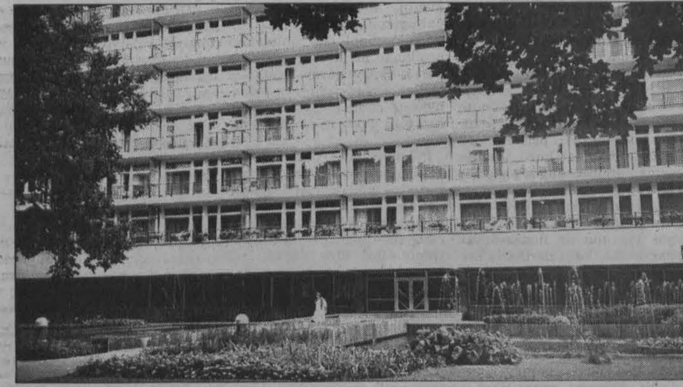
Druskininkų „Lietuvos“ sanatorija. Nuotr. O. Rušenienės