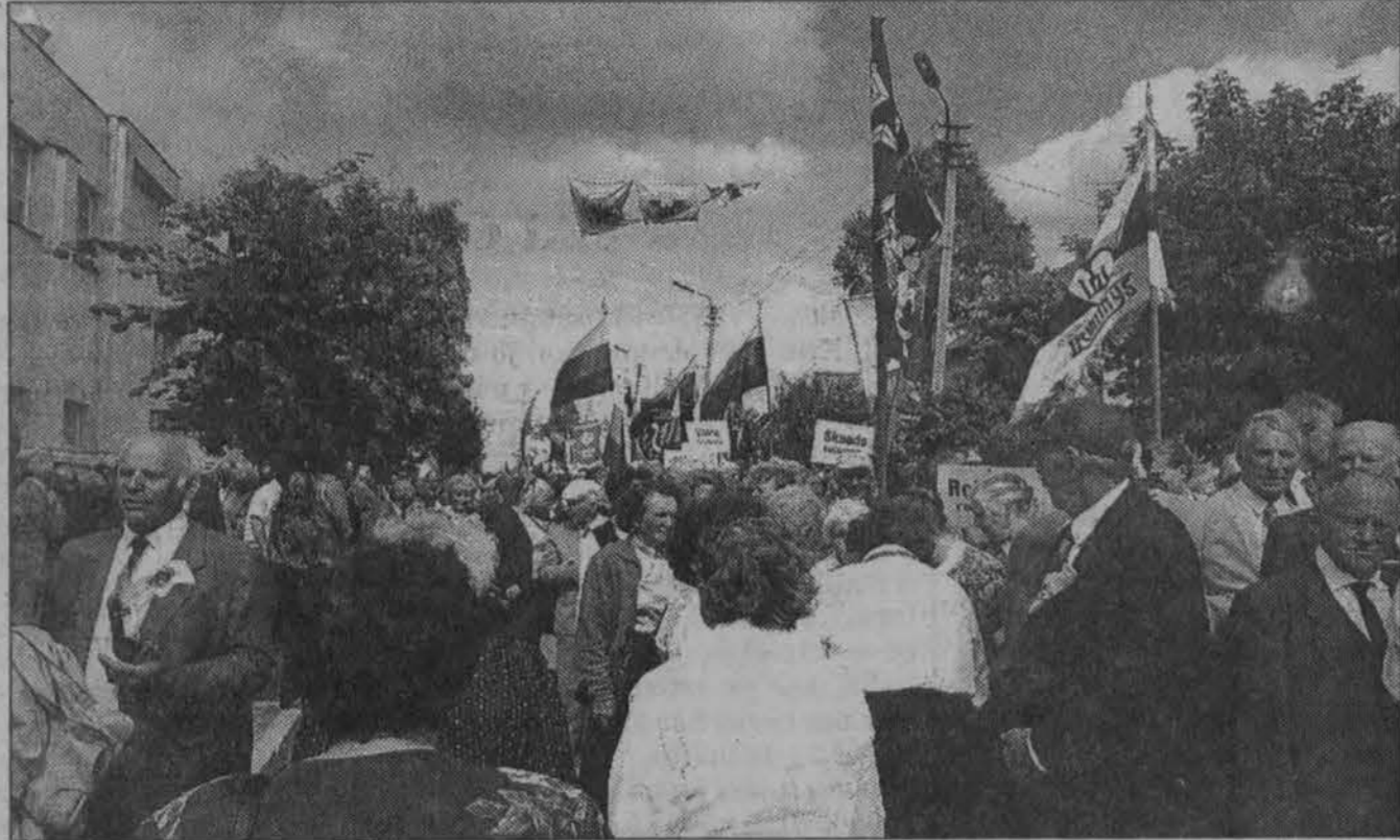
Minios po Mišių rikiuojasi eisenai į Dubysos slėnį.

Dabar Ariogalos aštuntoji šventė jau nukeliavo į istorijos knygą, bet jos dalyviai, jos vaizdai, jos jausmai niekada nepradings iš mano minčių. Nepradings ir tie žmonės, be kurių aukų aš nebūčiau galėjęs stovėti tenai — Dubysos slėnyje.