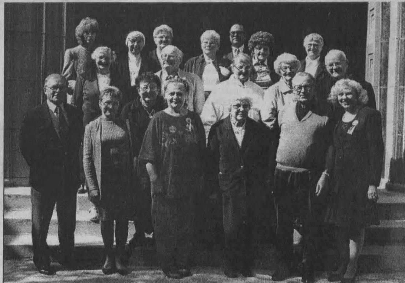
Čikagos apskrities šv. Pranciškaus seselių vienuolyno rėmėjų metinio seimo dalyviai prie tėvų marijonų vienuolyno 1998 m. spalio 4 d.

Po rugpiūtės, bulvakasio, nurinkus daržuose užsilikusias paskutines daržoves, Mažosios Lietuvos ūkininkas spalio savo šeimyna spalio