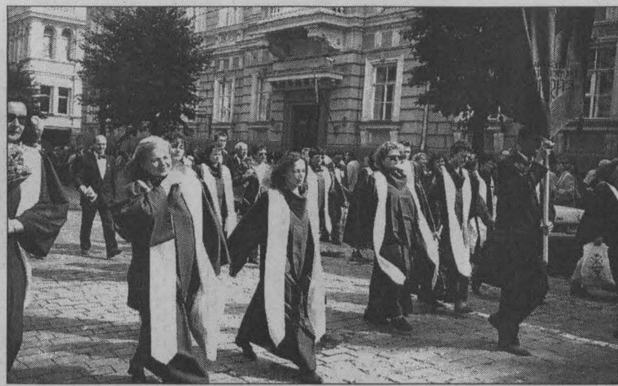
Pasaulio Lietuvių dainų šventės paradas, vykęs liepos 6 d. Vilniuje. Žygiuoja Anykščių Šv. Mato bažnyčios choras.

Suaugusiųjų ansambliai šoko įvairesnius, apeiginius, vestuvinius šokius, nepamiršo ir trankių „pasiutpolkių“, ir elegantiškų valsų.