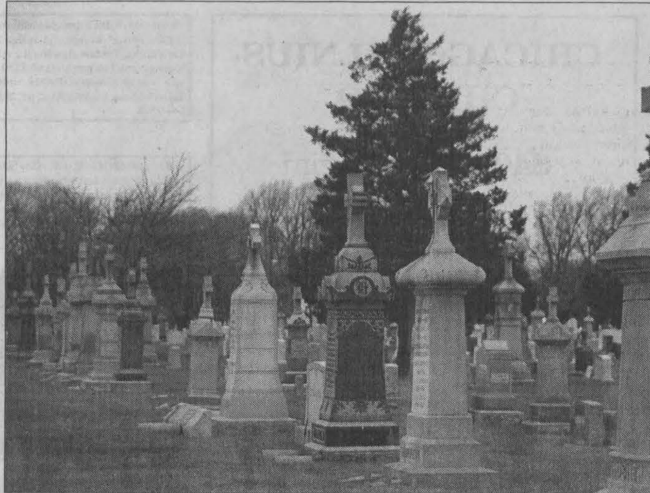
Vėlinės Šv. Kazimiero lietuvių kapinėse Čikagoje.

— Tėte, man turtai ir išsimokslinimas būsimio vyro nerūpi. Ištekėsiu, kad ir už fabriko darbininko. Svarbu, kad ji pamiltų karštą meilę, kuri