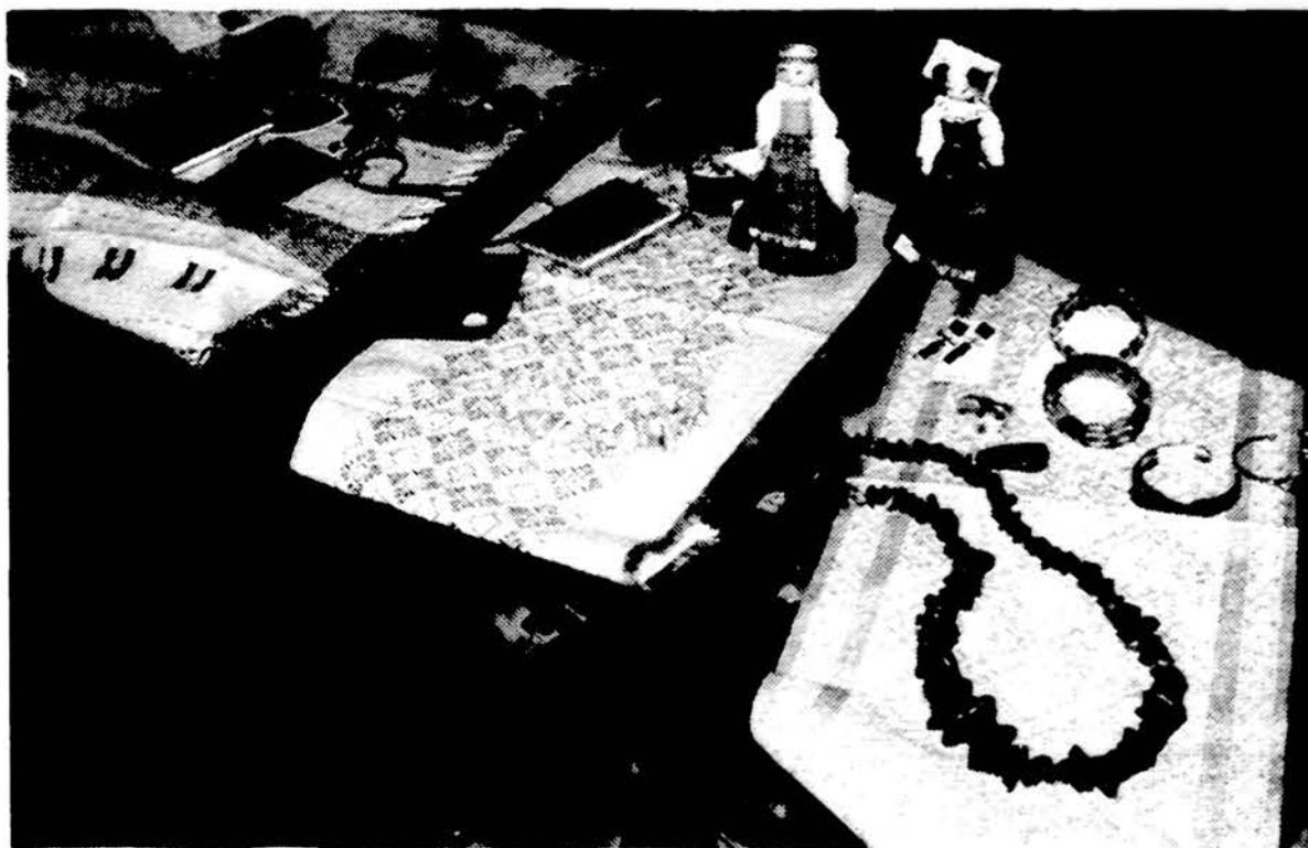
„Draugo“ krautuvelėje — daug kalėdinių ir kitoms progoms dovanų...