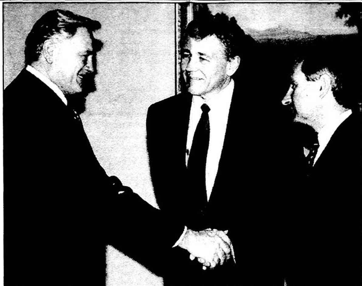
Nuotr.: (Iš kairės) Lietuvos prezidentas Valdas Adamkus priima Vilniuje viešinius JAV senatorius — republikoną Chuck Hagel ir demokratą Jack Reed.