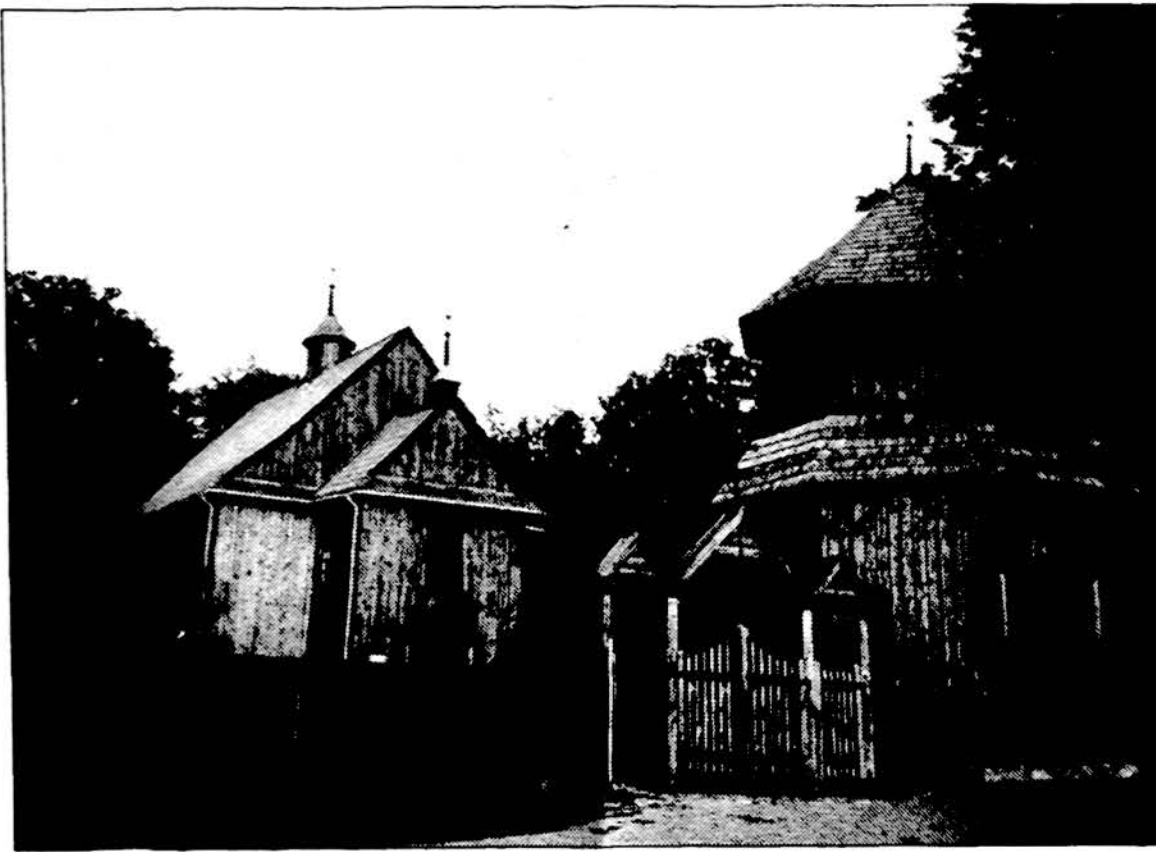
Medinis barokas — Palūšės Šv. Juozapo parapijos bažnyčia ir varpinė.

Tačiau Dievas nereikalauja tobulos maldos. Juk yra momentų, kai visai negalim susikaupti, tiesiog negalim melstis. Paaukojus tuos sauros momentus Dievui ir bus tikra,