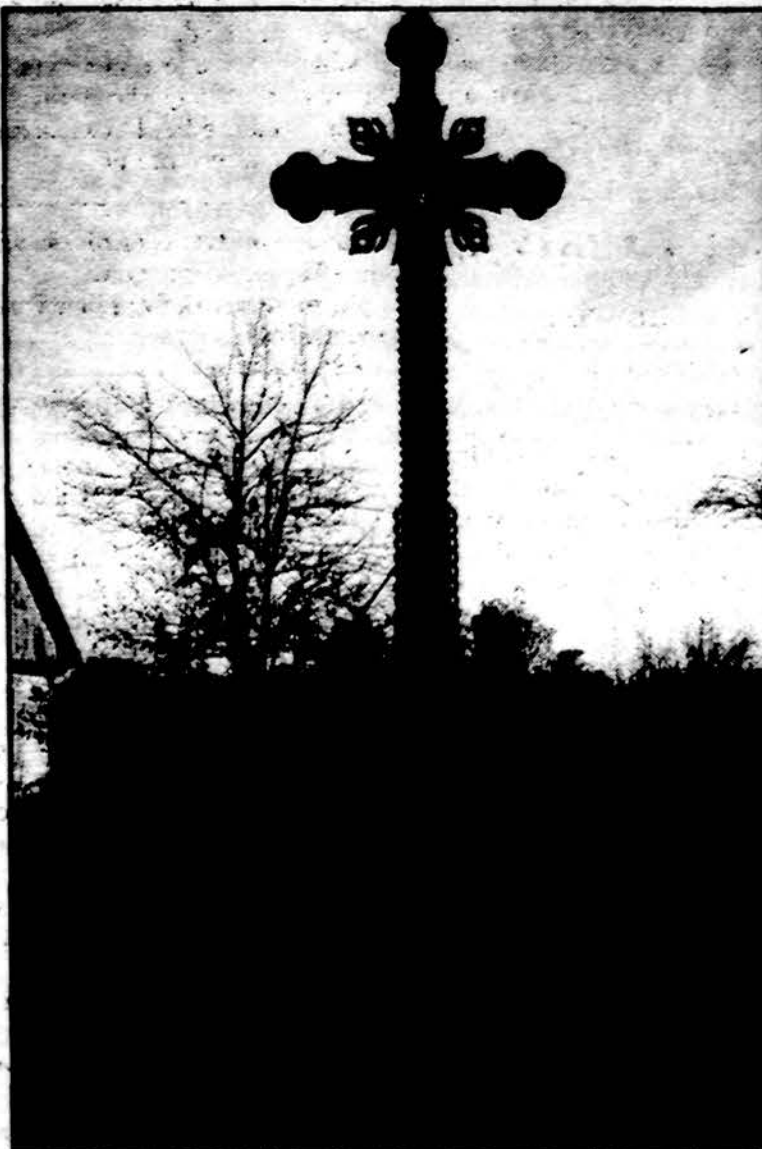
Kryžius Juodbudžio kaime, partizanų Lukšų tėviškėje.