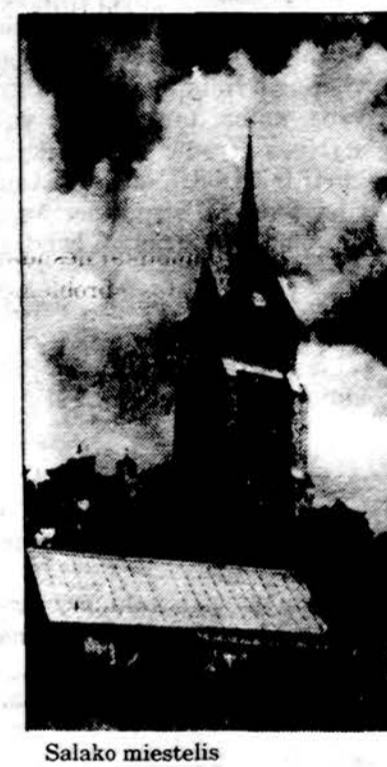
Salako miestelis

Arkivyskupas K. Sepė aiškino, kad nacionalinės vyskupų konferencijos turi peržiūrėti visus konkursui pateiktus darbus ir nustatyti savo šalies laureatus pagal kiekvieną kategoriją. Paskui po tris geriausių kiekvienos amžiaus grupės darbus reikės pasiūsti Vatikano jubiliejiniam komitetui. Vatikano komisija nusta-