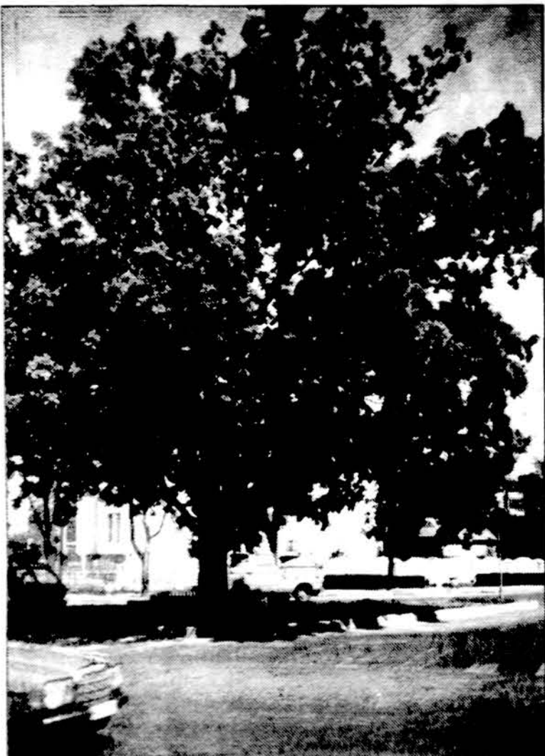
Ažuoliukas Šilalės miestelio centre. Jis sodintas 1930 m. Vytauto Didžiojo 500-osioms metinėms paminėti, dabar jau dideliu medžiu užaugęs.

Lietuvoje, kaip ir anksčiau, turtuolių nėra. Turtingais sa- vęs nelaiko niekas, o pasitu- rinčiais — tik 1,5 proc. ap- klaustų namų ūkių. R.J.