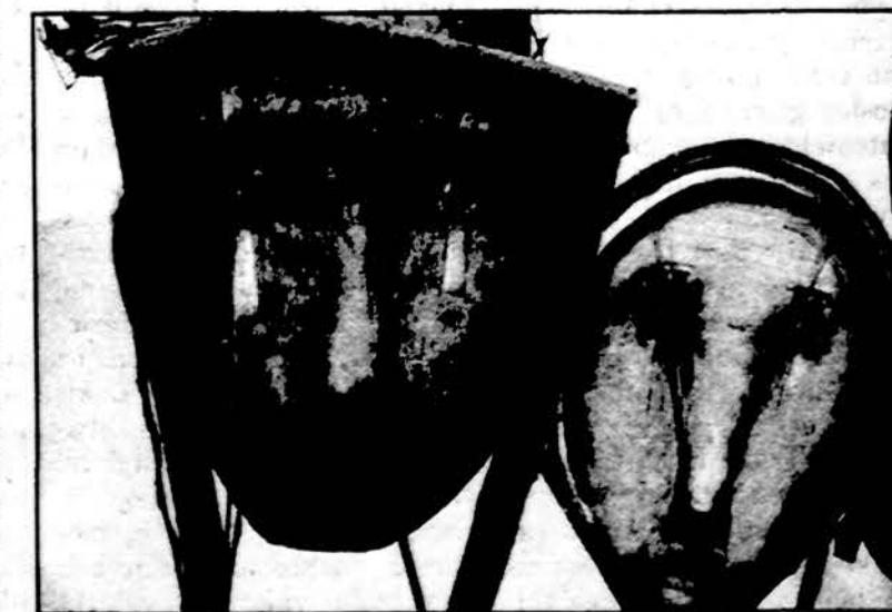
Dail. Stasio Eidrigevičiaus kaukės.

mas parodė, kad iki šiol augu- sios namų ūkių pajamos ir išlaidos žiemą truputį suma- žėjo.