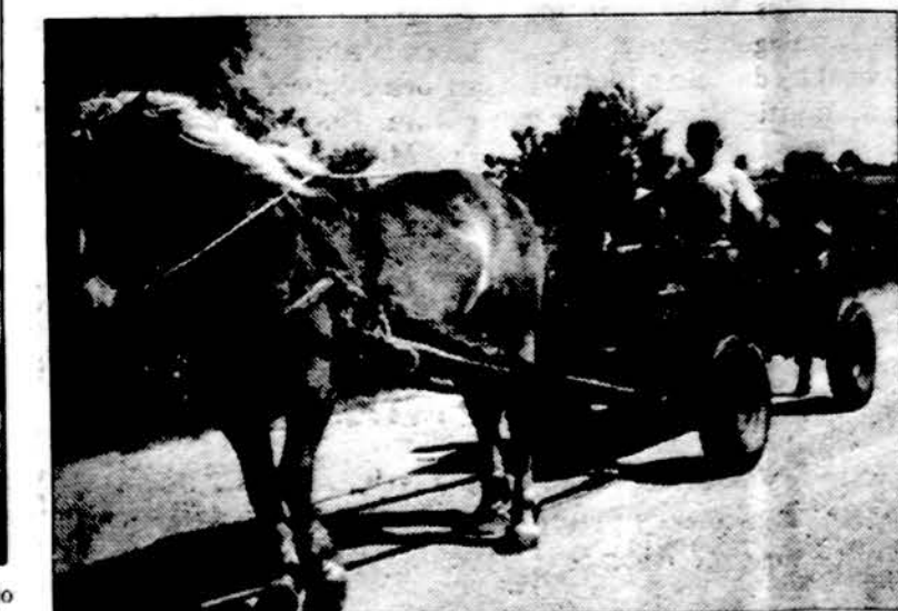
Lietuvos ūkininkas su šeima.

Garsaus kraštiečio jubilieji- nę sukaktį Lietuvai primena panevėžiečiai. Dailininko S. Eidrigevičiaus 50-mečiui Panevėžio galerijoje „2-asis aukš- tas“ atidaryta paroda „Atsi-