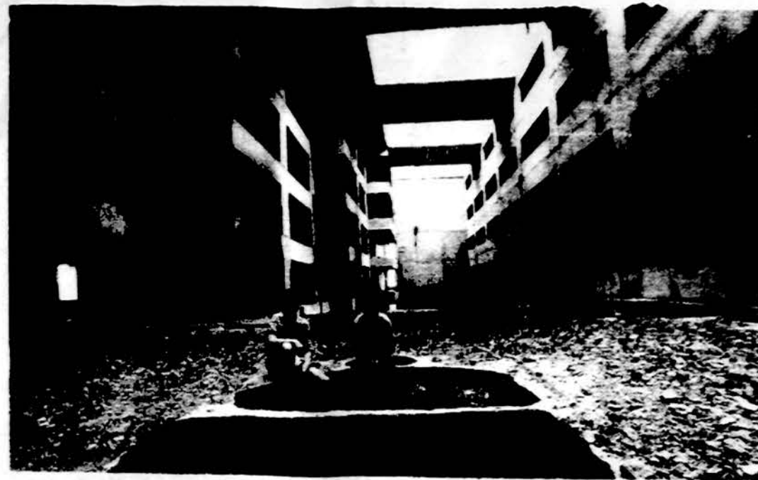
Naujai statomas kalėjimas Vilniaus apylinkėje.