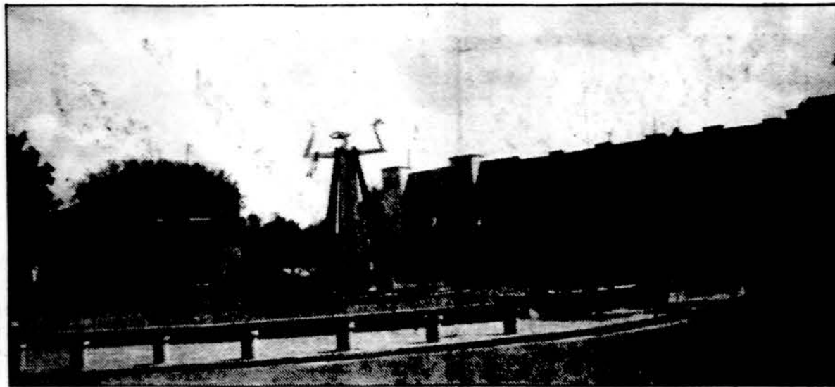
1991 m. pastatytas plokštinis Laisvės paminklas Šilalėje.

Tik spėjus gimnazijai savo 2-ą abiturientų laidą išleisti, Šilalė patenka į kraupią so- vietinę okupaciją. Dar ir da- bar nera suvesta, kiek Šilalės žmonių išvežta į Sibirą, kiek išžudyta kalėjimuose, kiek zu- vusių partizanų ar dingusių be žinios. 50-tį metų trukusi okupacija malė viską. Visas mūsų puoselėtas geras idėjas bei moralę mynė į purvus. Bet šilalėškis yra žemaitis, ir jokia jo auka nemiršta be prasmės. Štai 1991 jie su tri- spalve, skanduodami „Lietu- va, Lietuva!“ žygiuoja prie Vy- tauto Didžiojo ažuoliuko ir ima statyti Laisvės paminklą.