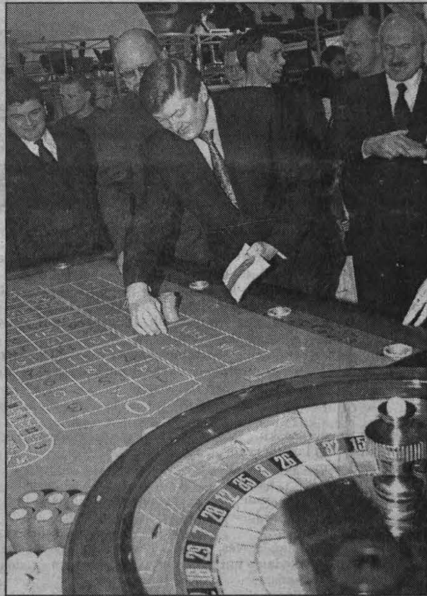
Vilniuje, parodų centre „Litexpo“, trečiadienį atidaryta 8-toji informacinių technologijų, telekomunikacijų ir raštinės įrangos paroda „Infobalt 2001“, kurios plotas — apie 11,300 kv. metrų. Šiais metais parodoje dalyvavo 190 iš aštuonių valstybių — Latvijos, Estijos, Švedijos, Norvegijos, Suomijos, Rusijos, Lenkijos, Čekijos firmos. Lankytojai susipažins su įvairiomis vaizdo, garso ir kompiuterių galimybėmis bei kitomis informacinių technologijų naujovėmis.

* „Miltelių teroristai“ nesiliauja laiškuose siuntinėję neišskios sudėties miltelius. Policijos pareigūnai užregistravo dar 6 laiškus, kuriuose rastos nenustatytos kilmės medžiagos. Vilniaus Druskių gatvės gyventojas trečiadienį savo pašto dėžutėje rado laišką su neišskios kilmės milteliais. Antradienį rytė Panevėžyje, Molainių gatvėje 14 name įrengtoje pašto dėžutėje rastas maišelis su baltais milteliais. Tą pačią dieną Šakiuose Vasario 16-osios gatvės gyventojas gavo įtartina laišką su atgaliniu adresu JAV. Vilniuje antradienį Didžiosios gatvės gyventojas savo pašto dėžutėje rado įtartina voką, ant kurio užrašytas atgalinis adresas „Vašingtonas, JAV“. Maziškių pašte, esančiame Laisvės prospekte, laišku rūšiavimo patalpoje rastas vokus su neišskios kilmės turiniu. Antradienį vakare Varėnoje, Vytauto gatvės 46-ajame name įrengtoje pašto dėžutėje rastas vokus su milteliais. Visus rastuosius vokus su milteliais išsivežė minėtų miestų. Visuomenės sveikatos centrų darbuotojai. Visuomenės svei-