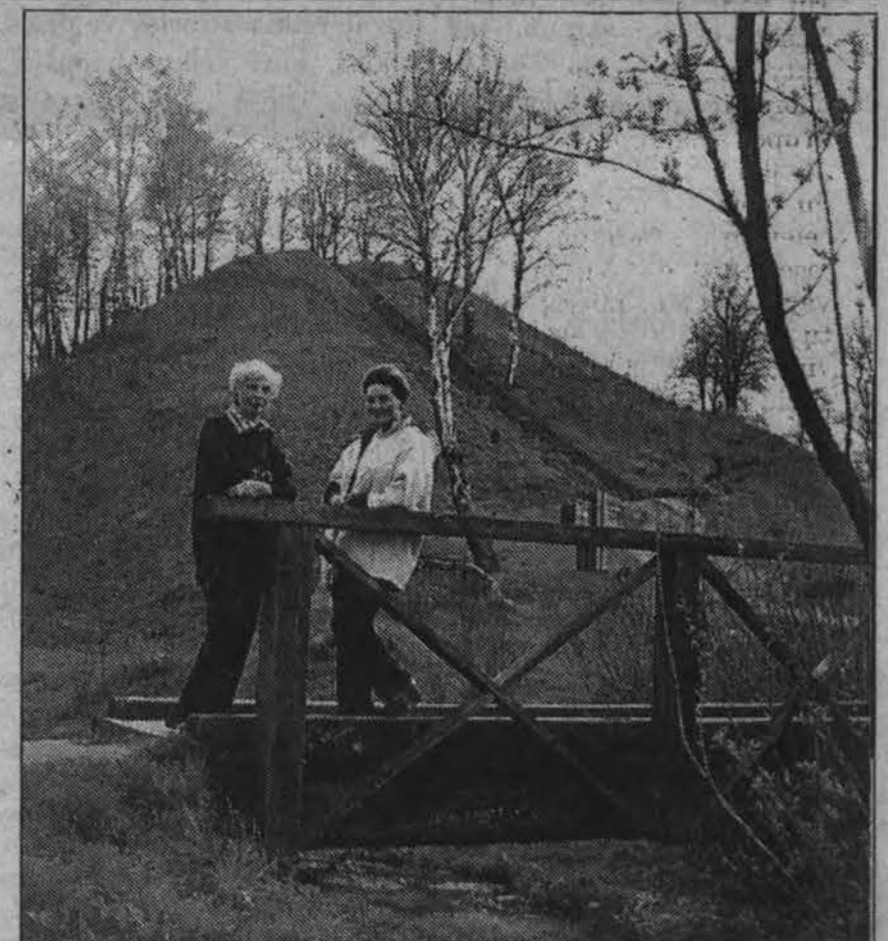
Prie Merkinės piliakalnio.

Jau pirmas aukštas atrodė karališkai. Bet dar aukščiau viliojo laiptai tokie, kokiais iškilmingai ir gracingai laipioja Hollywood artistės, vaidinančios princeses. Užlipau ir aš, negracingai, bet tyliai. Pataikiau į santuokų salę. Puošnumas, kaip Marijos Terezijos